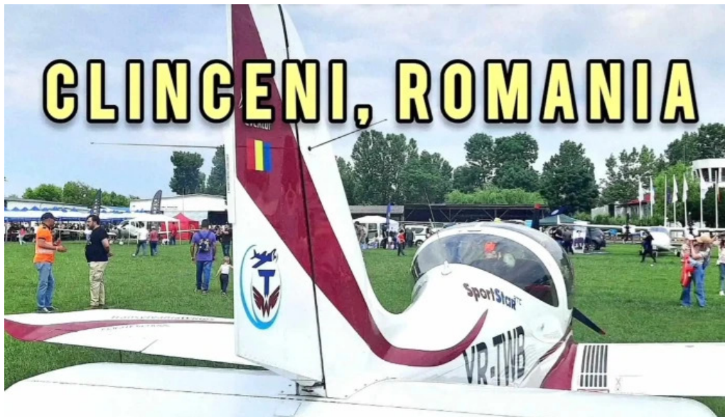
Aerodromul clingeni clingeni