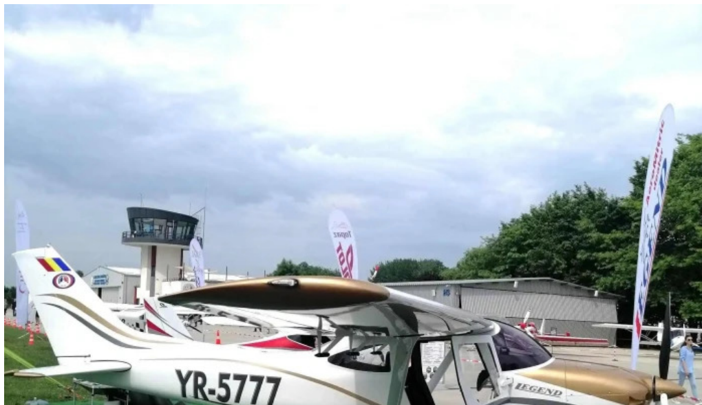
Aerodromul clingeni catalog