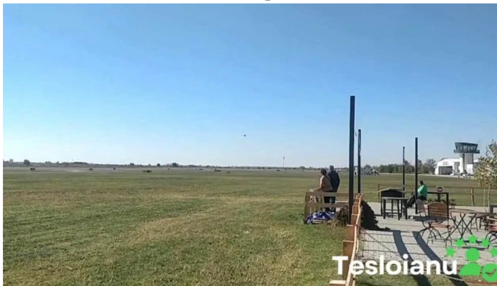
Aerodromul clinceni videoclipuri