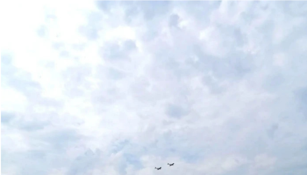
Aerodromul clinceni cum s? ajungi acolo