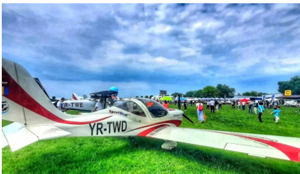
Aerodromul clinceni adres?