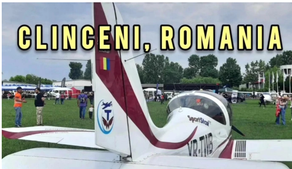
Aerodromul clinceni aproape de mine