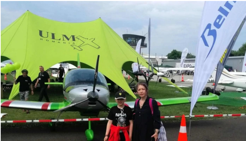
Aerodromul clinceni comentarii