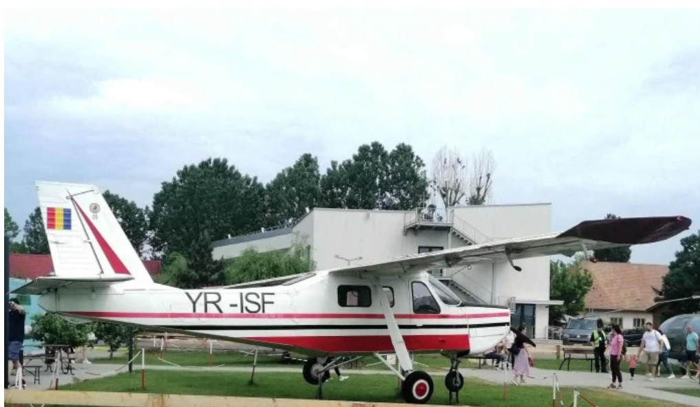
Aerodromul clinceni num?r