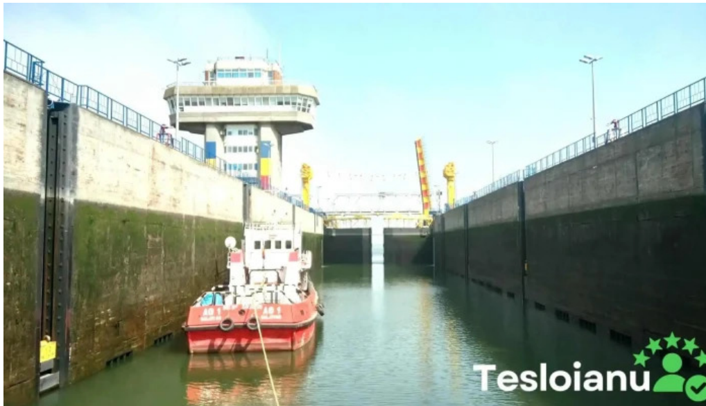
Ecluza agigea deschis acum