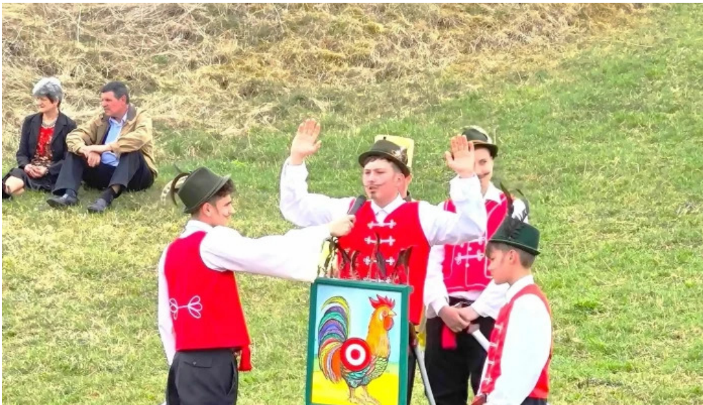
Impuscatul cocosului la apata apa?a