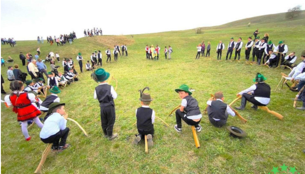
împu?catul coco?ului la apa?a apa?a