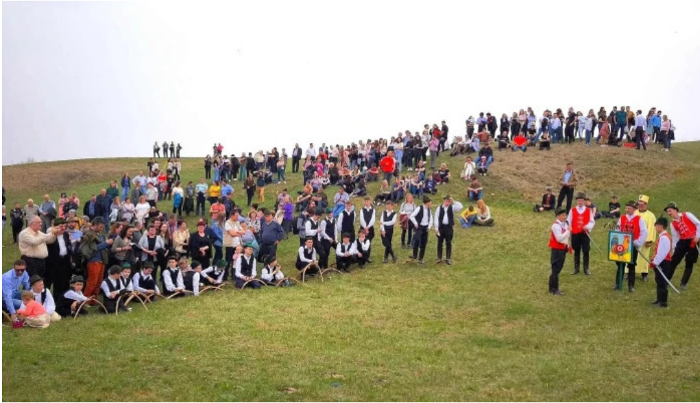
Impuscatul cocosului la apata telefon