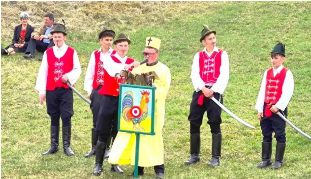
Impuscatul cocosului la apata loca?ie