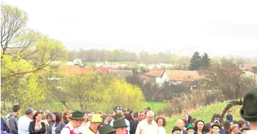
Impuscatul cocosului la apata videoclipuri