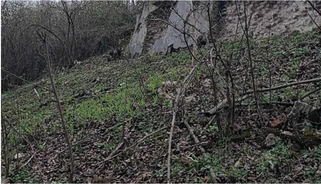
Ruinele castelului degenfeld videoclipuri