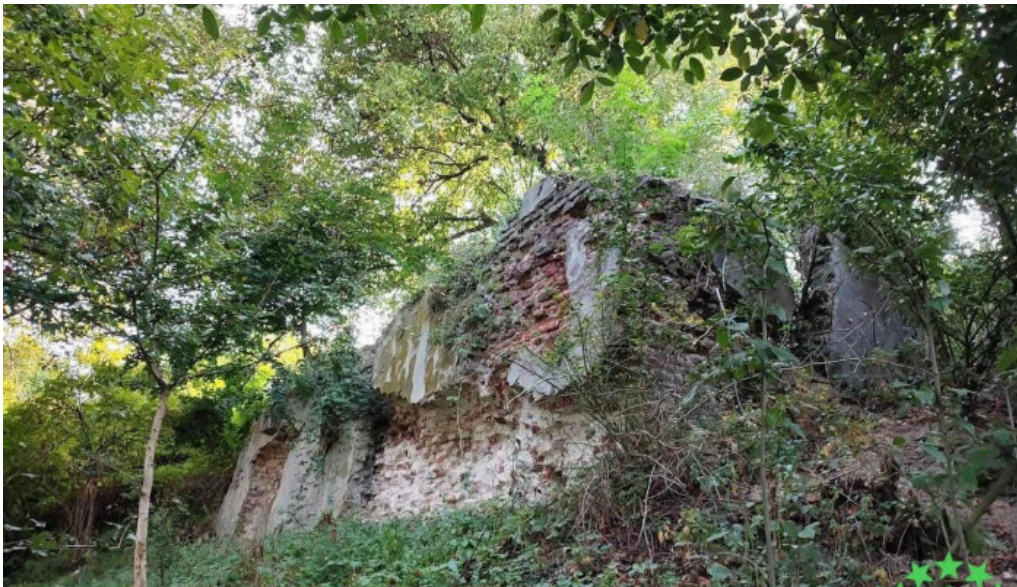
Ruinele castelului degenfeld ardușat