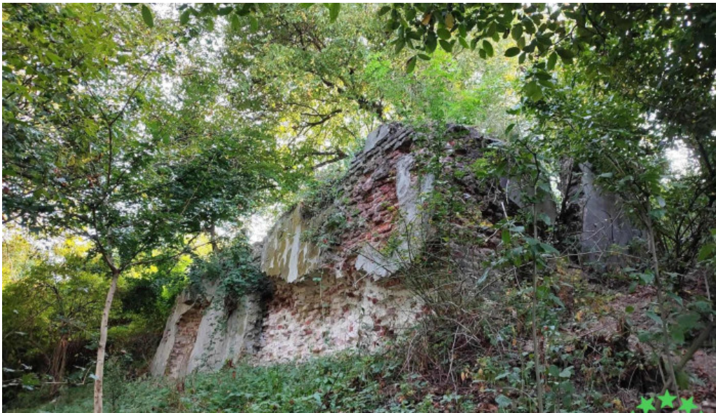
Ruinele castelului degenfeld pre?uri