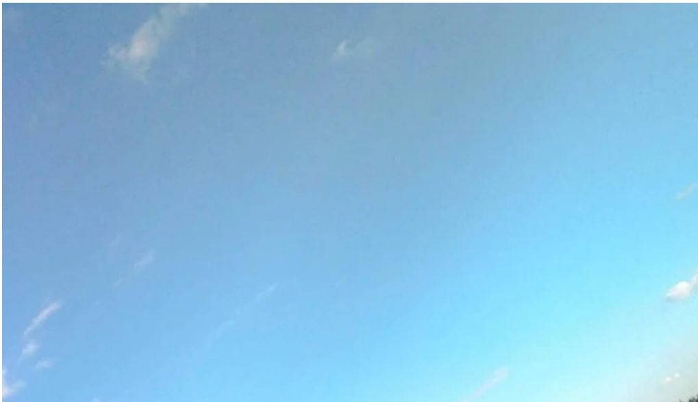
Berca view berca