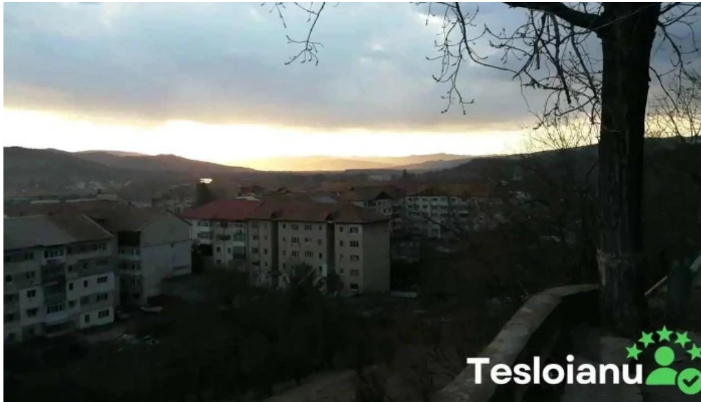
Berca view videoclipuri