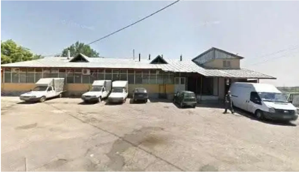
Berca view street view si 360deg