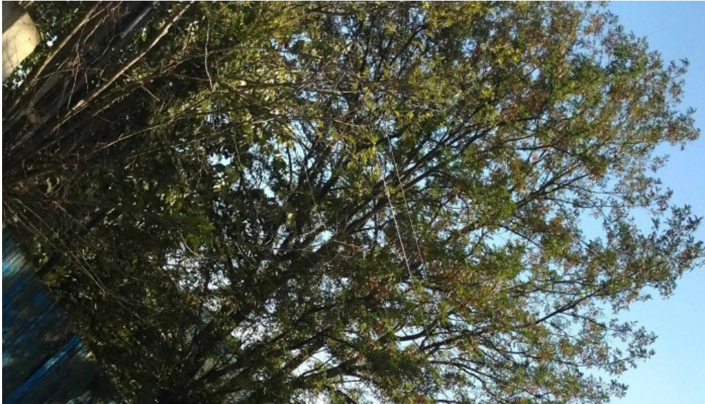
Berca view catalog