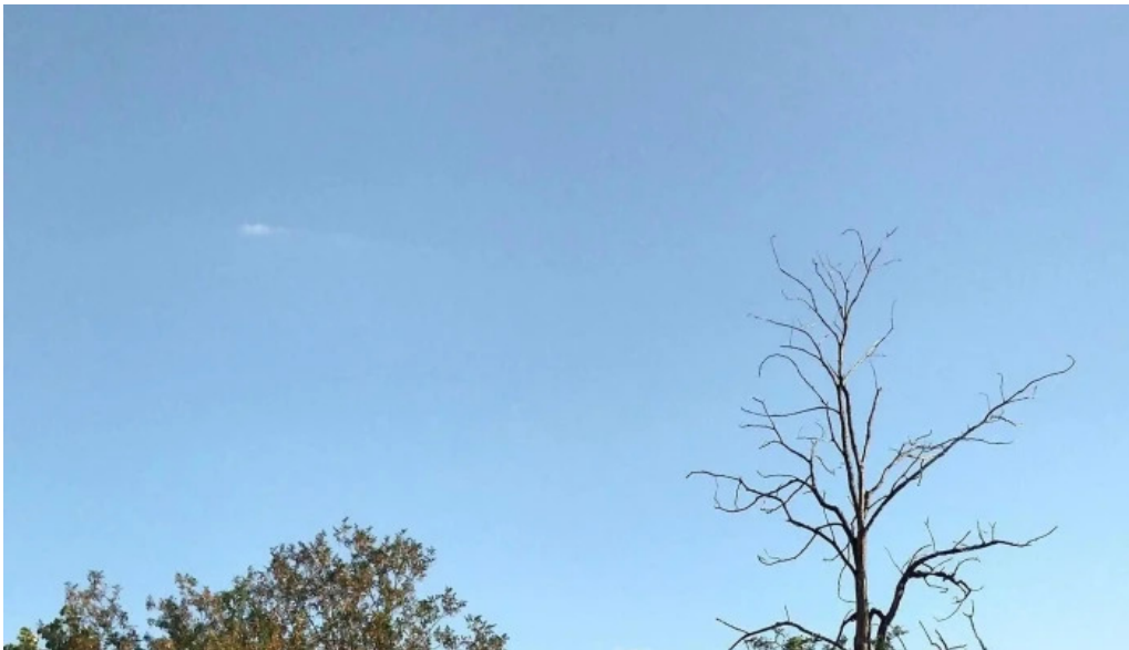
Berca view loca?ie