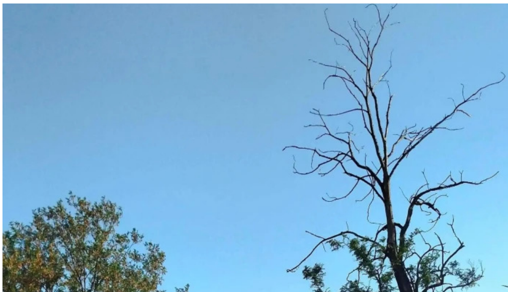
Berca view telefon