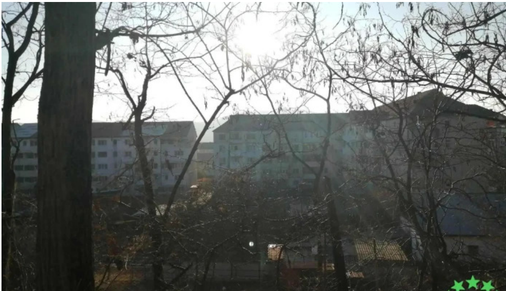
Berca view munte