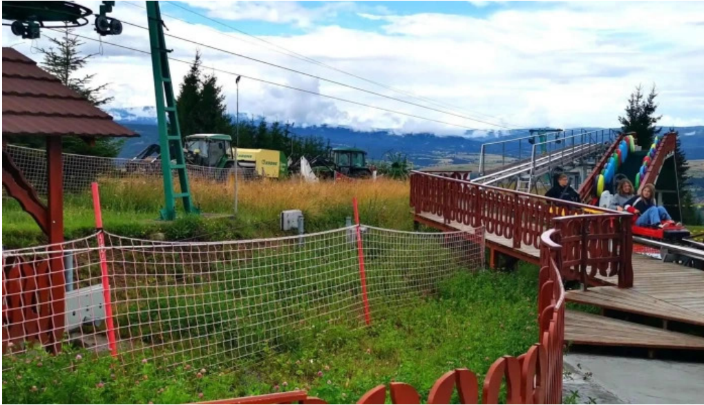
Izvorul 10 loca?ie