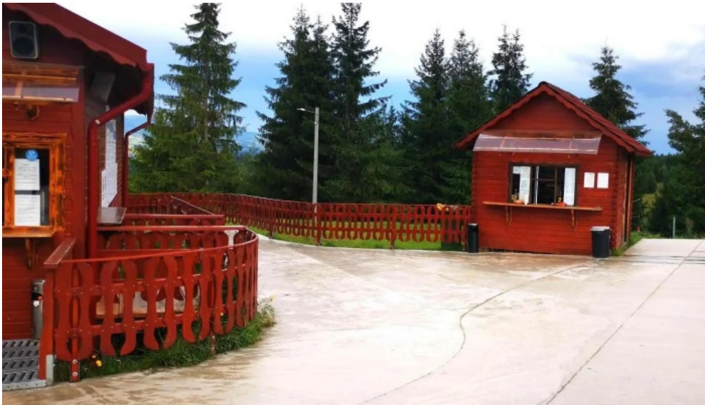
Izvorul 10 num?r