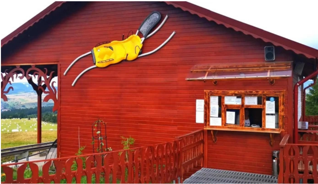
Izvorul 10 comentarii