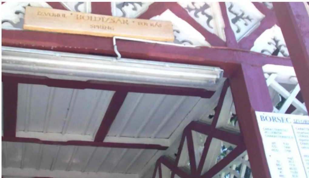
Izvorul 10 site web