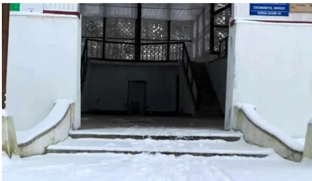
Izvorul 10 videoclipuri