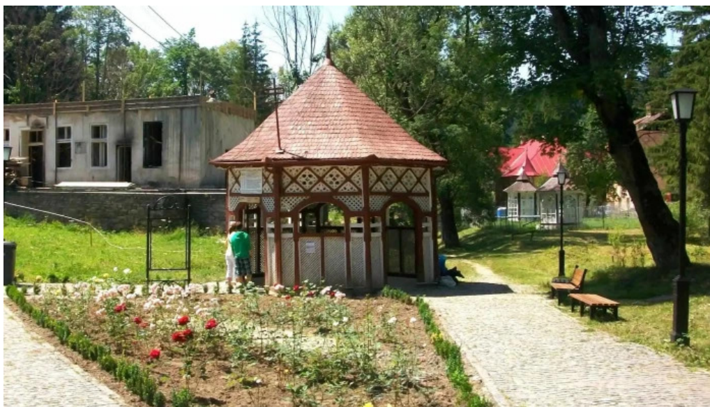
Izvorul 10 adres?