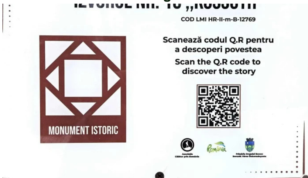
Izvorul 10 zon?