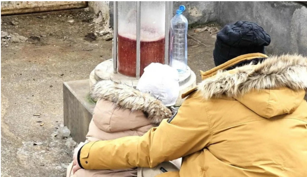
Izvorul 10 borsec