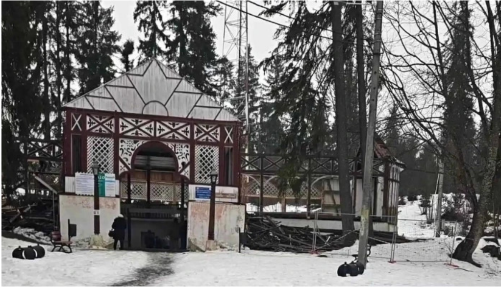
Izvorul 10 program