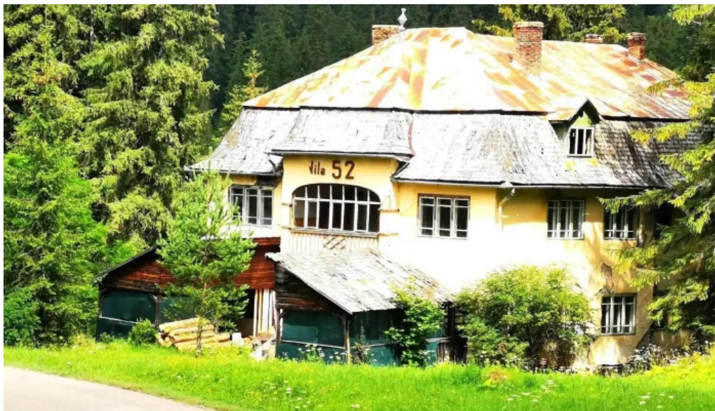
Izvorul 10 recenzii