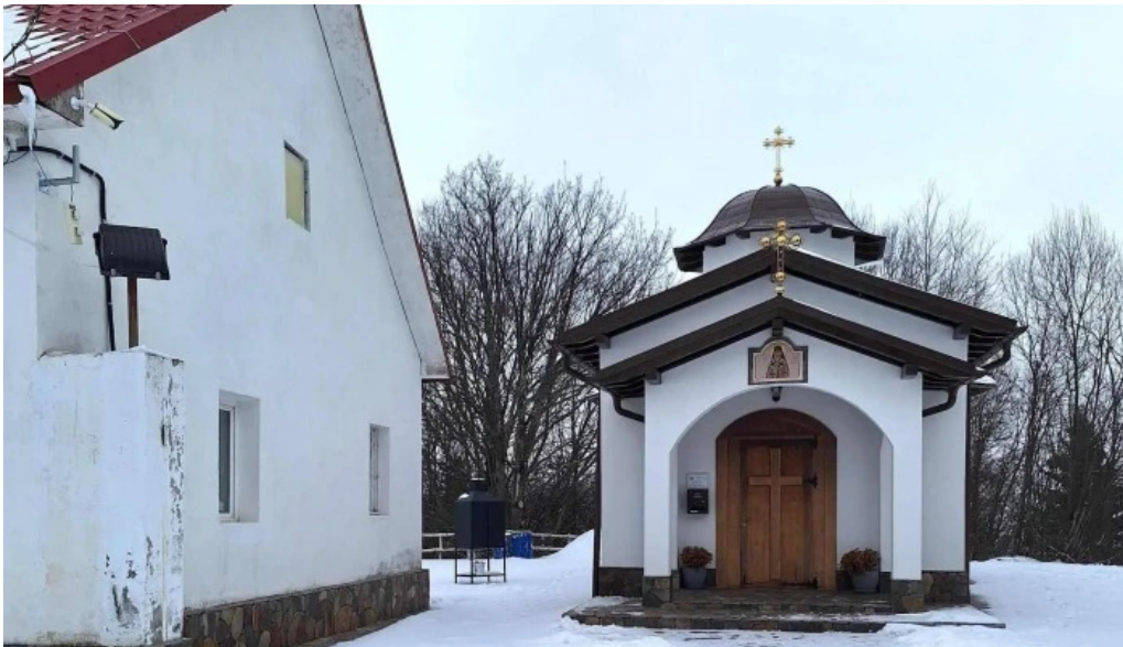
Garana brebu nou