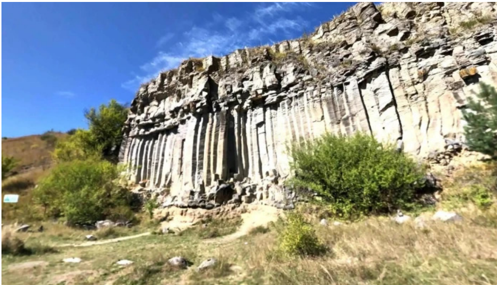
Coloanele de bazalt de la racos street view si 360deg