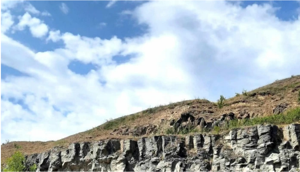
Coloanele de bazalt de la racos site web