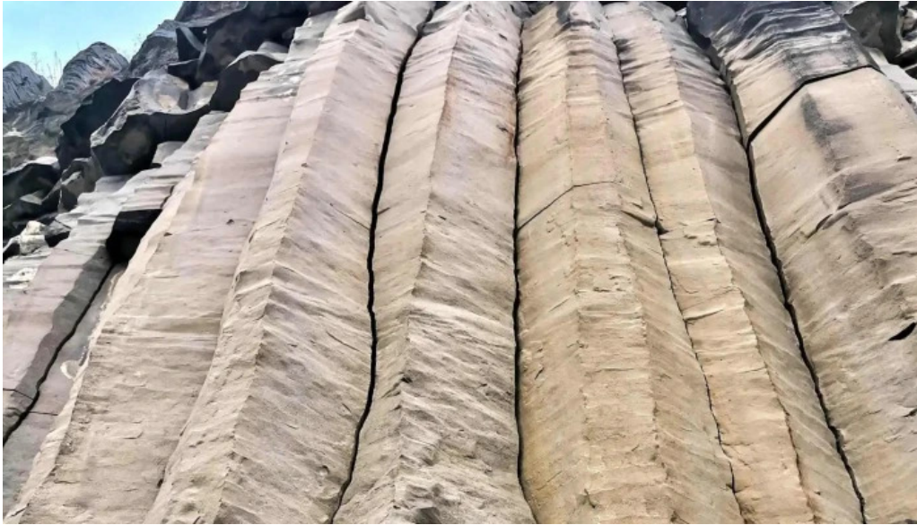
Coloanele de bazalt de la racos num?r