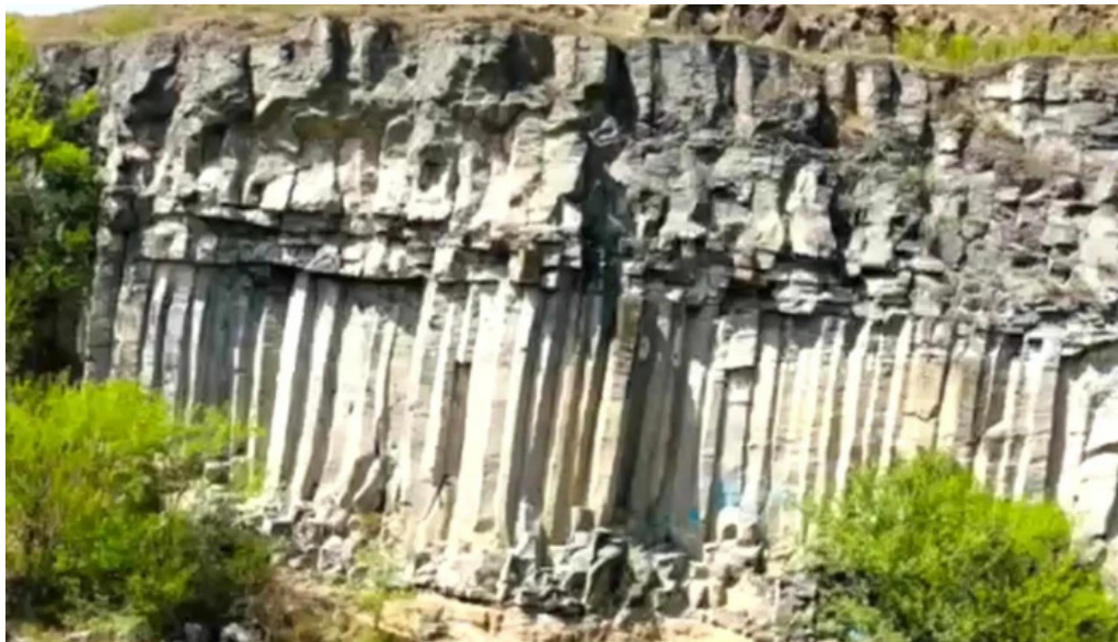
Coloanele de bazalt de la racos comentarii