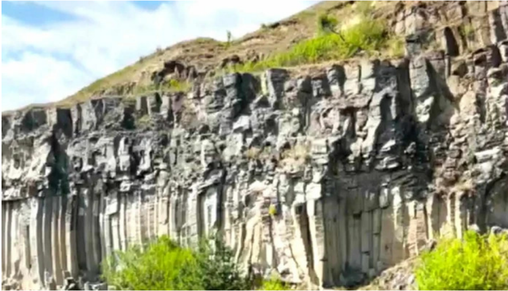
Coloanele de bazalt de la racos telefon