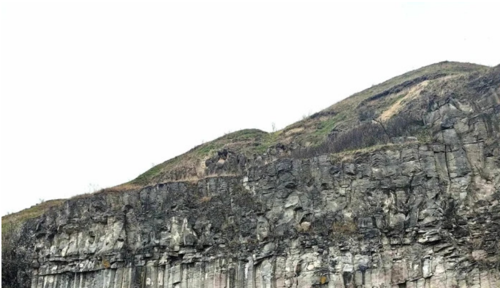
Coloanele de bazalt de la racos raco?