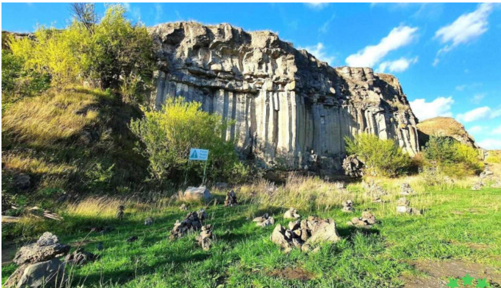
Coloanele de bazalt de la racoș racoș