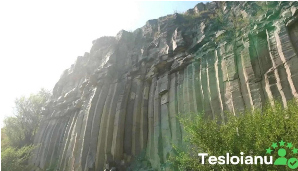
Coloanele de bazalt de la racos munte