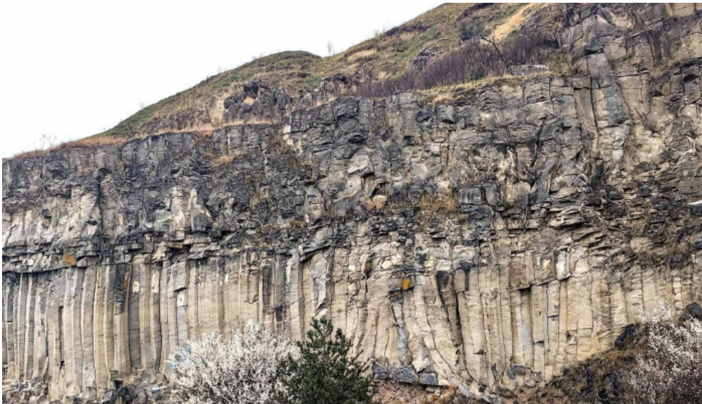
Coloanele de bazalt de la racos unde