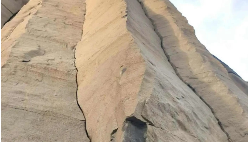
Coloanele de bazalt de la racos cele mai recente