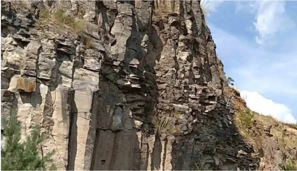
Coloanele de bazalt de la racos videoclipuri