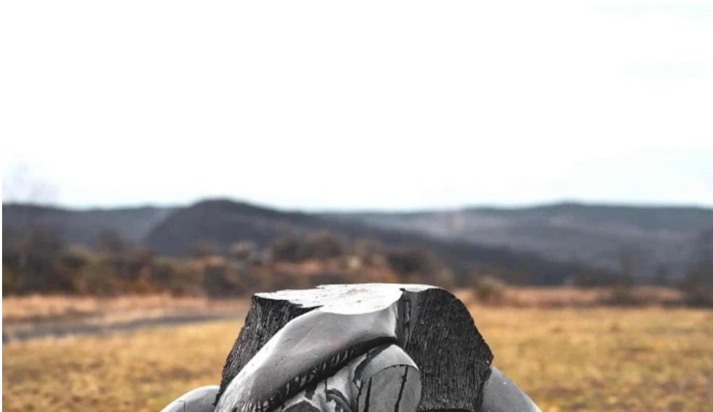
Coloanele de bazalt de la racos catalog