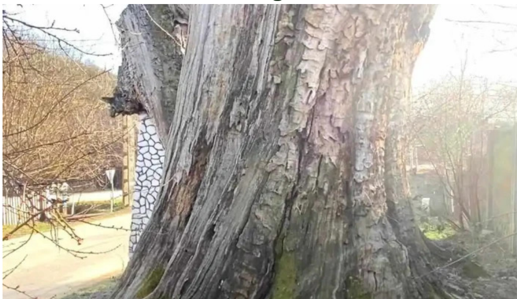
Stejarii seculari videoclipuri