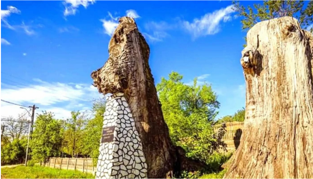
Stejarii seculari stejari