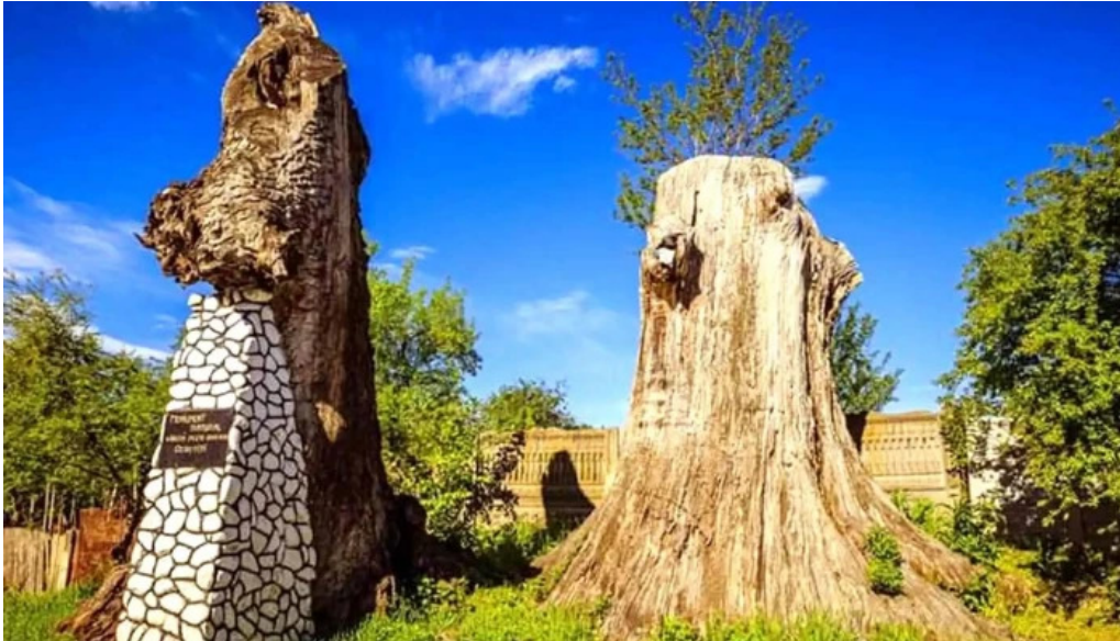
Stejarii seculari program