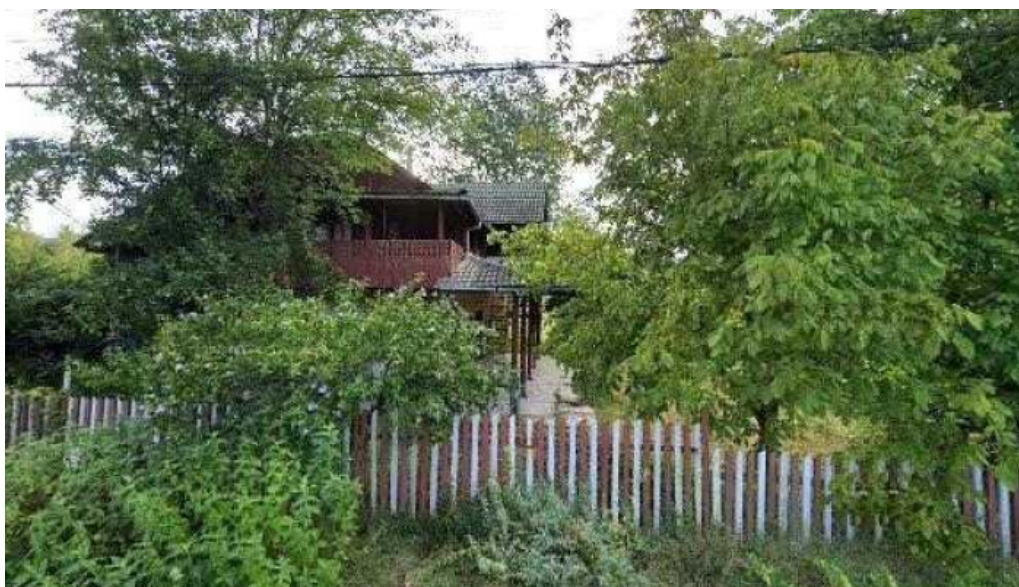
Stejarii seculari street view si 360deg