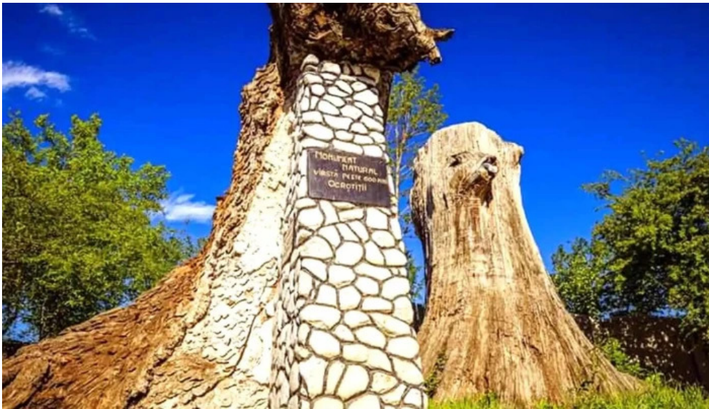
Stejarii seculari recenzii