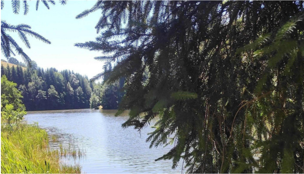
Statiunea trei ape brebu nou scor