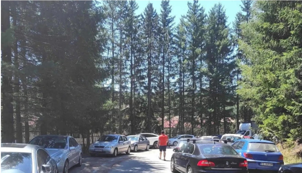
Statiunea trei ape brebu nou teregova