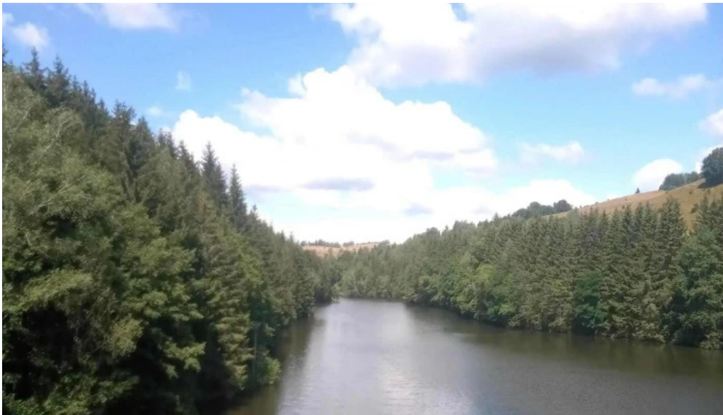
Statiunea trei ape brebu nou num?r