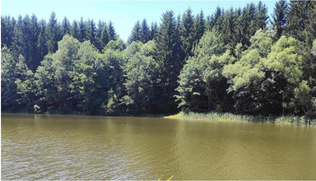
Statiunea trei ape brebu nou zon?