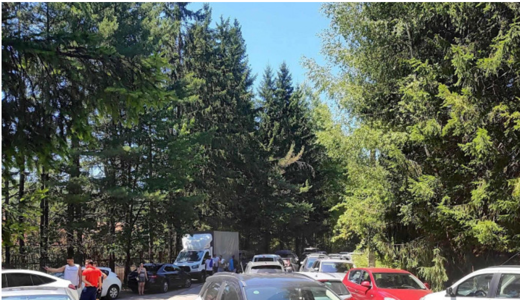
Statiunea trei ape brebu nou aproape de mine