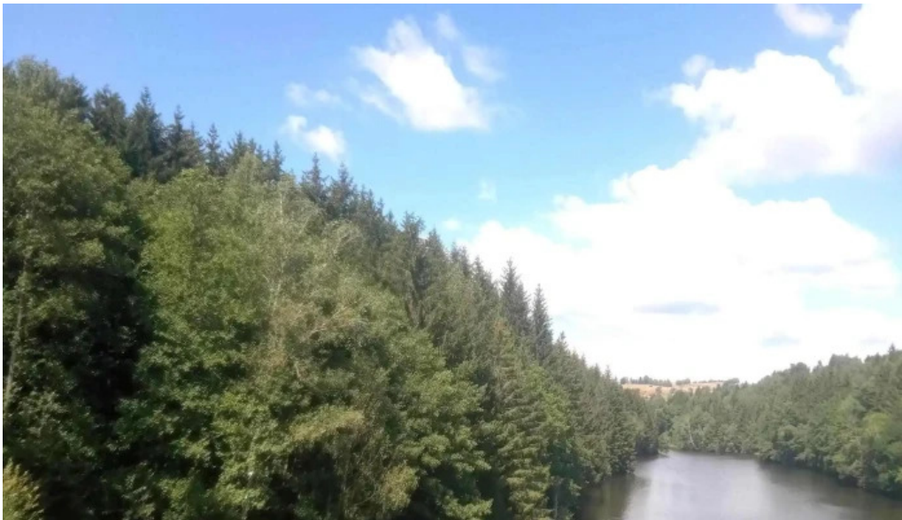
Statiunea trei ape brebu nou cum s? ajungi acolo