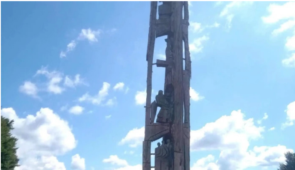
Statiunea trei ape brebu nou reduceri