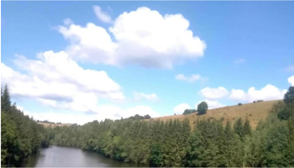
Statiunea trei ape brebu nou promo?ie