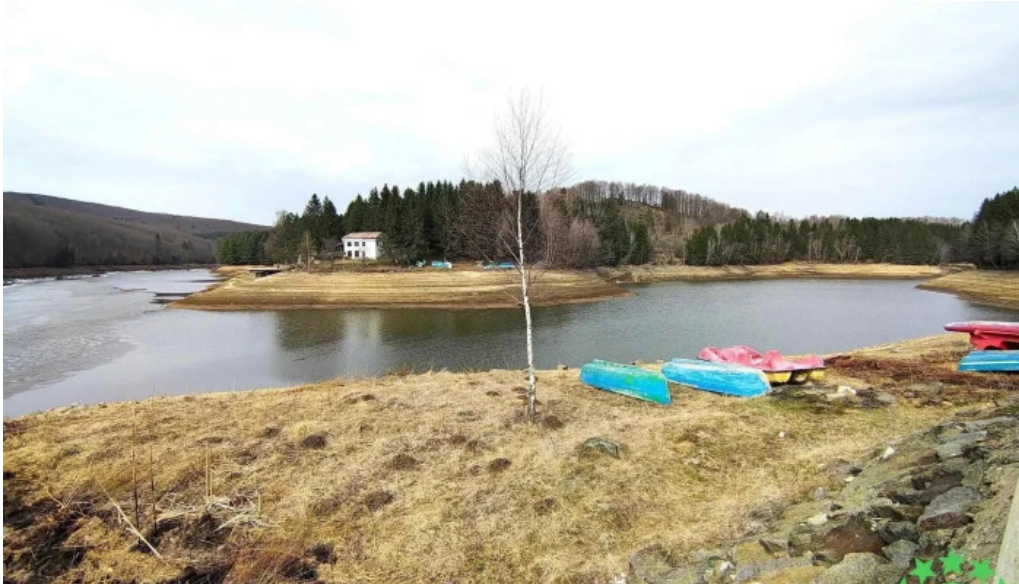
Statiunea trei ape brebu nou cele mai recente