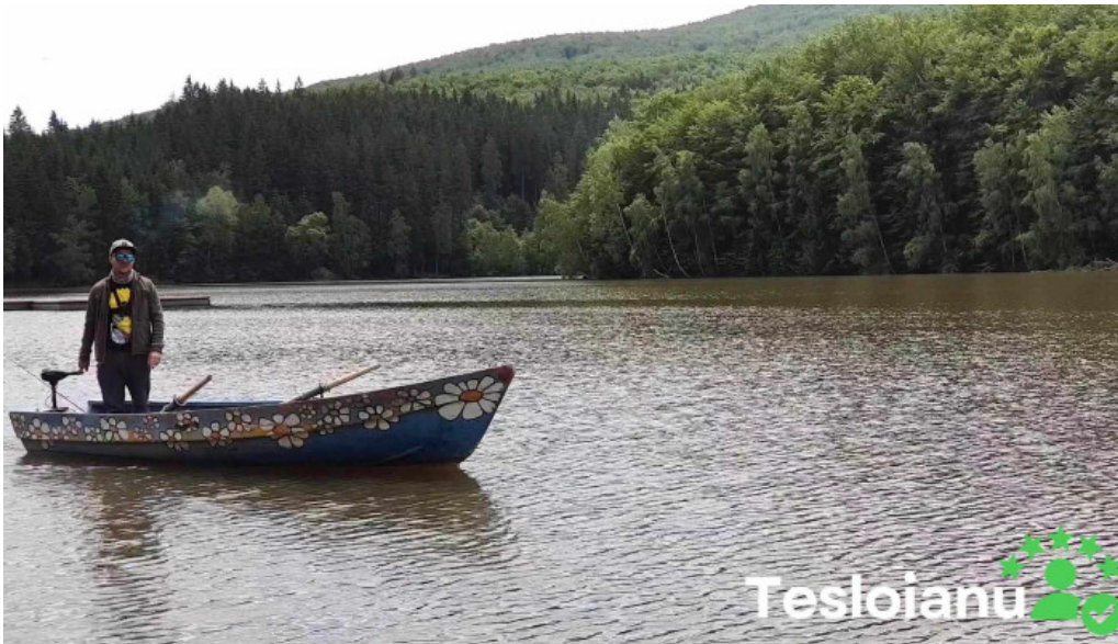
Statiunea trei ape brebu nou videoclipuri