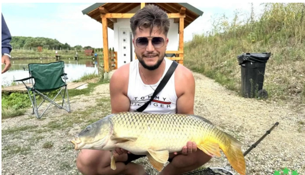
Lac sieu scor