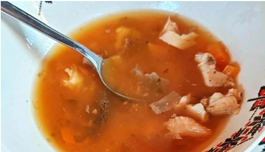
La sote num?r