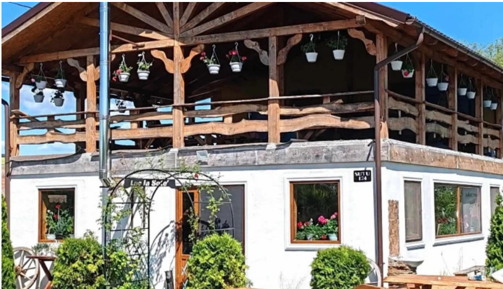
La sote comentarii