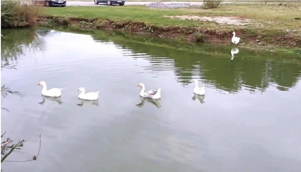
La sote cum s? ajungi acolo