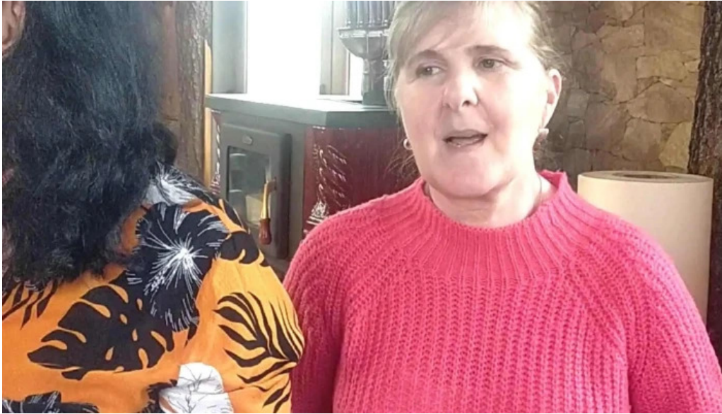
La sote telefon