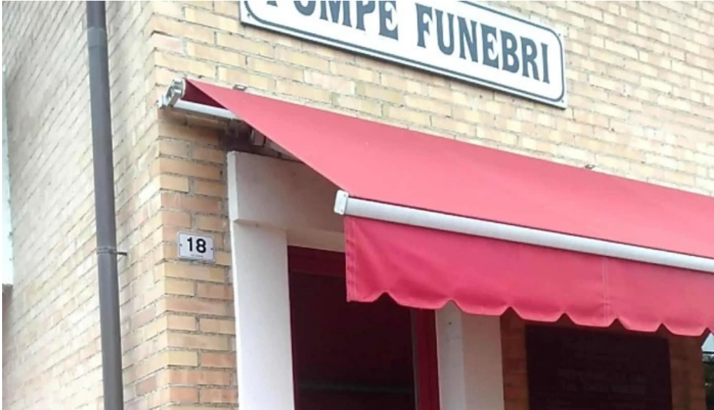
La sote ?utu