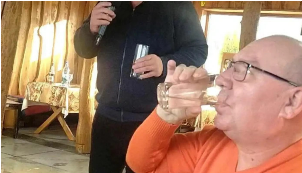
La sote videoclipuri