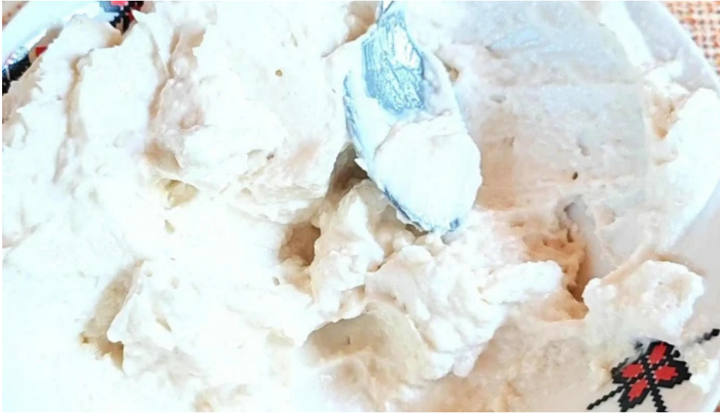
La sote instagram