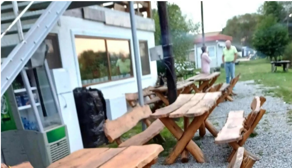
La sote scor