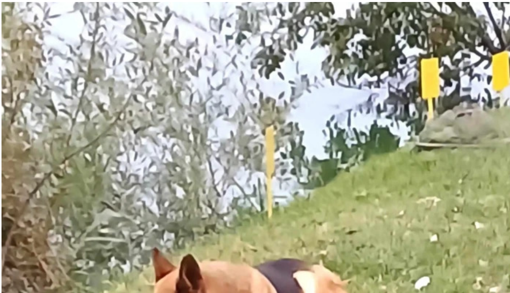
La sote reduceri