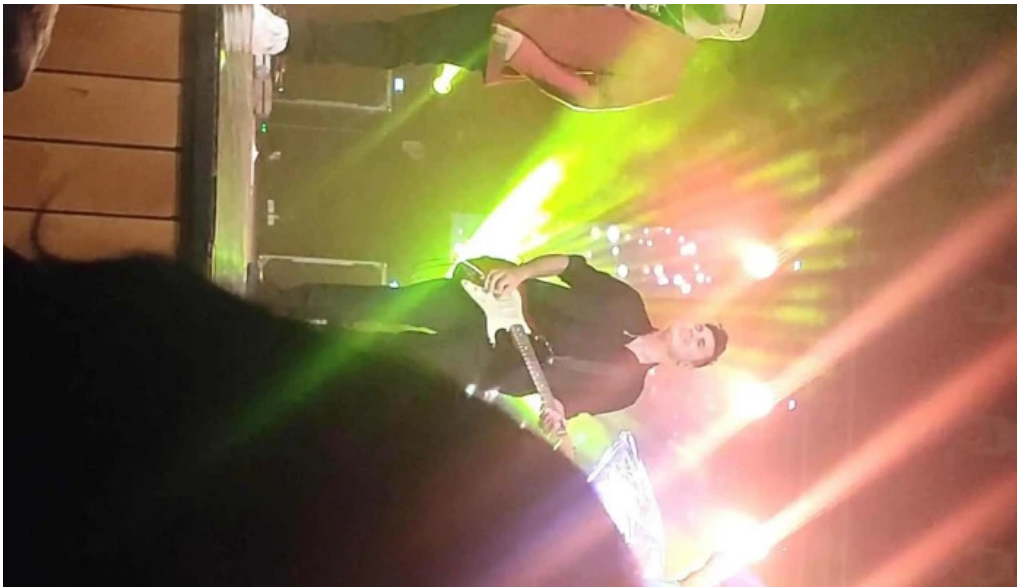
Casa de cultura a sindicatelor recenzii