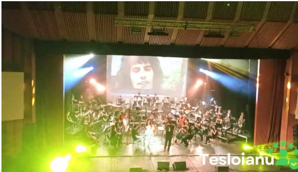
Casa de cultura a sindicatelor videoclipuri