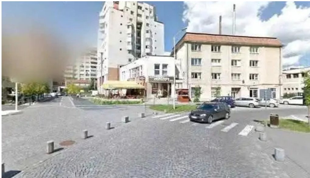
Casa de cultura a sindicatelor street view si 360deg