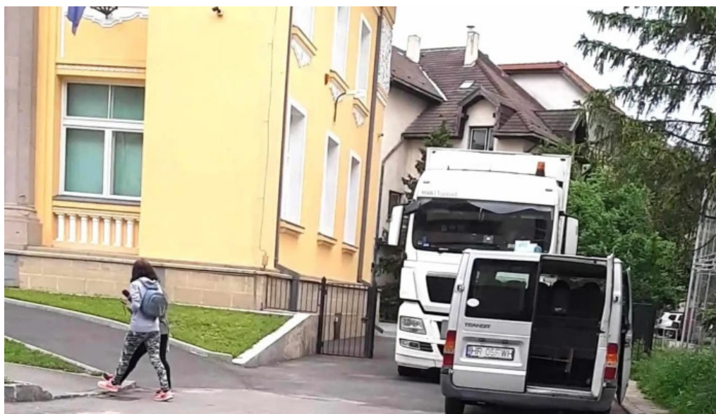
Casa de cultura a sindicatelor zon?