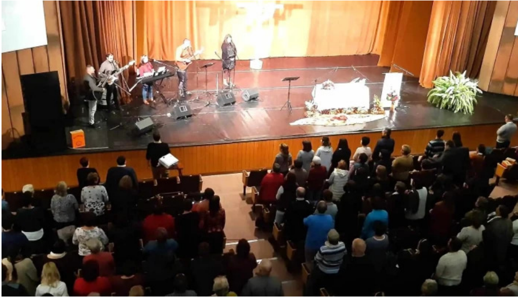
Casa de cultura a sindicatelor miercurea ciuc