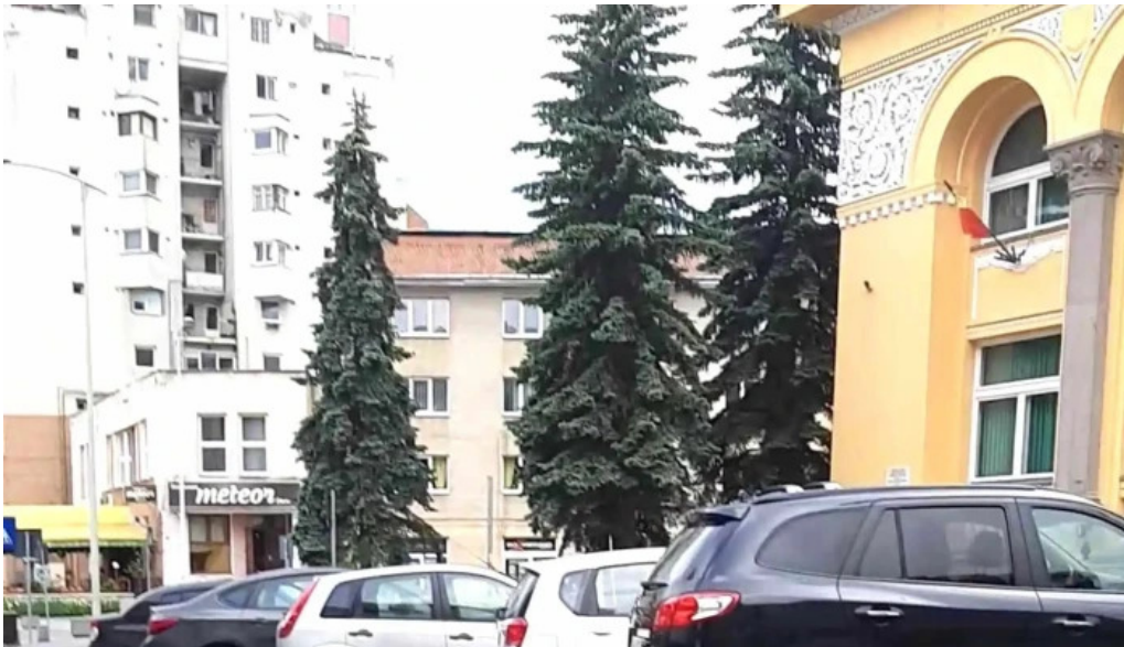
Casa de cultura a sindicatelor num?r