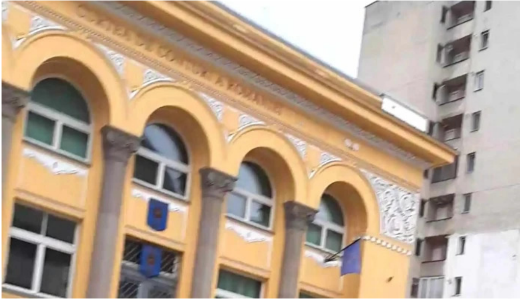
Casa de cultura a sindicatelor pre?uri