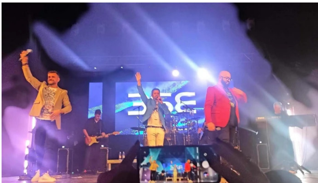
Casa de cultura a sindicatelor aproape de mine