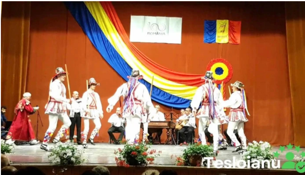
Casa de cultura a sindicatelor scena