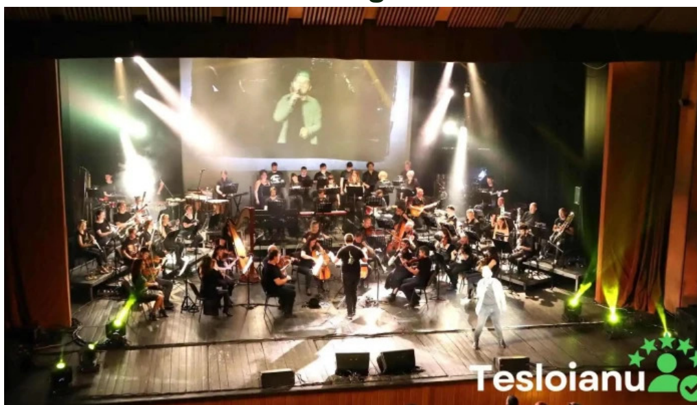
Casa de cultur? a sindicatelor miercurea ciuc