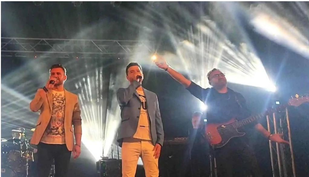
Casa de cultura a sindicatelor loca?ie