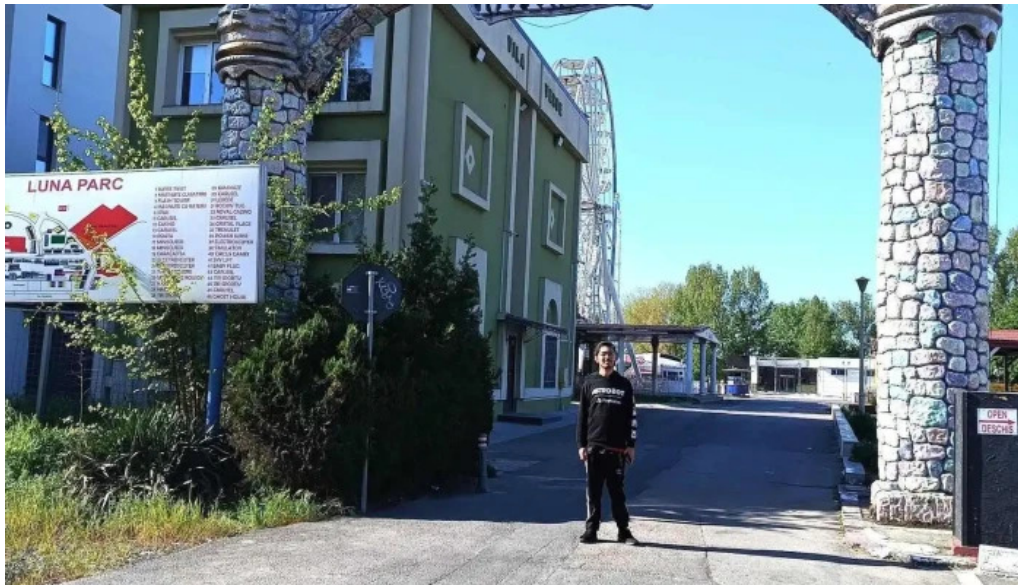
Sat vacanta mamaia cele mai recente