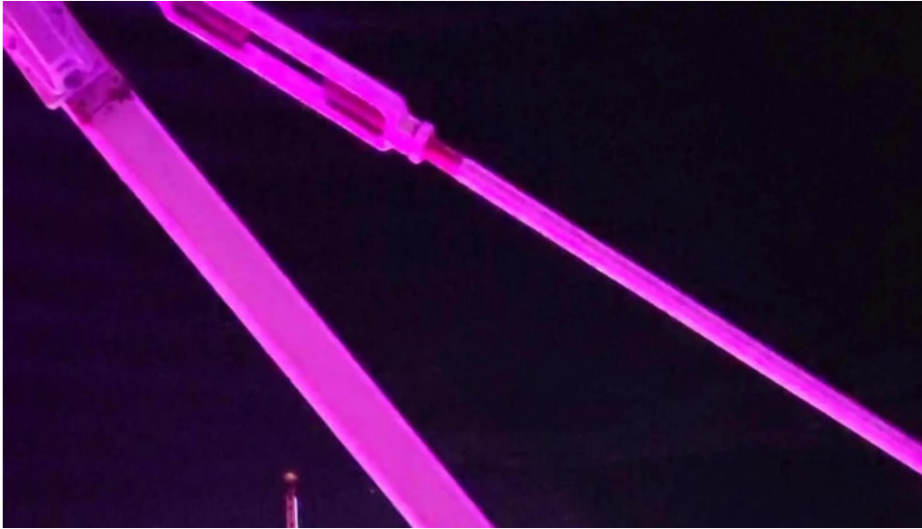
Sat vacanta mamaia deschis acum