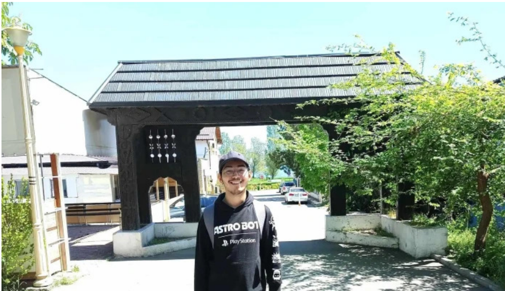
Sat vacanta mamaia constan?a