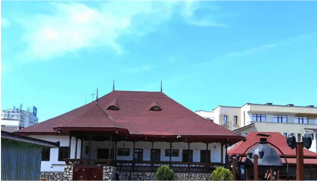
Sat vacanta mamaia videoclipuri