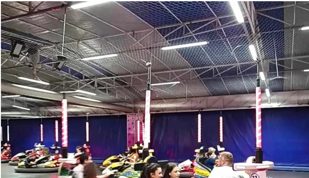
Sat vacanta mamaia telefon