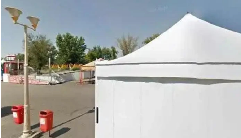
Sat vacanta mamaia street view si 360deg