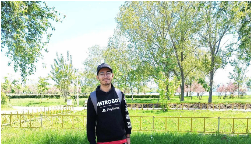
Sat vacanta mamaia pre?uri