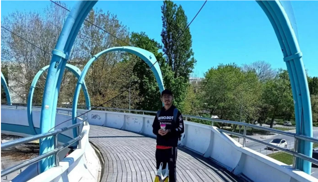
Sat vacanta mamaia num?r