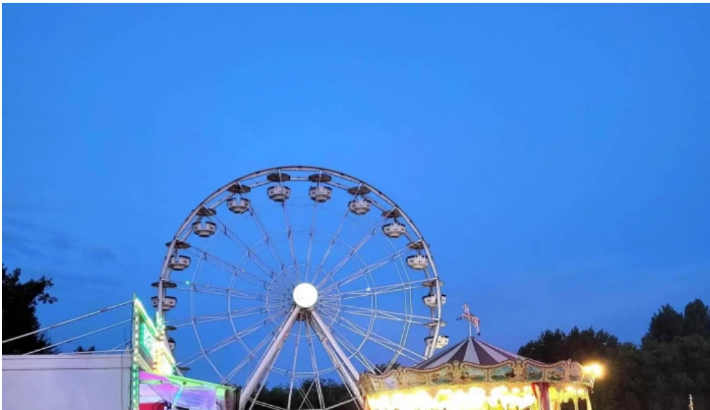
Sat vacanta mamaia scor