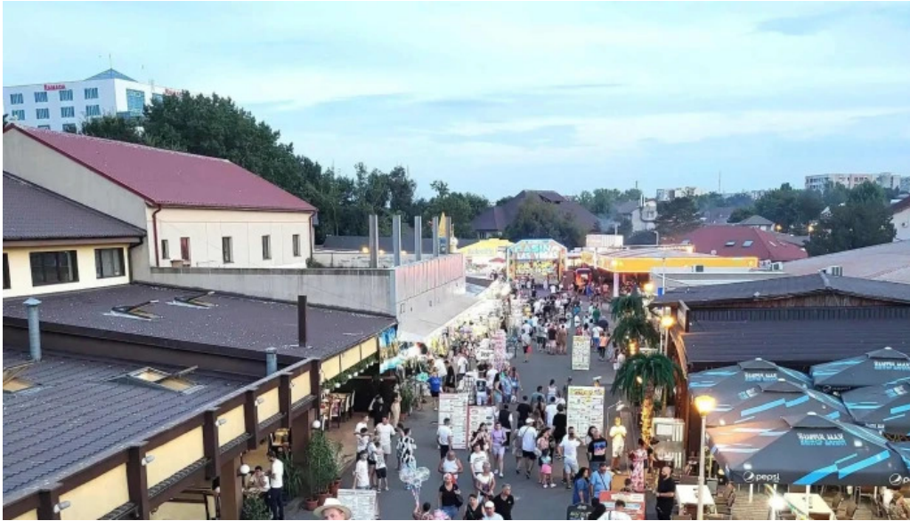
Sat vacanta mamaia promo?ie