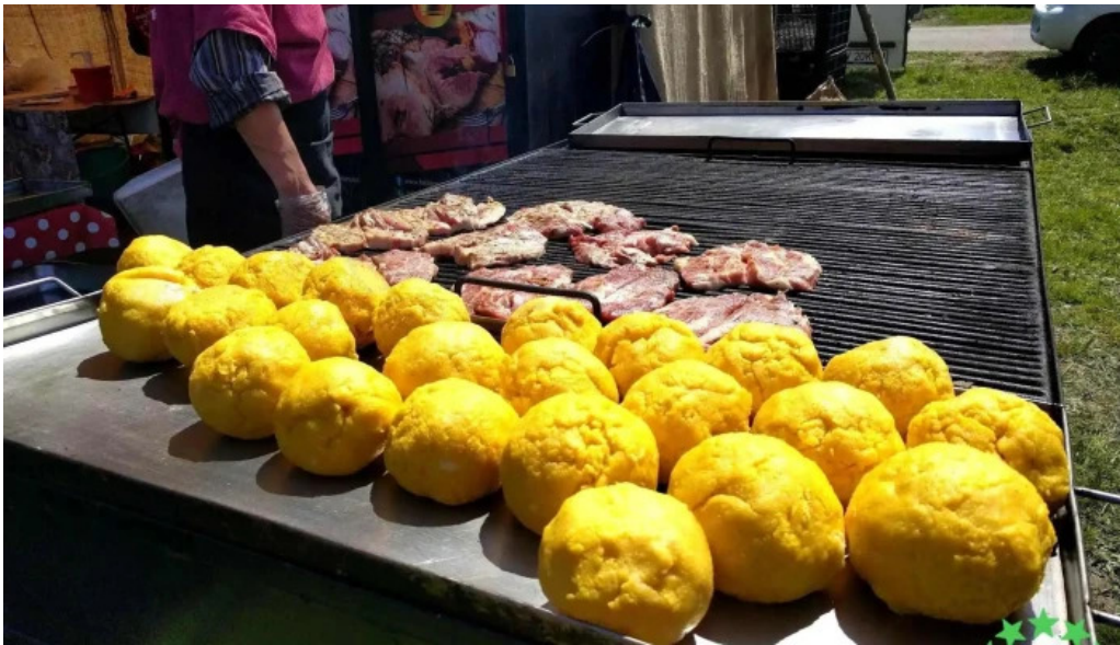
Bod sat mancaruribauturi