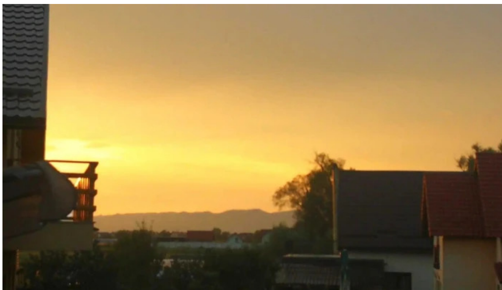
Bod sat bod