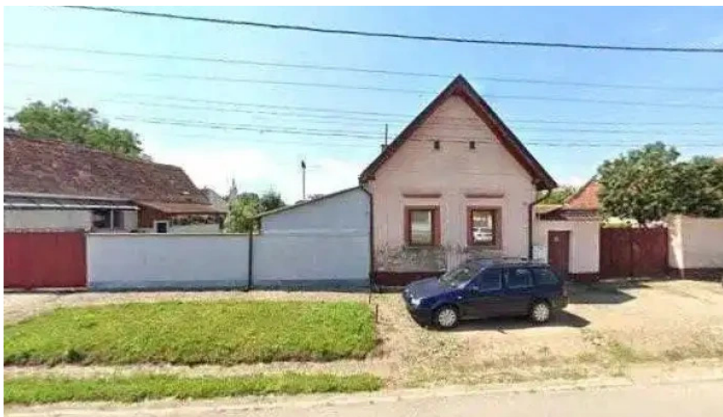
Bod sat street view si 360deg