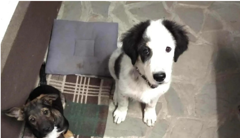
Bod sat promo?ie