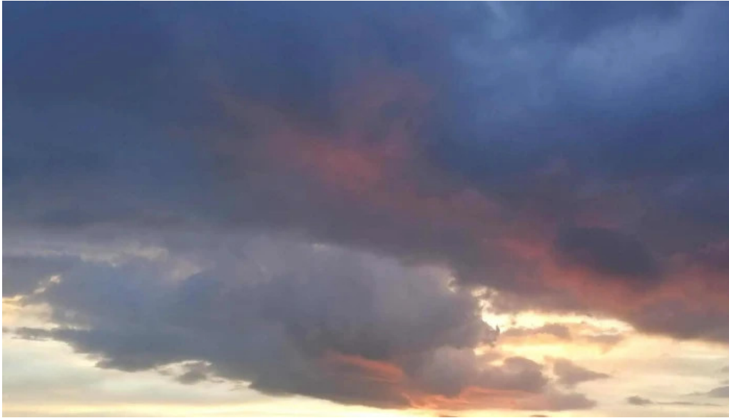
Bod sat pre?uri