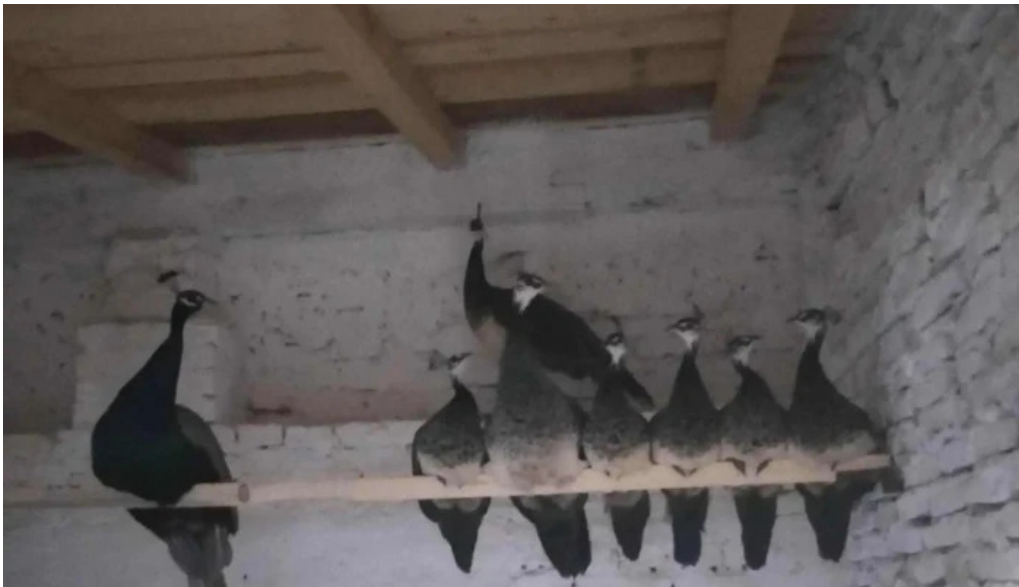
Bod sat recenzii