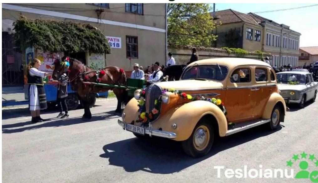
Bod sat videoclipuri