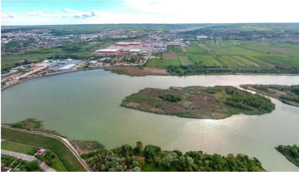
Barajul budeasa street view si 360deg