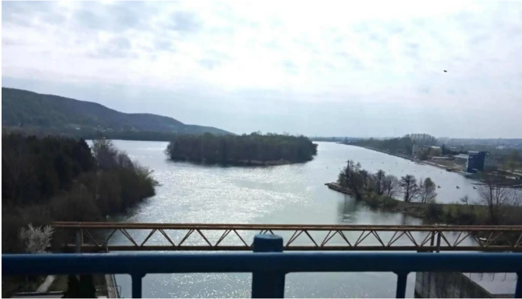
Barajul budeasa unde