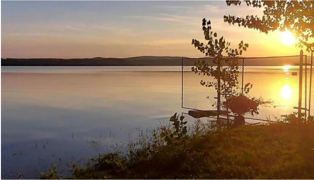
Barajul budeasa reduceri