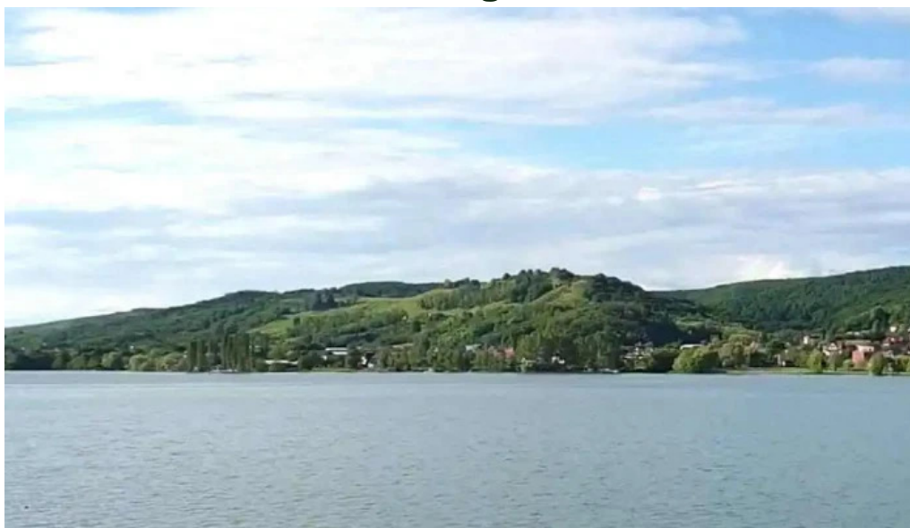
Barajul budeasa videoclipuri