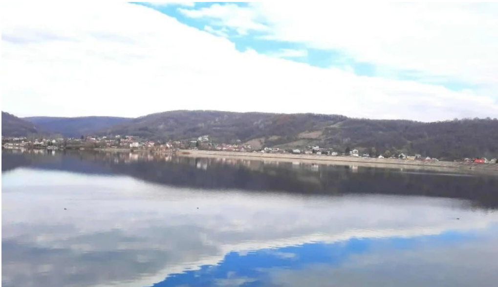
Barajul budeasa loca?ie