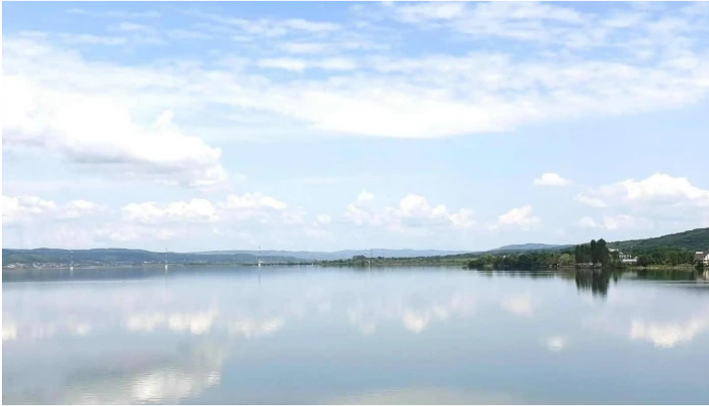
Barajul budeasa budeasa