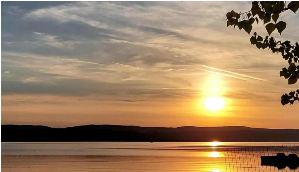
Barajul budeasa telefon