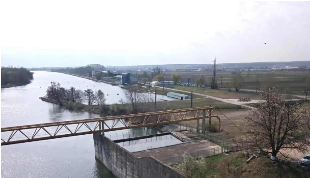
Barajul budeasa scor