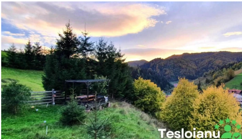
Casuta luanei num?r