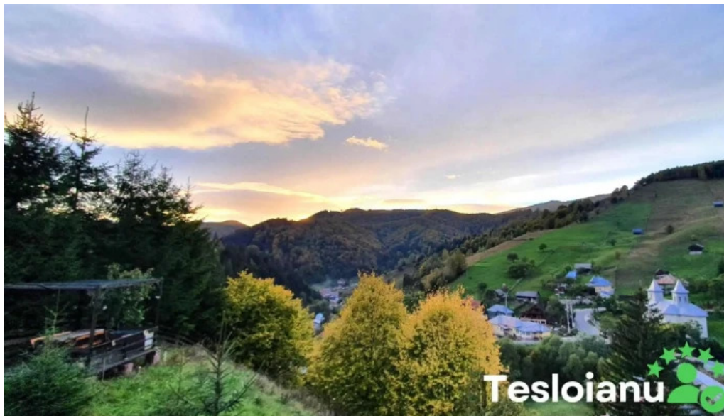
Casuta luanei de la vizitatori