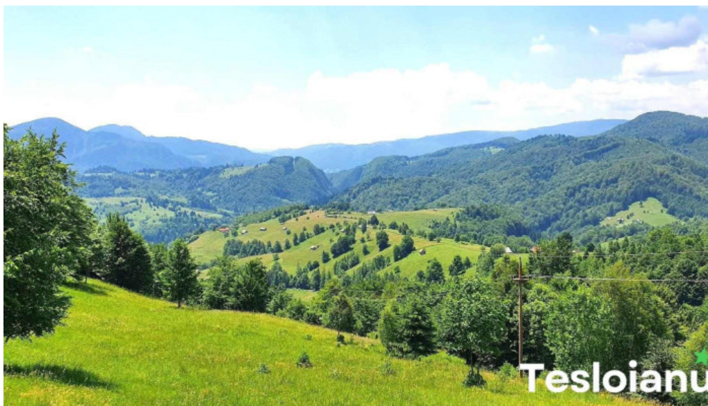
Casuta luanei de la proprietar