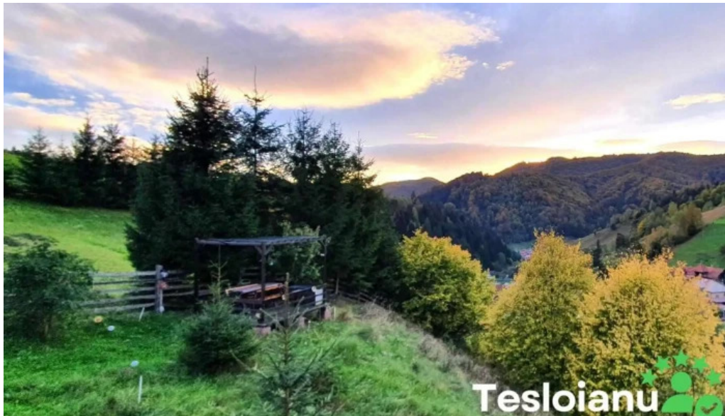
C?su?a luanei dambovicioara