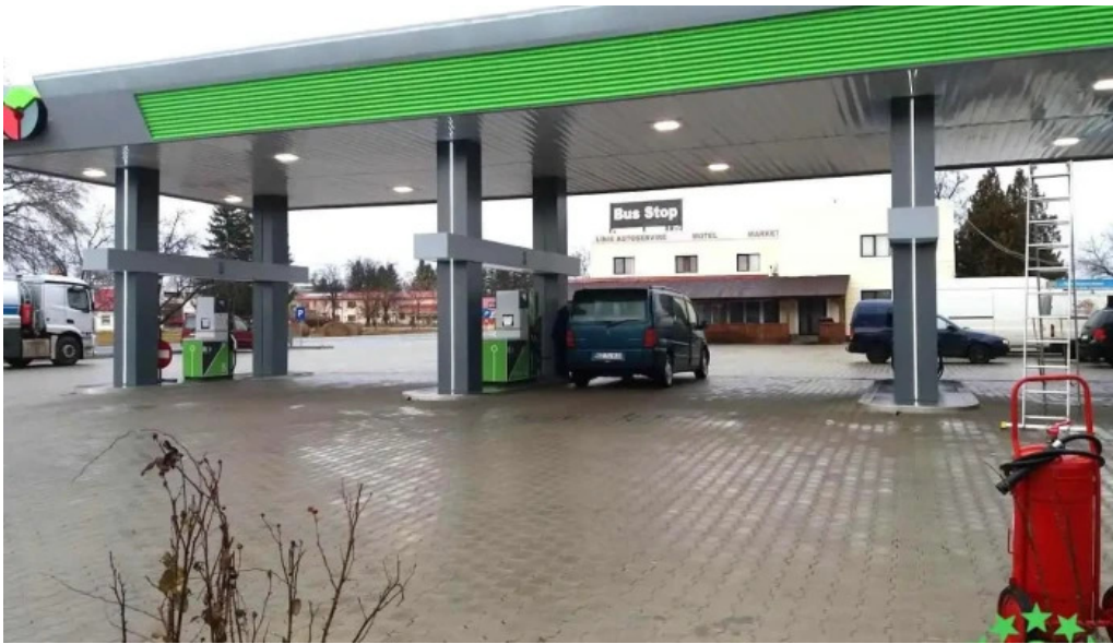
Ro buzau posta calnau po?ta caln?u