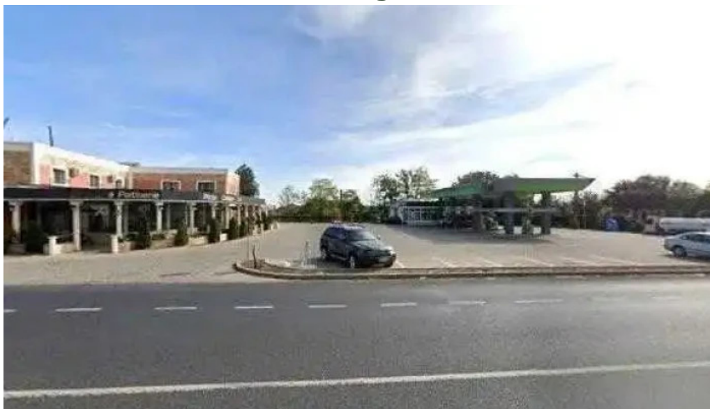
Ro buzau posta calnau street view si 360deg