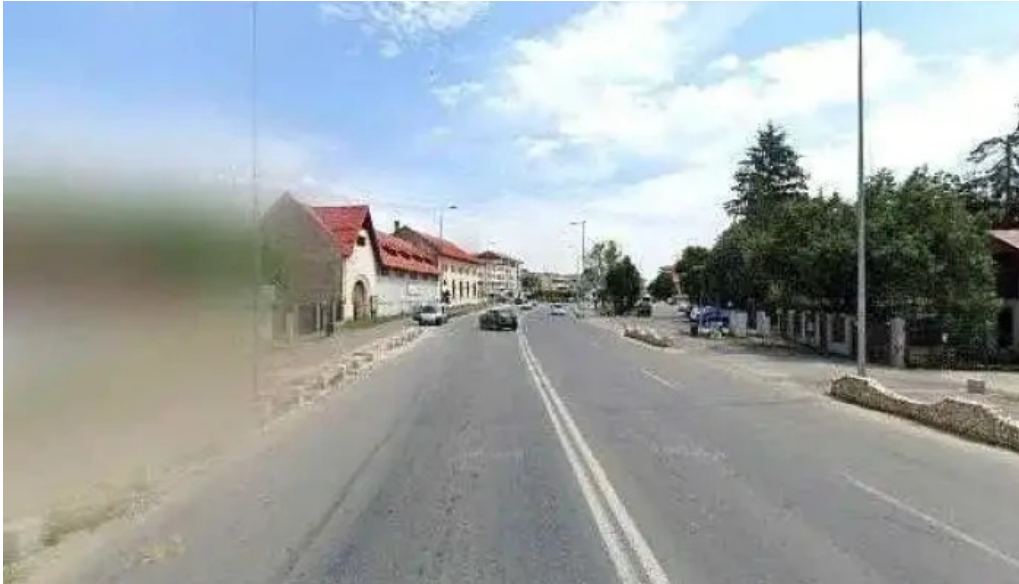
Ocpi bcpi topoloveni street view si 360deg