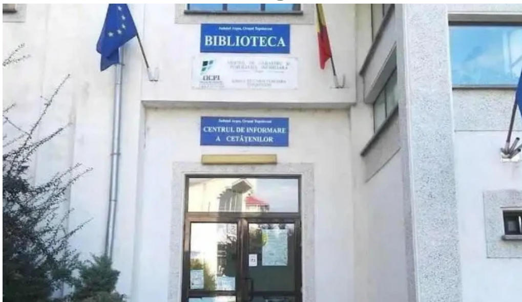
Ocpi bcpi topoloveni topoloveni