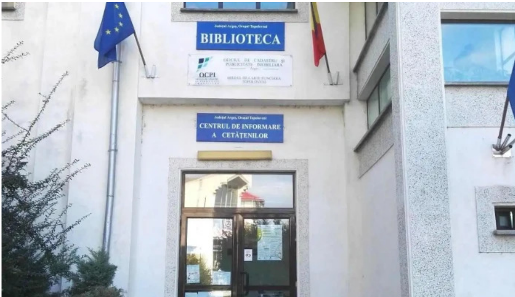
Ocpi bcpi topoloveni instagram