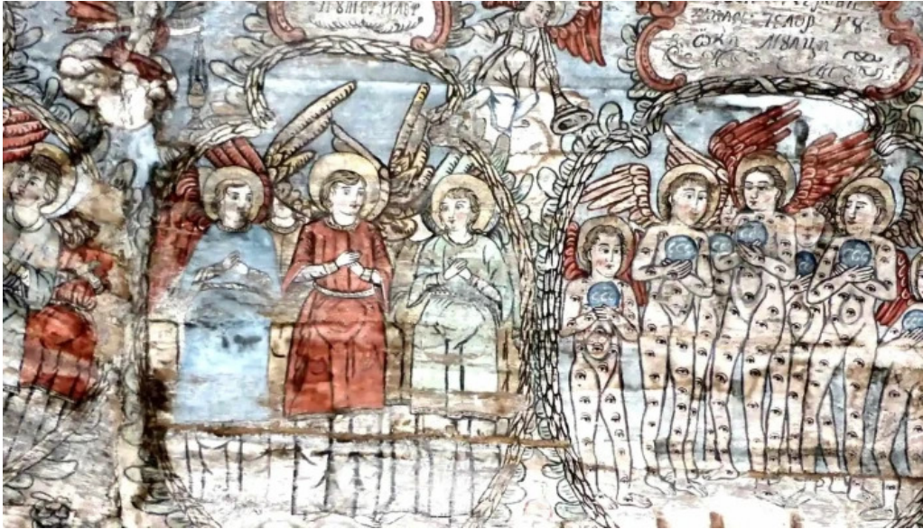
Biserica intrarea maicii domnului in biserica din barsana recenzii