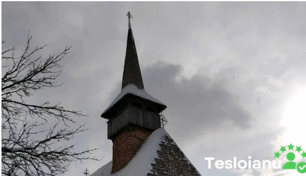
Biserica intrarea maicii domnului in biserica din barsana videoclipuri