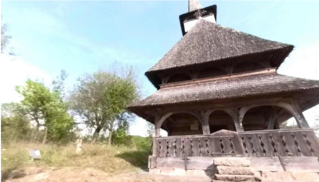
Biserica intrarea maicii domnului in biserica din barsana street view si 360deg