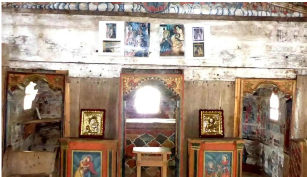
Biserica intrarea maicii domnului in biserica din barsana unde