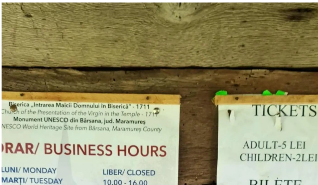
Biserica intrarea maicii domnului in biserica din barsana cum s? ajungi acolo