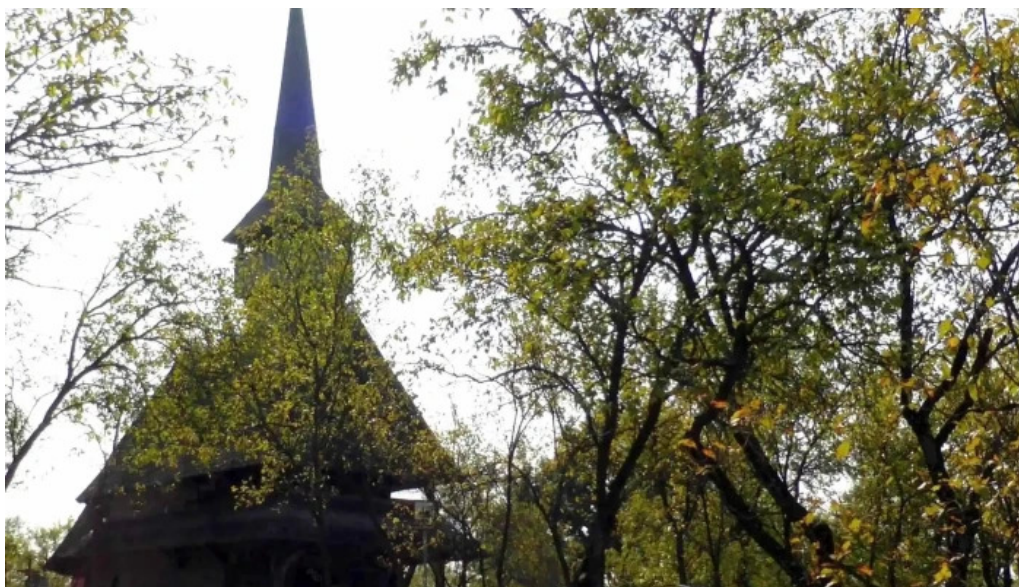
Biserica intrarea maicii domnului in biserica din barsana barsana