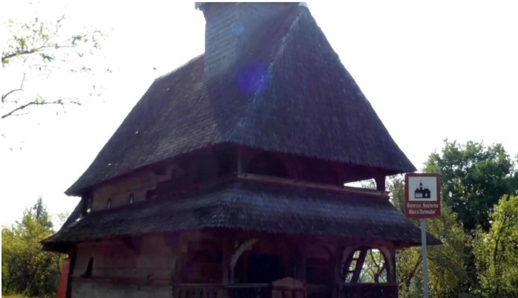
Biserica intrarea maicii domnului in biserica din barsana pre?uri