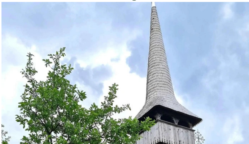
Biserica intrarea maicii domnului in biserica din barsana zon?