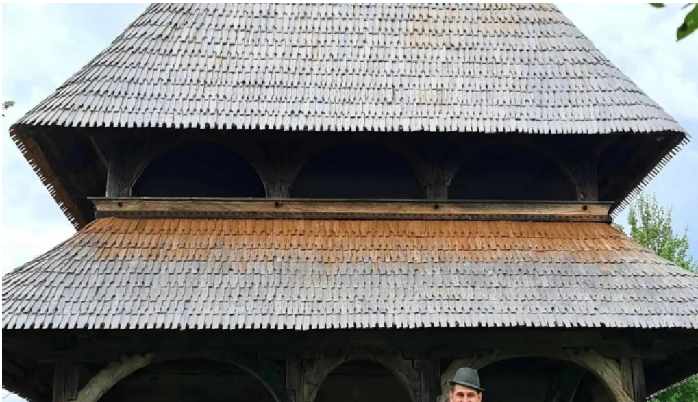
Biserica intrarea maicii domnului in biserica din barsana site web