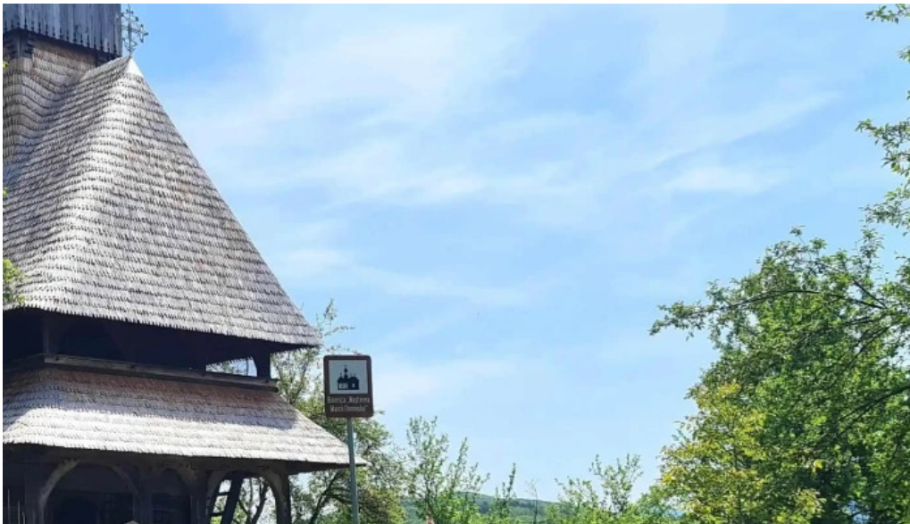
Biserica intrarea maicii domnului in biserica din barsana localitate