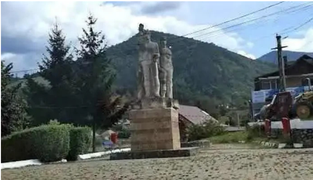
Baia de arie? sart??