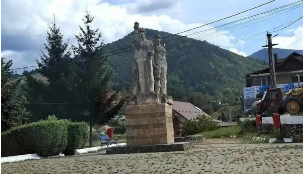
Baia de aries adres?