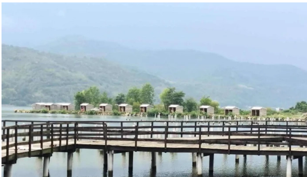
Complex egreta aproape de mine