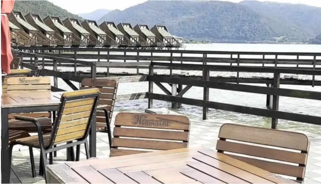
Complex egreta de la vizitatori