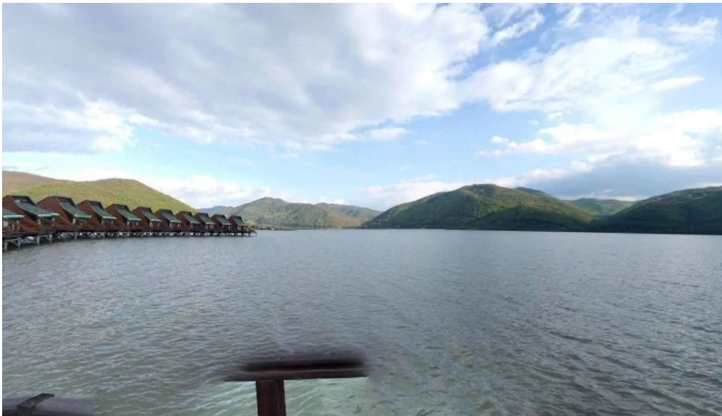
Complex egreta street view si 360