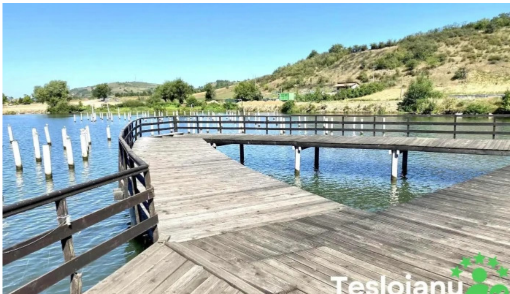
Complex egreta dotari