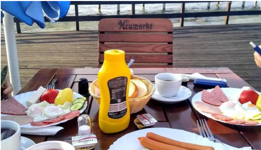
Complex egreta mancaruribauturi