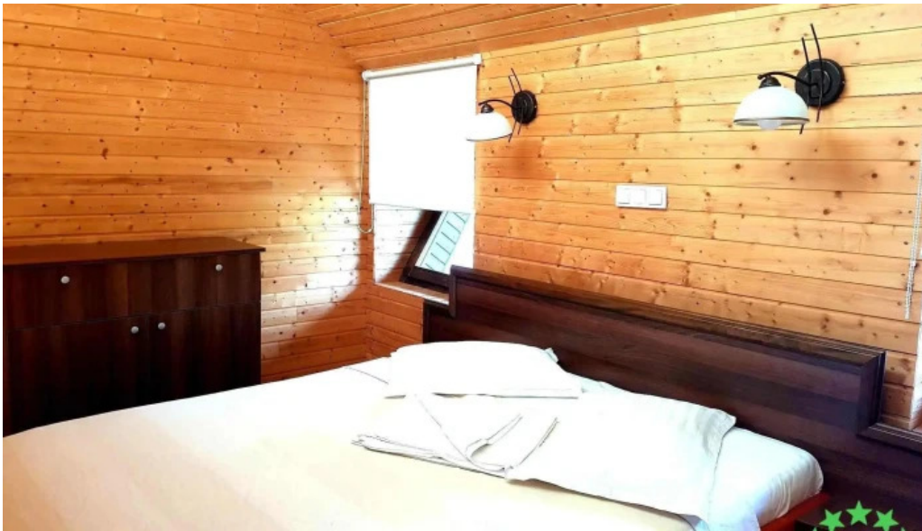
Complex egreta camere