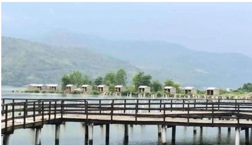
Complex egreta berzasca