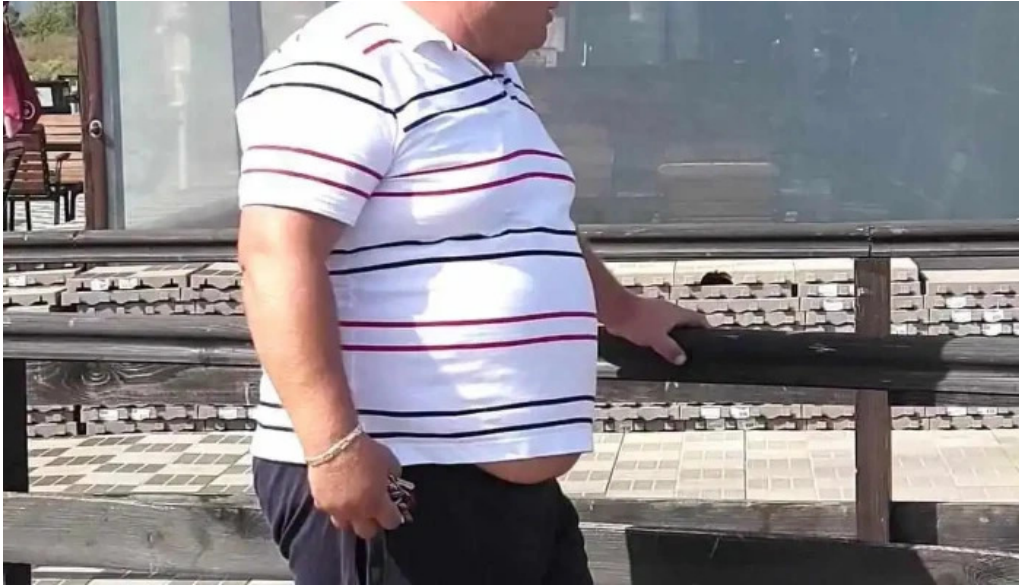
Complex egreta videoclipuri