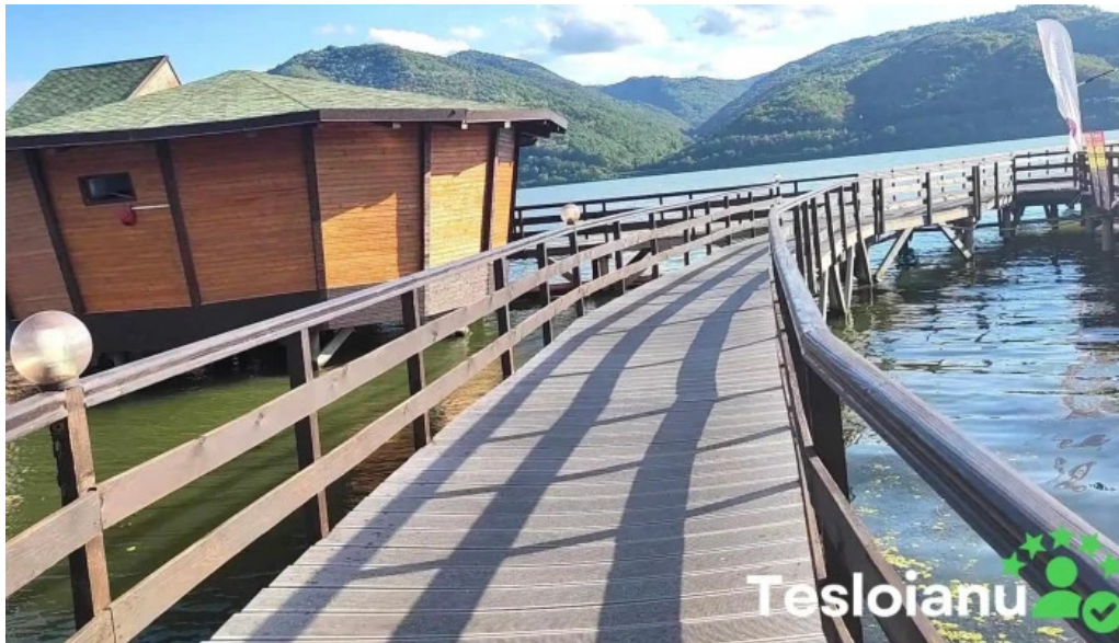
Complex egreta exterior