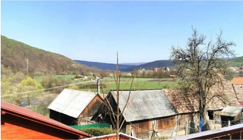
Laleaua casa la cheie praid exterior