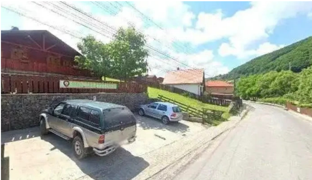
Laleaua casa la cheie praid street view si 360deg