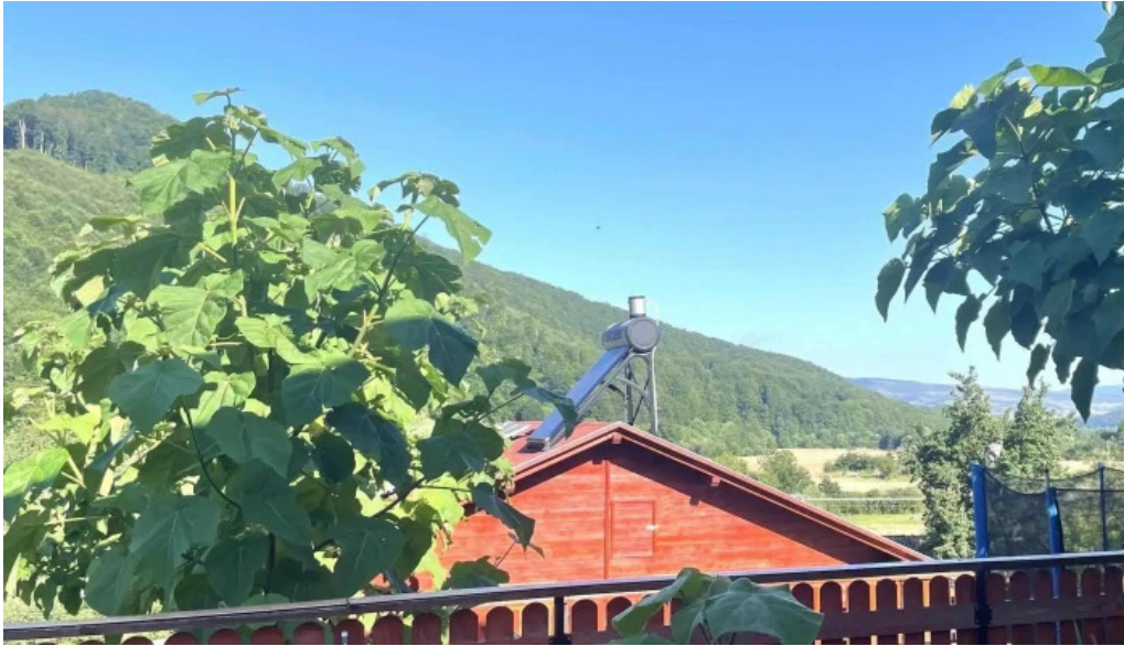
Laleaua casa la cheie praid praid