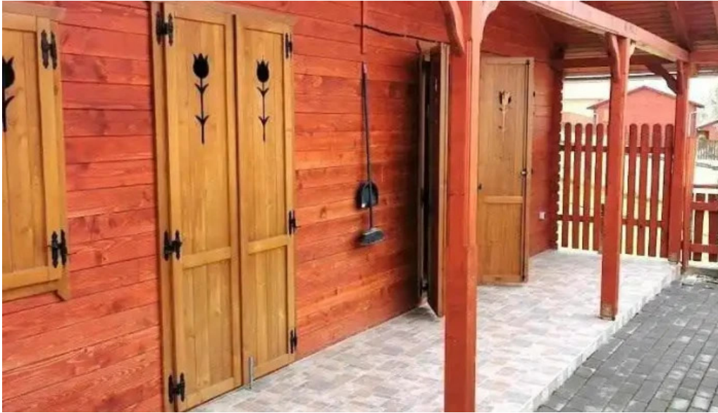
Laleaua cas? la cheie praid praid