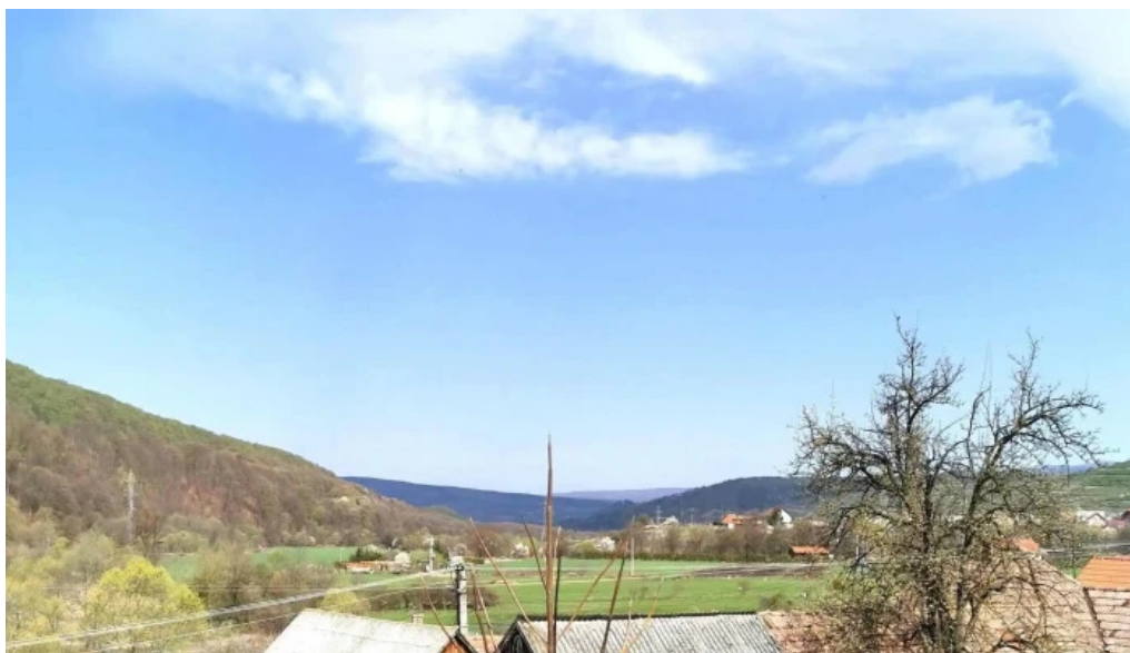
Laleaua casa la cheie praid aproape de mine