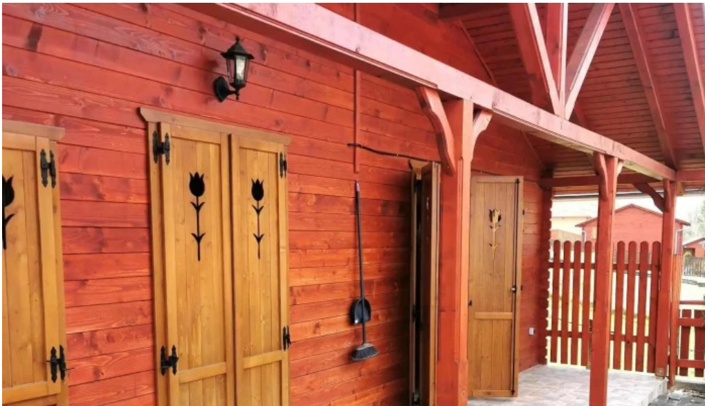
Laleaua casa la cheie praid reduceri