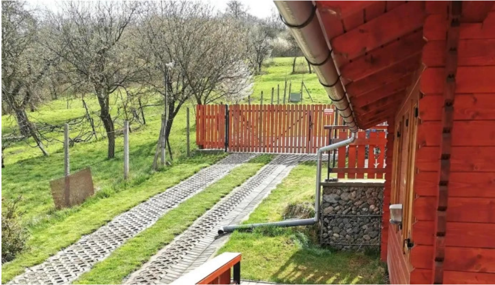
Laleaua casa la cheie praid scor