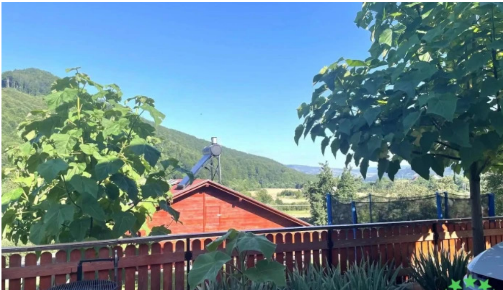
Laleaua casa la cheie praid de la vizitatori