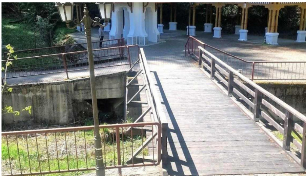
Baile govora sa cele mai recente