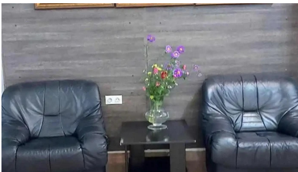
Baile govora sa camere