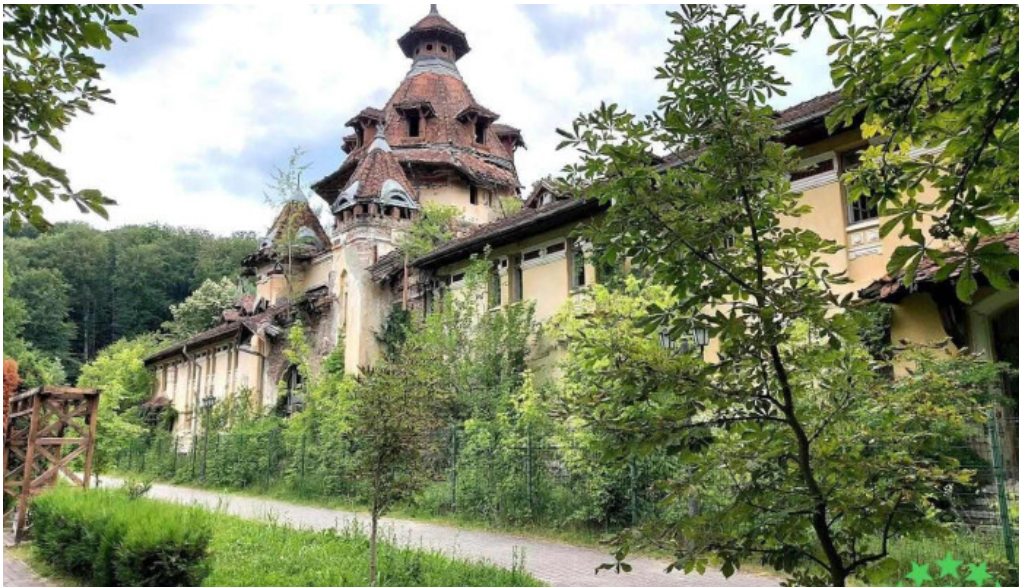
B?ile govora s a prajila