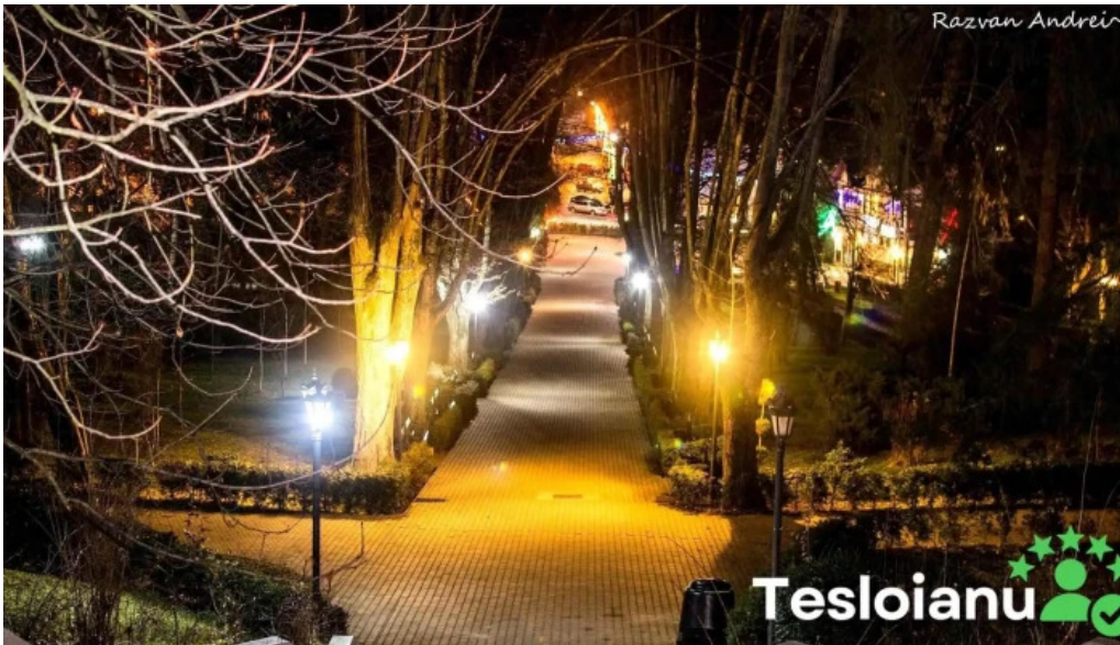
Baile govora sa de la vizitatori