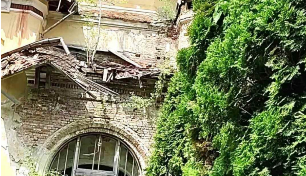
Baile govora sa exterior