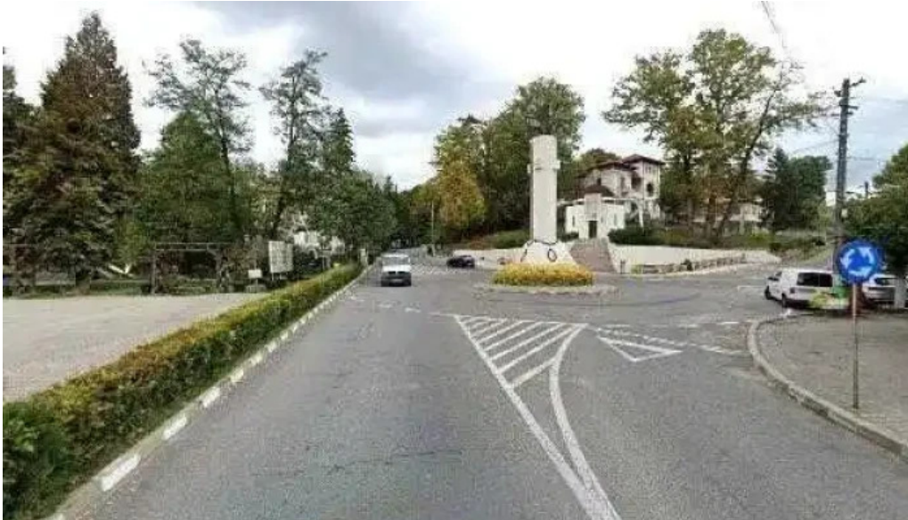
Baile govora sa street view si 360deg