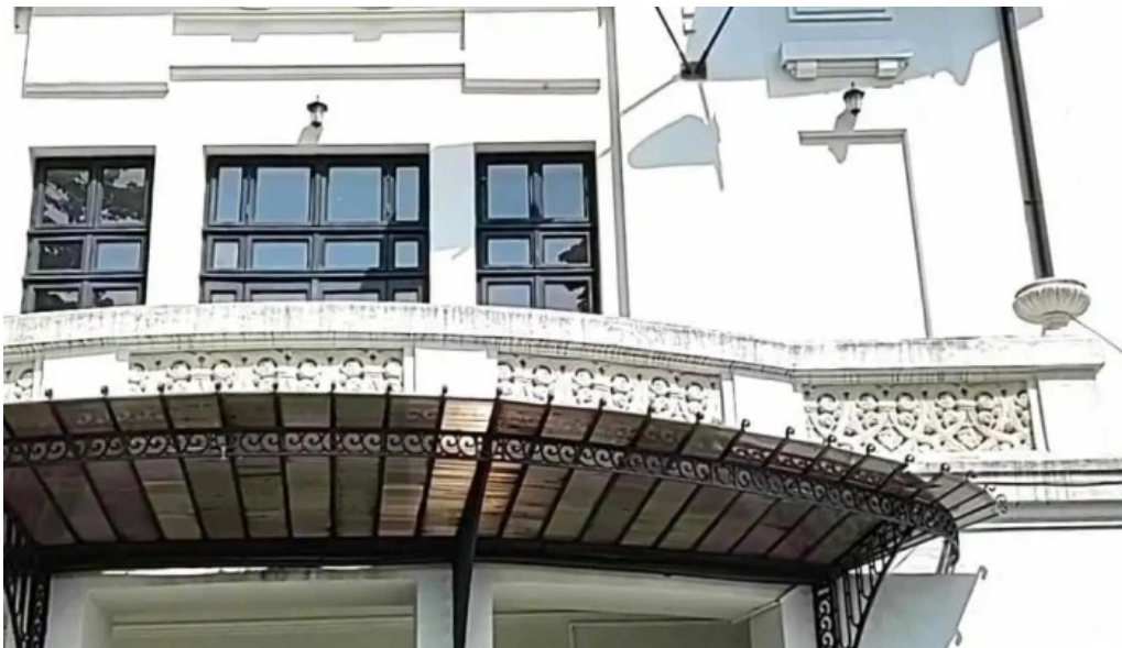
Baile govora sa videoclipuri