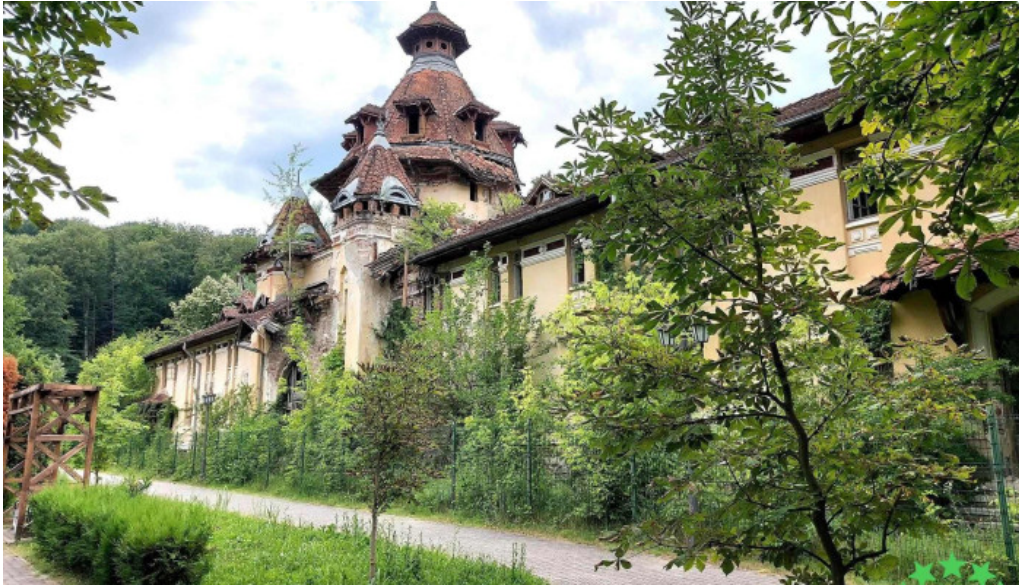
Baile govora sa deschis acum