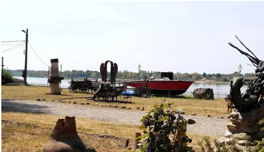
Portul cultural al com cetate unde