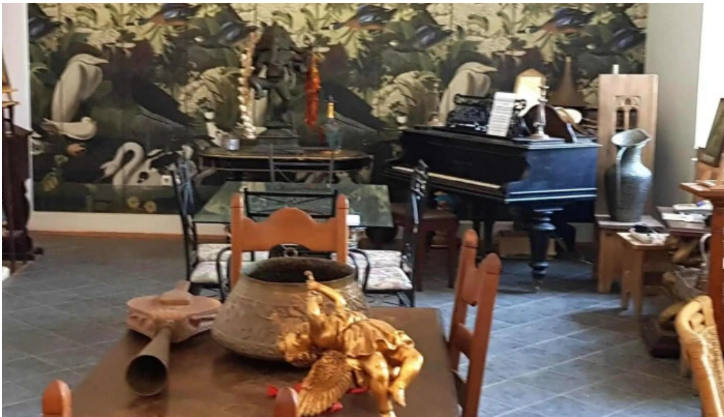
Portul cultural al com cetate scor