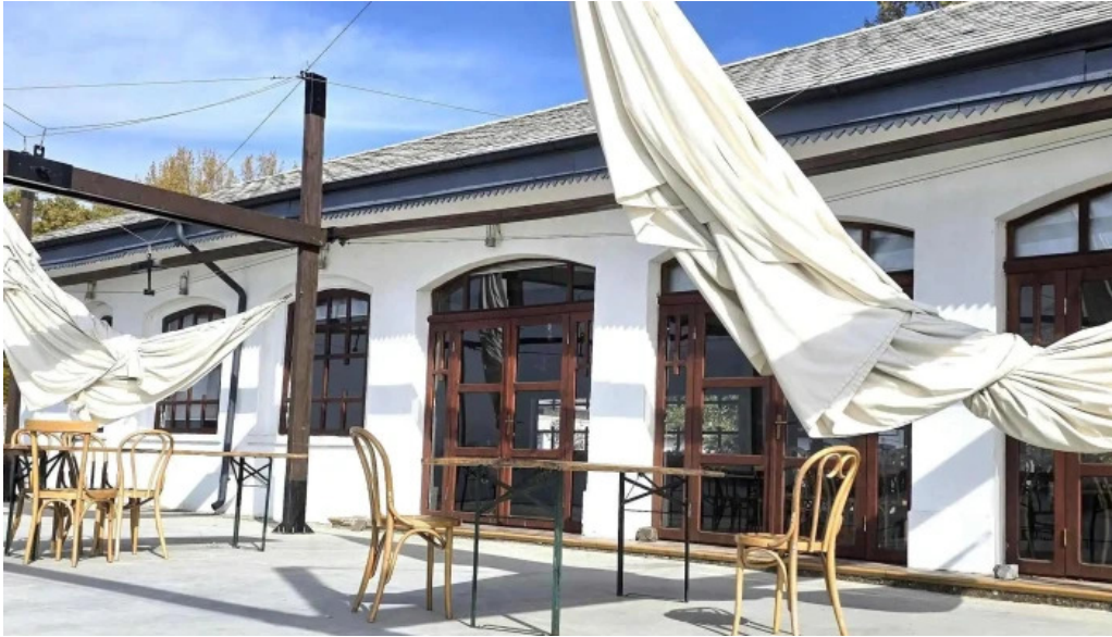
Portul cultural al com cetate cum s? ajungi acolo