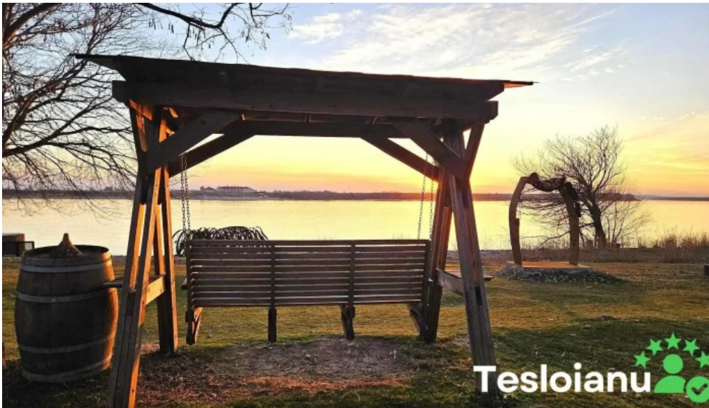
Portul cultural al com cetate cele mai recente