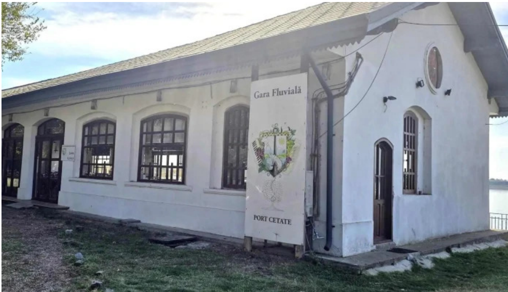
Portul cultural al com cetate cetate