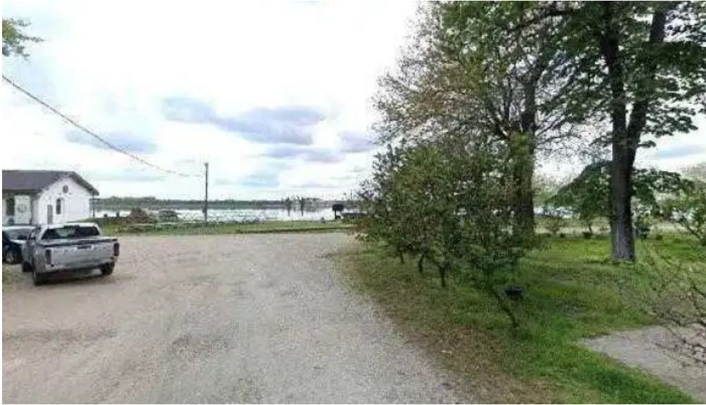
Portul cultural al com cetate street view si 360deg