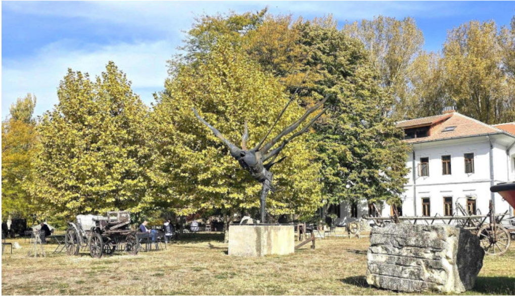
Portul cultural al com cetate promo?ie