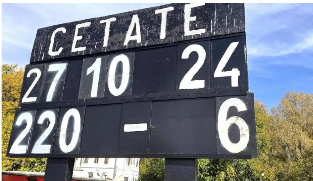
Portul cultural al com cetate catalog