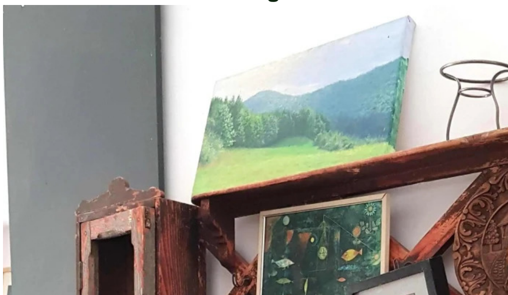
Portul cultural al com cetate zon?