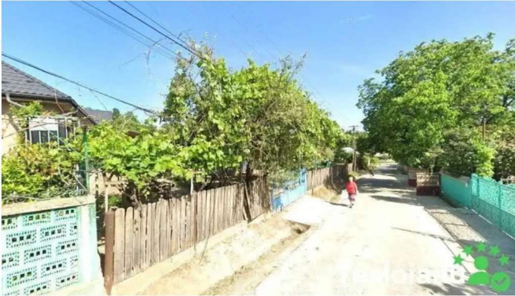
Locuin?a cunoscut? r?duc?neni