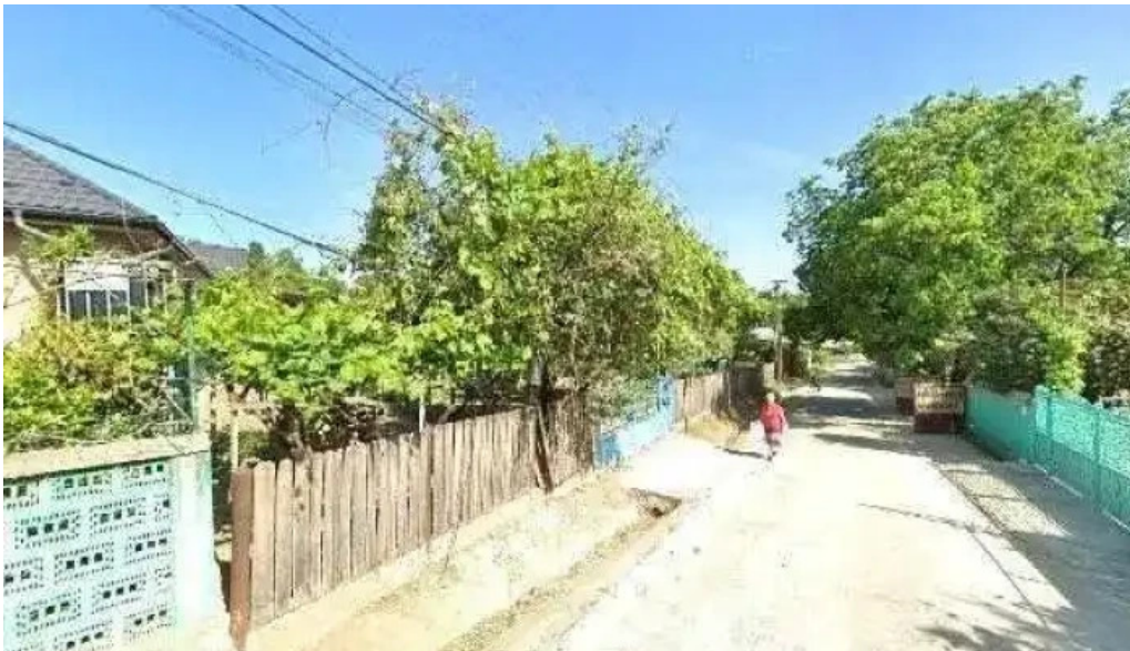
Locuinta cunoscuta videoclipuri