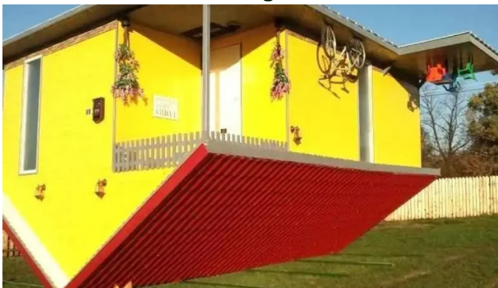
Casa răsturnată bumbăci pic