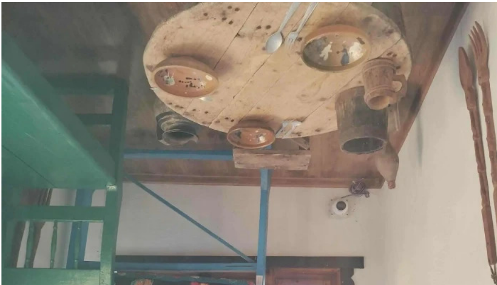
Casa rasturnata recenzii