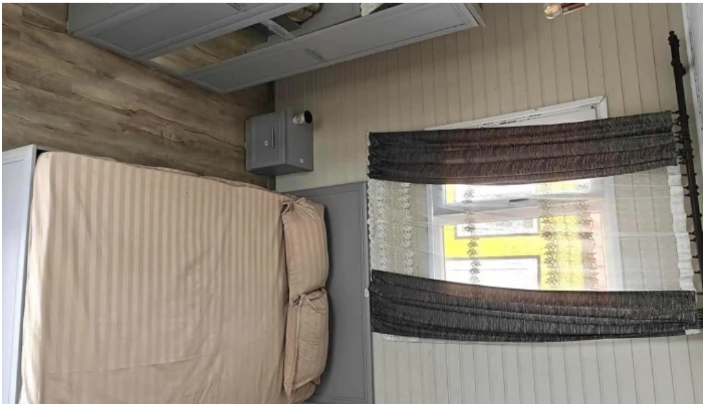
Casa rasturnata instagram