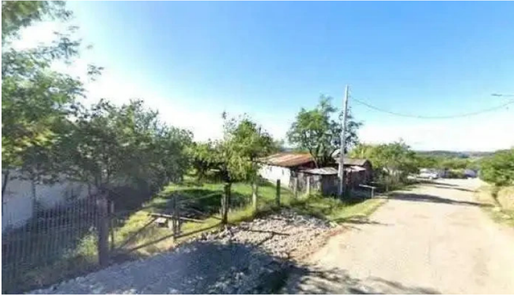
Casa rasturnata street view si 360deg