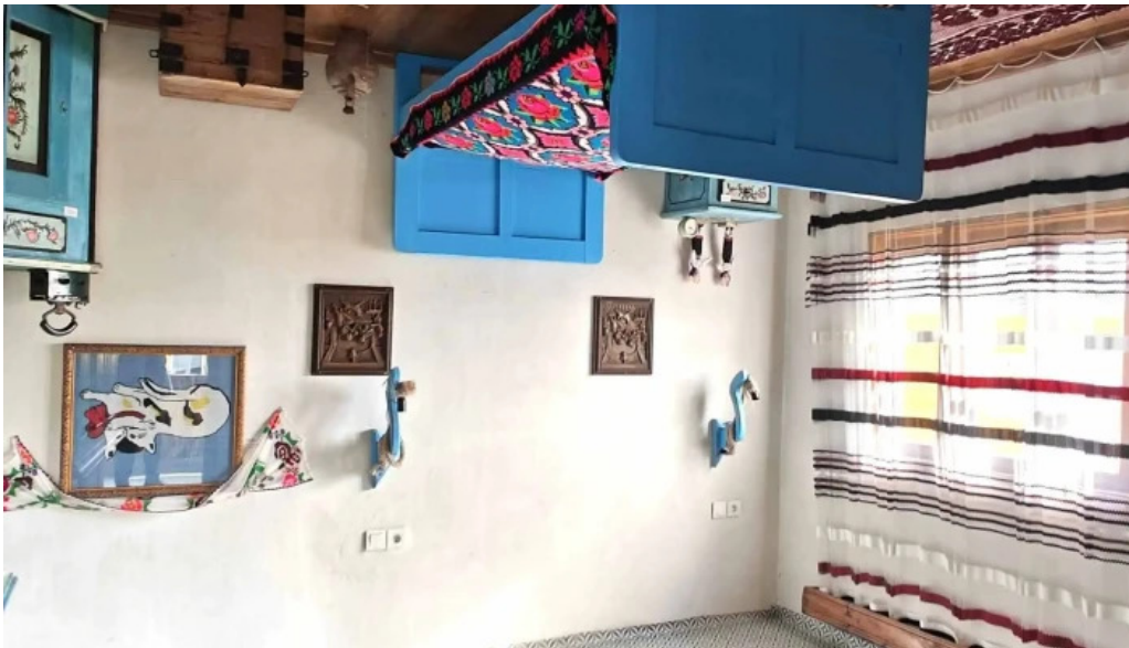
Casa rasturnata telefon