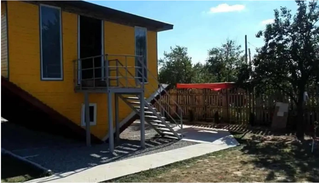
Casa rasturnata videoclipuri