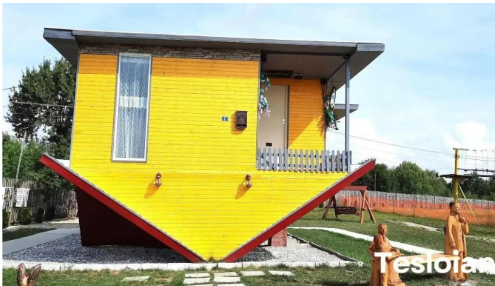
Casa rasturnata exterior