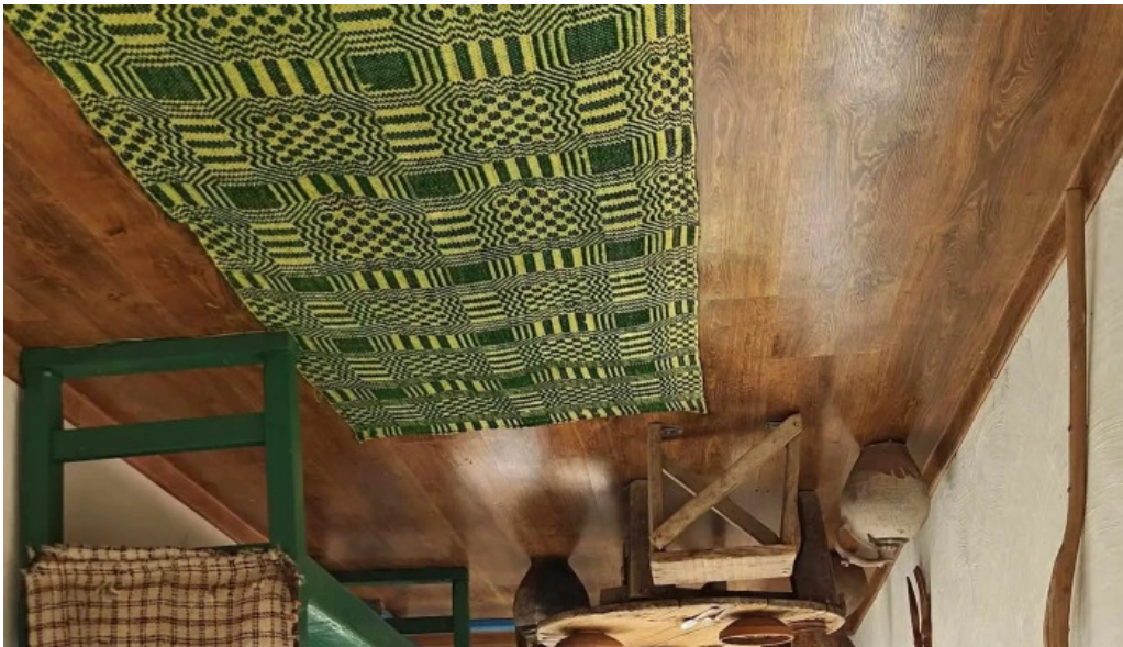
Casa rasturnata num?r