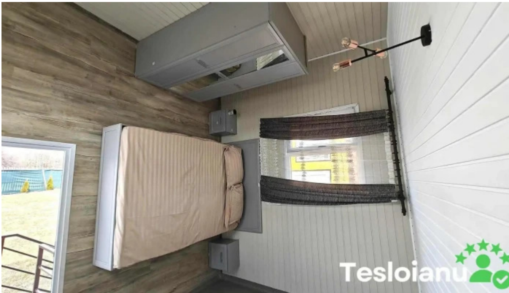
Casa rasturnata cele mai recente