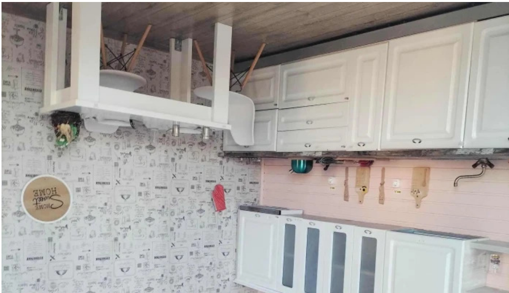
Casa rasturnata cum s? ajungi acolo