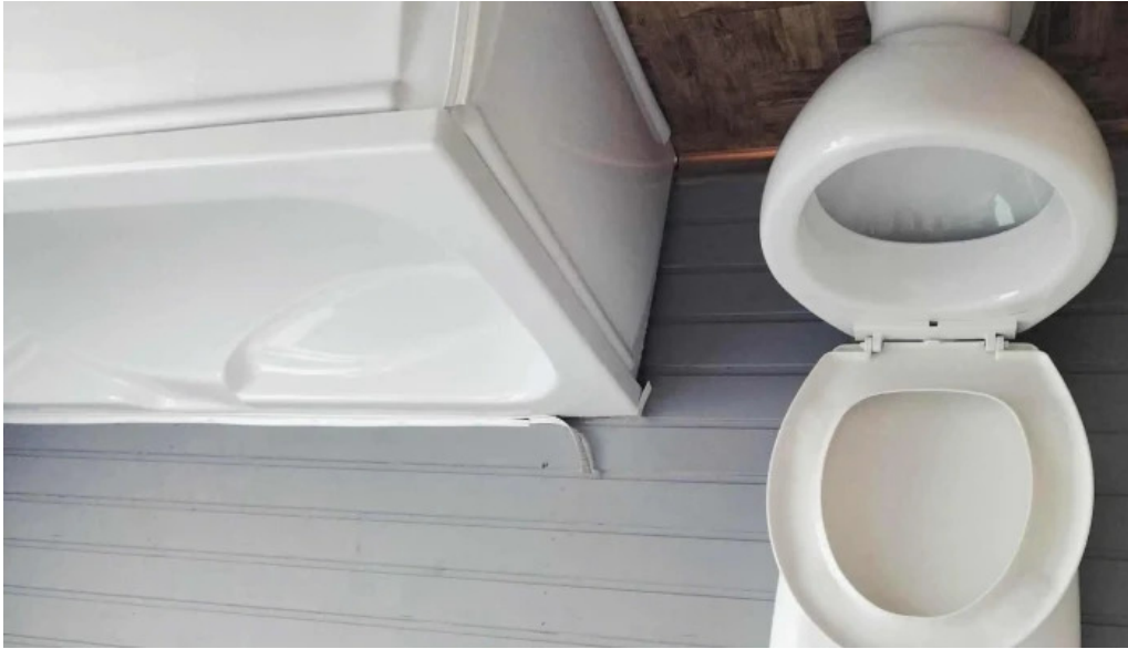
Casa rasturnata comentarii