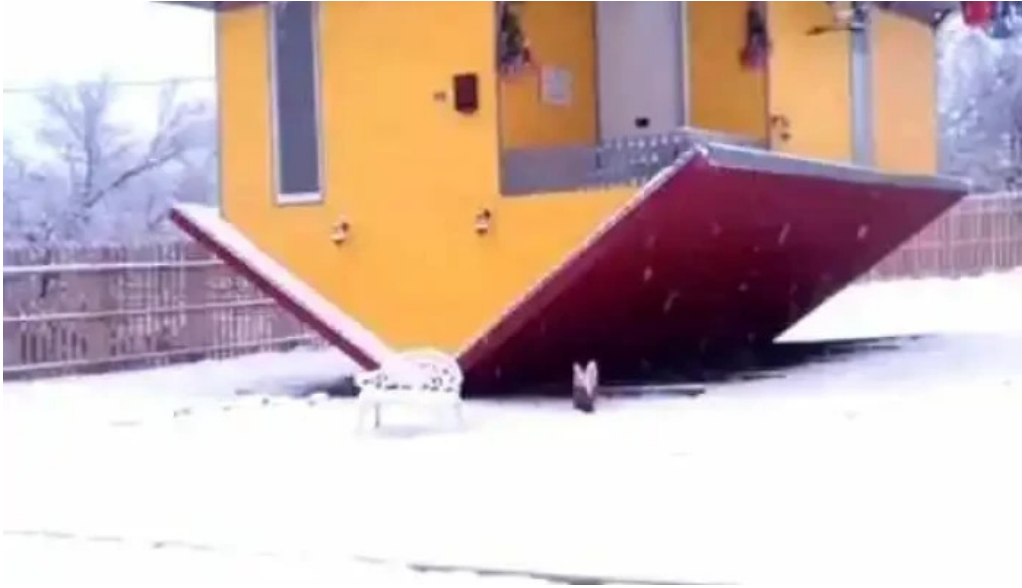
Casa rasturnata de la proprietar