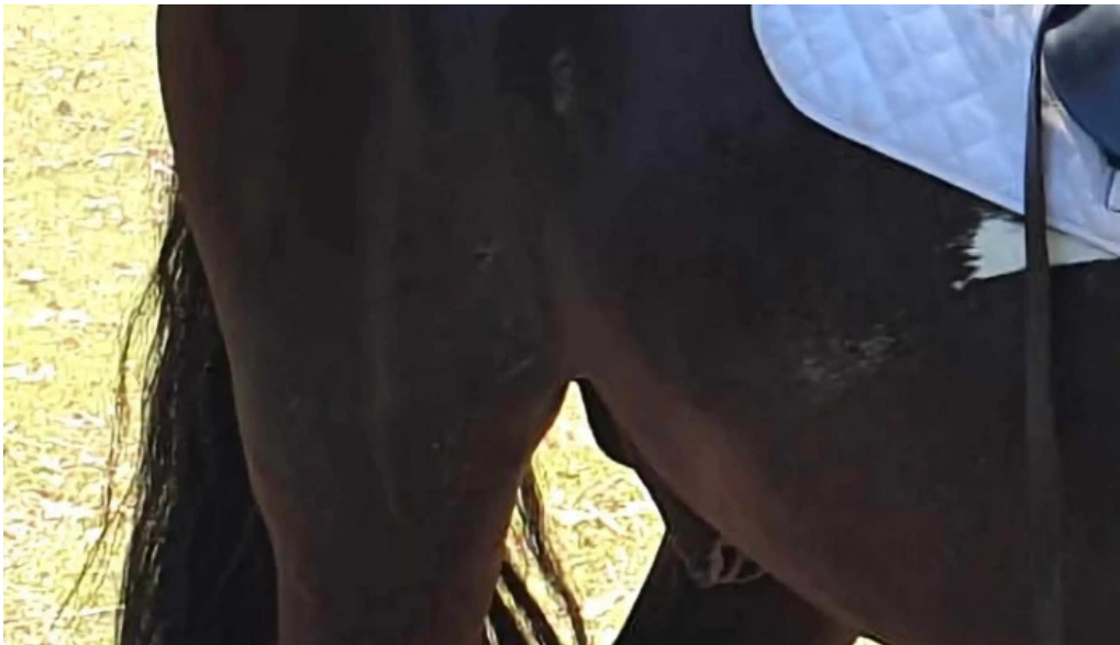
Basme cu cai fotografii