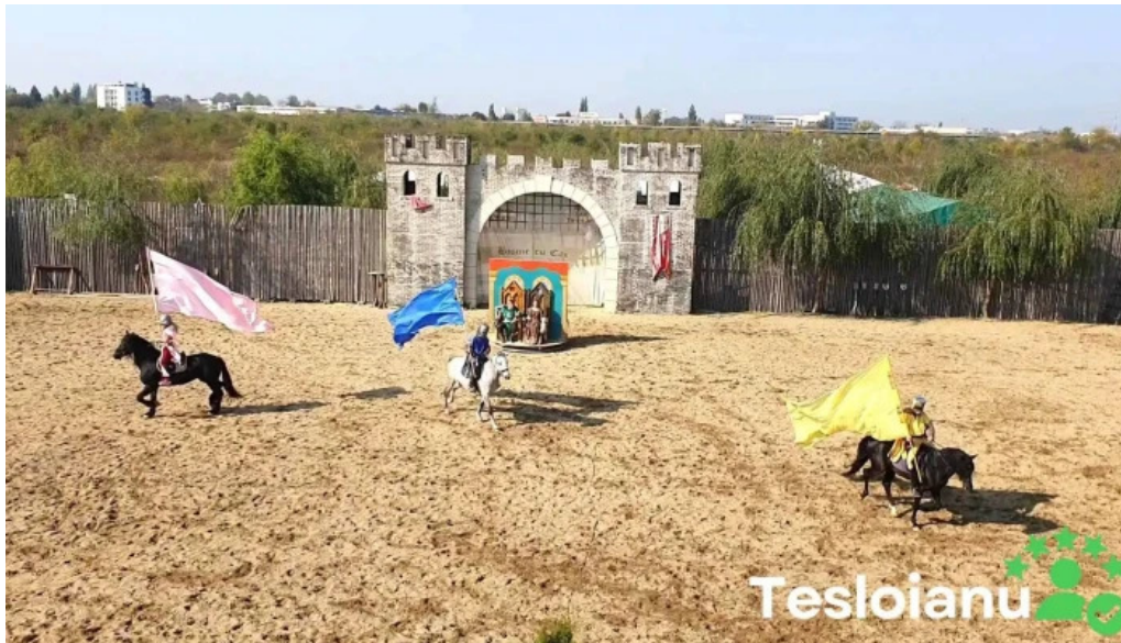
Basme cu cai videoclipuri