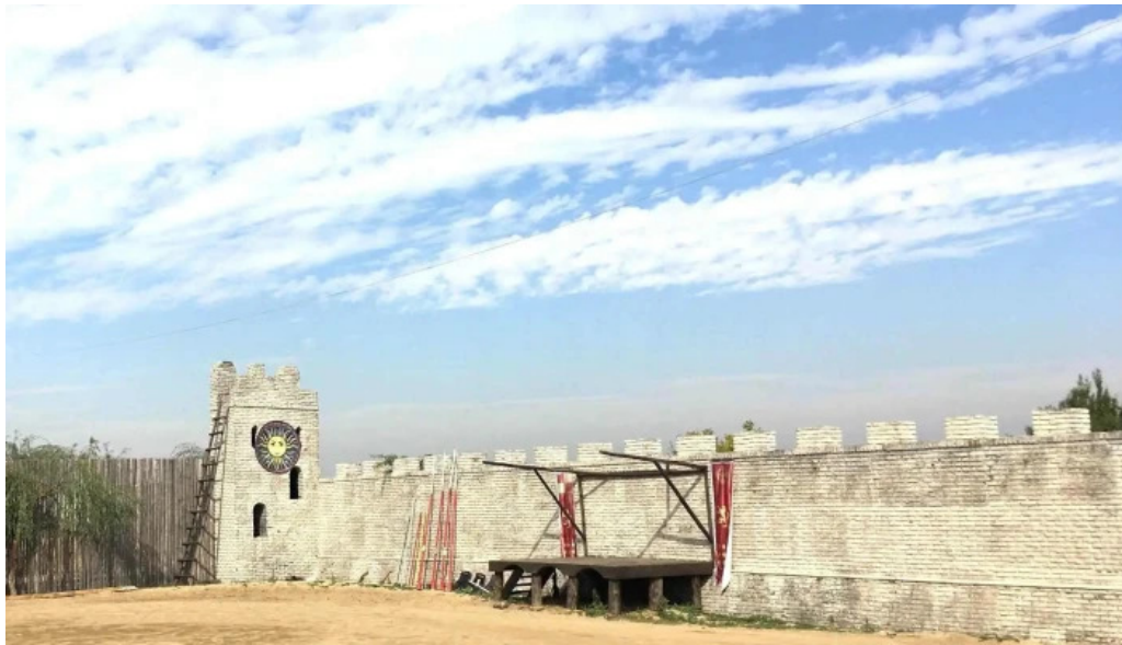
Basme cu cai num?r