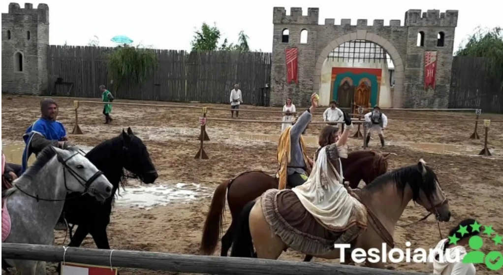
Basme cu cai cal