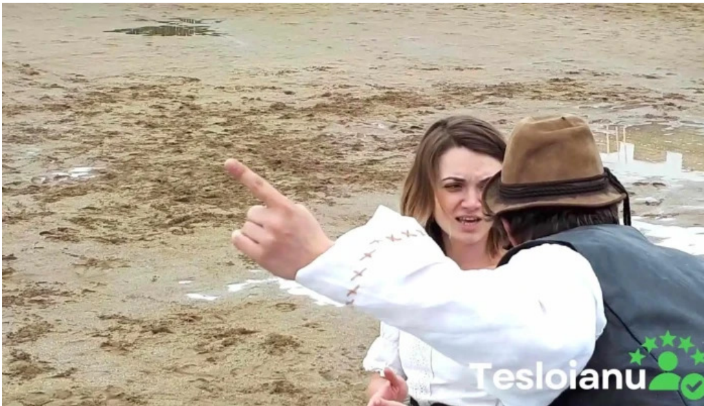
Basme cu cai sa