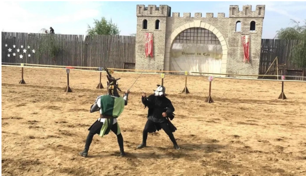
Basme cu cai scor