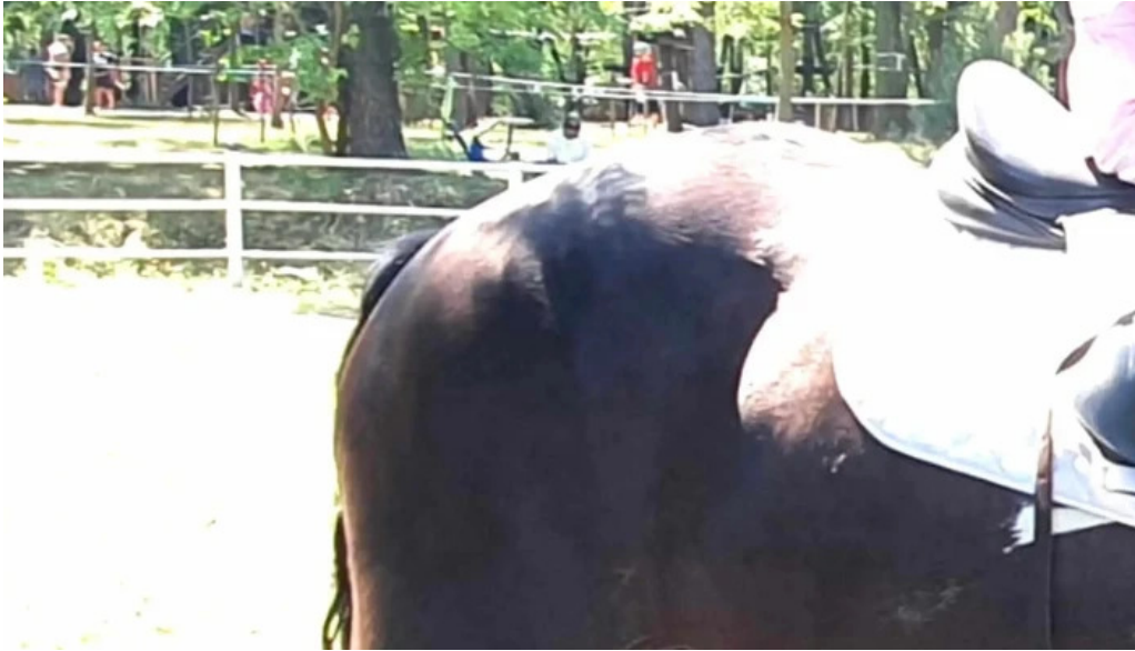
Basme cu cai comana