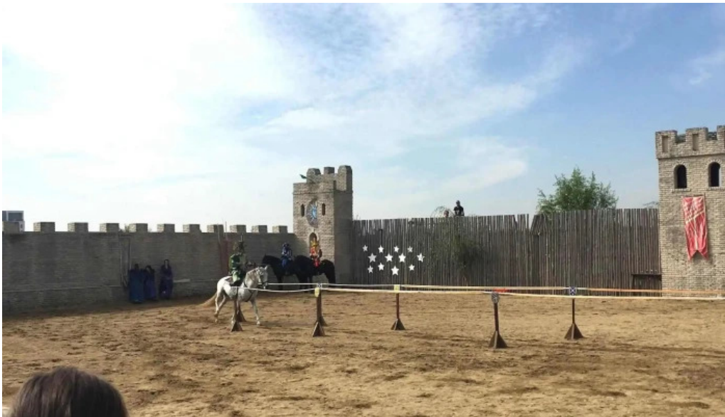
Basme cu cai recenzii