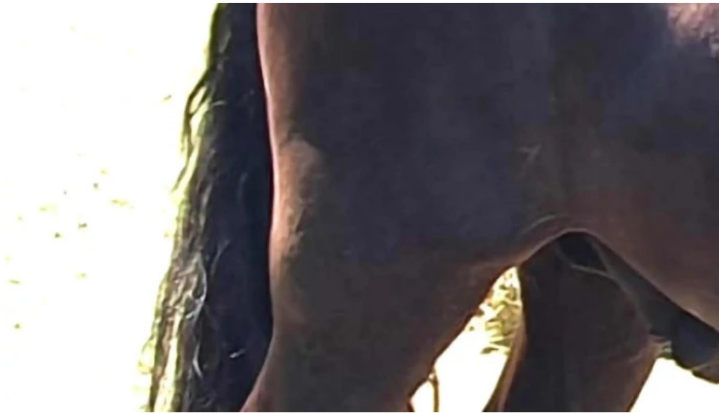
Basme cu cai pre?uri