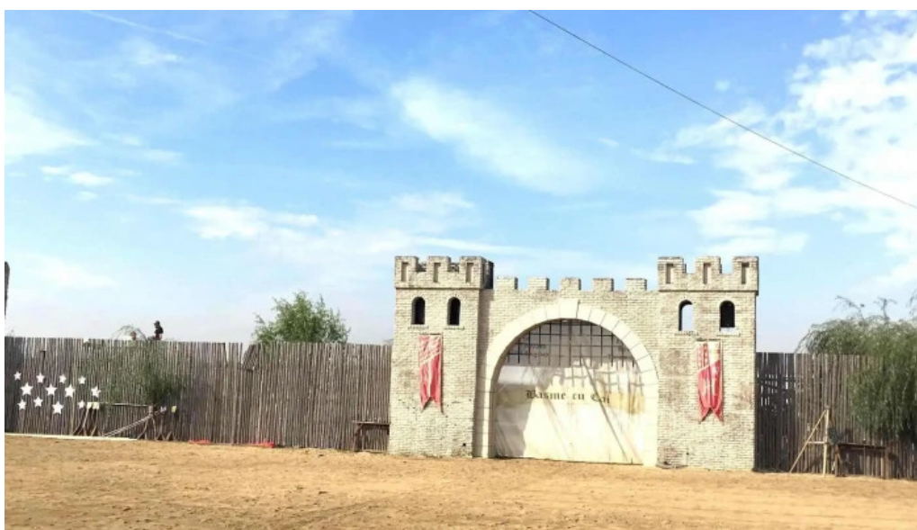
Basme cu cai adres?