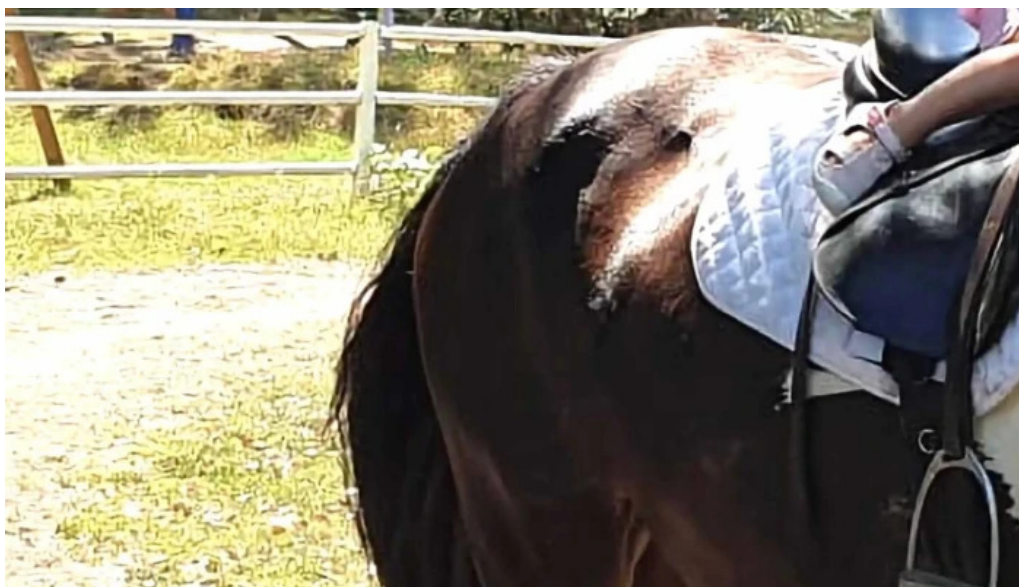
Basme cu cai aproape de mine