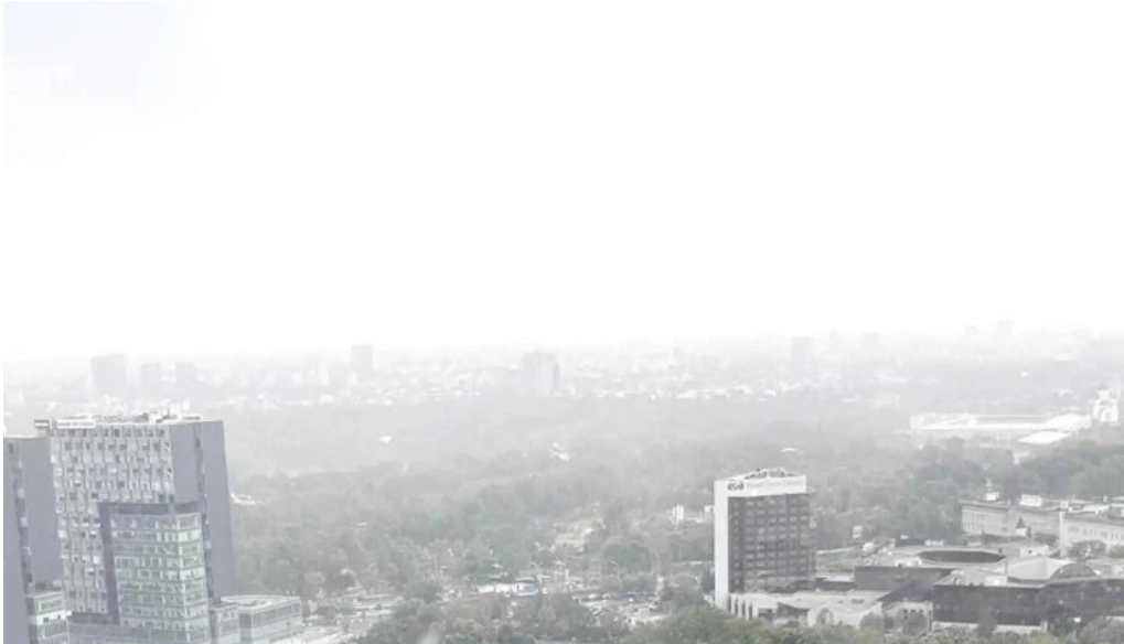
Cula izvoranu geblescu num?r