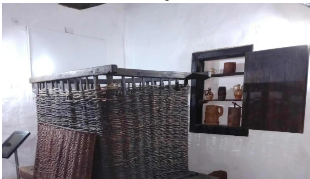
Cula izvoranu geblescu videoclipuri