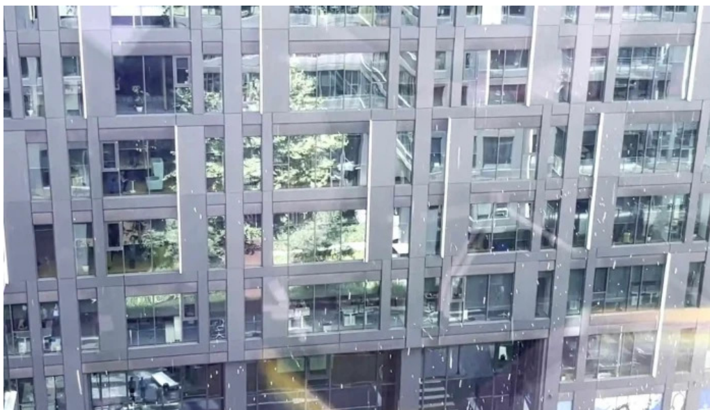
Cula izvoranu geblescu brabova