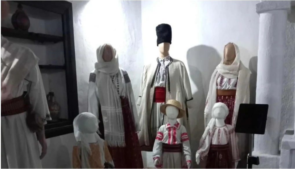
Cula izvoranu geblescu scor