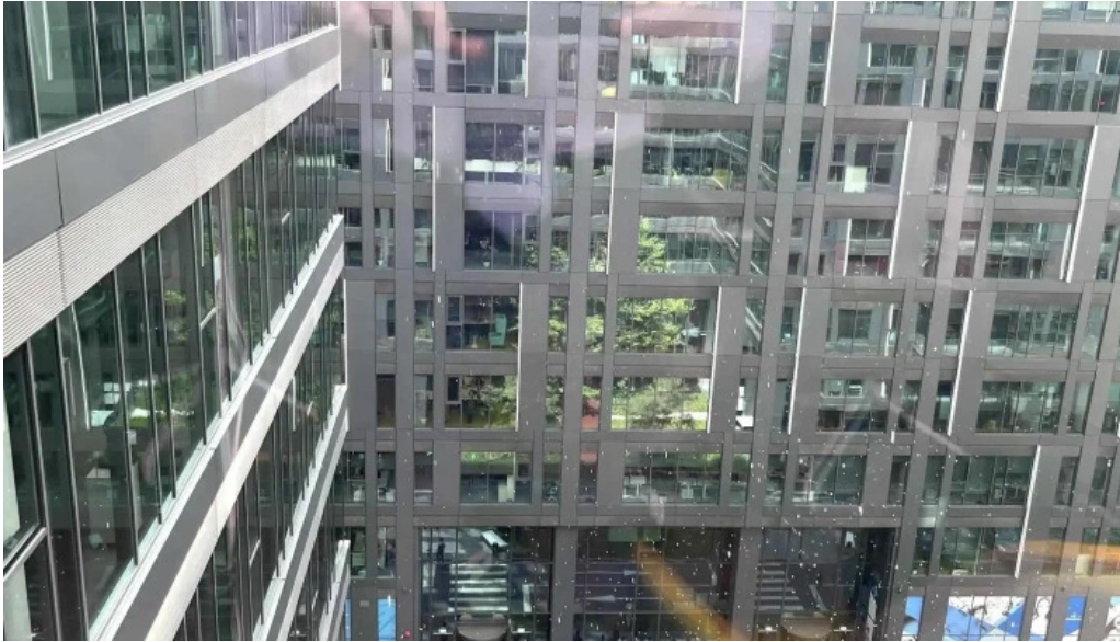
Cula izvoranu geblescu program