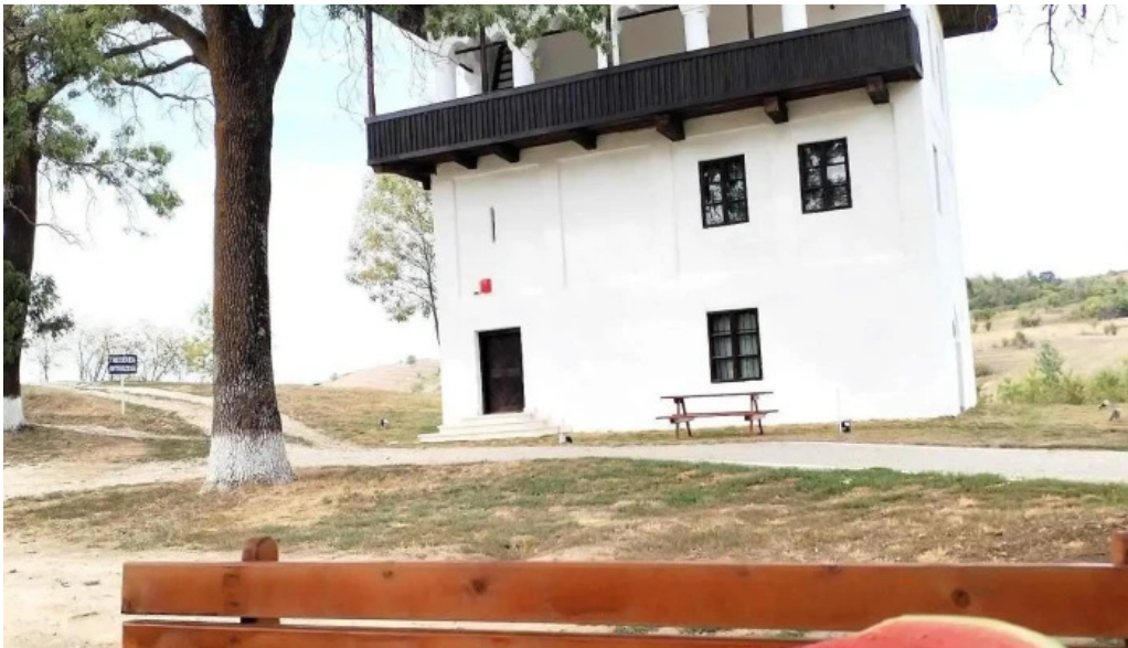
Cula izvoranu geblescu peisaj