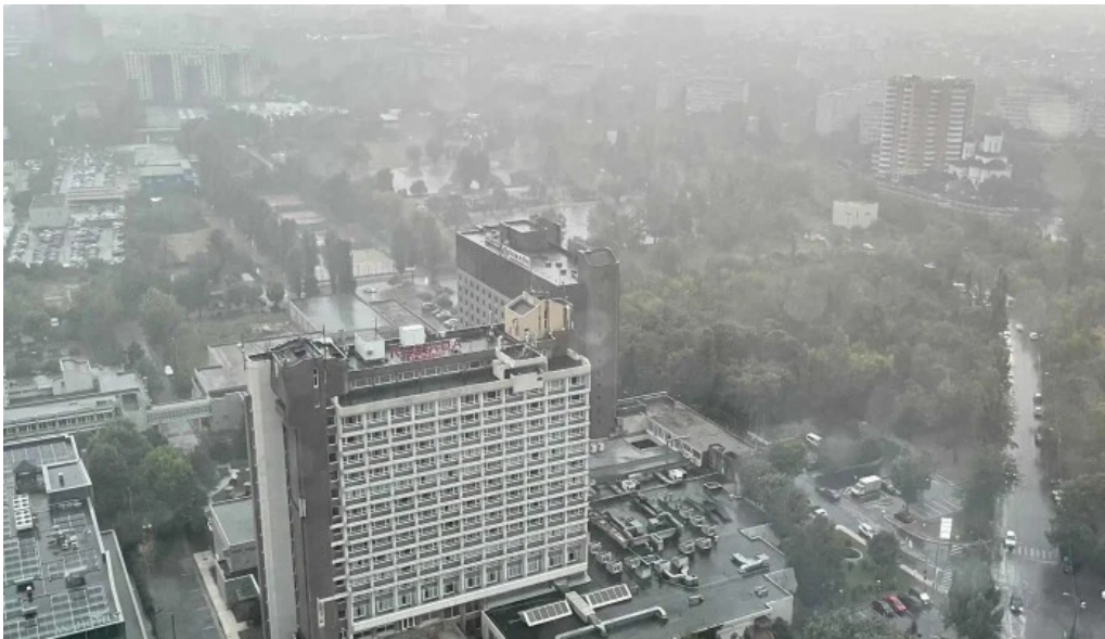
Cula izvoranu geblescu promo?ie