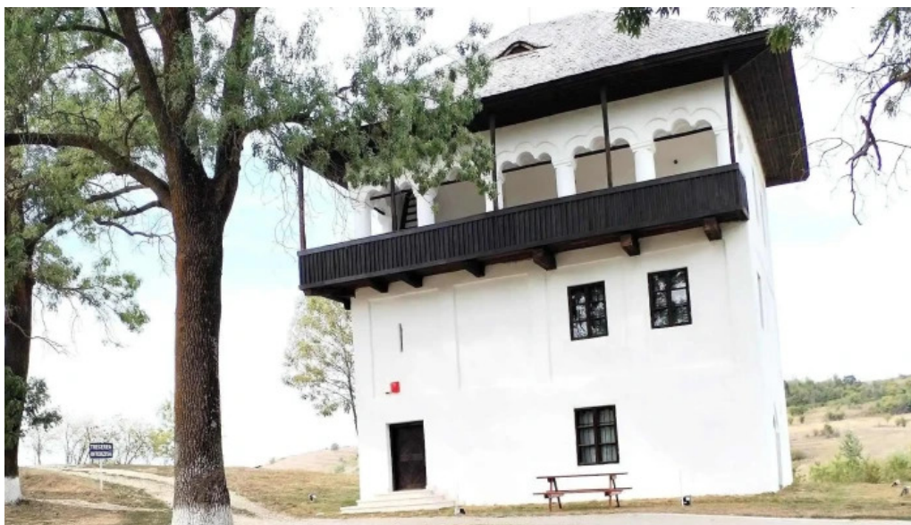
Cula izvoranu geblescu catalog