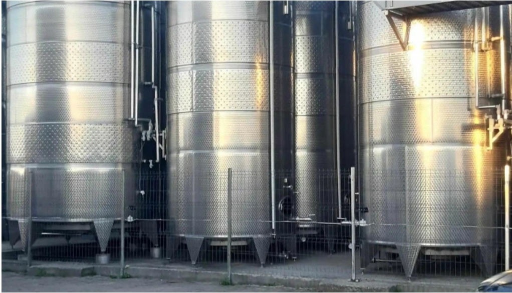
Domeniul ciumbrud comentarii