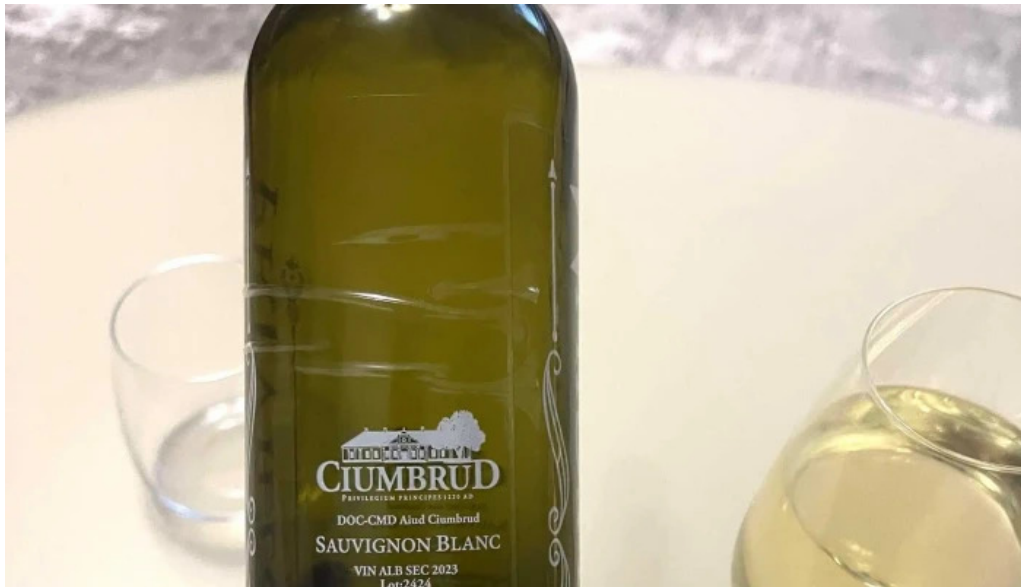
Domeniul ciombrud videoclipuri