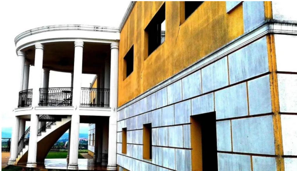
Domeniul ciombrud telefon