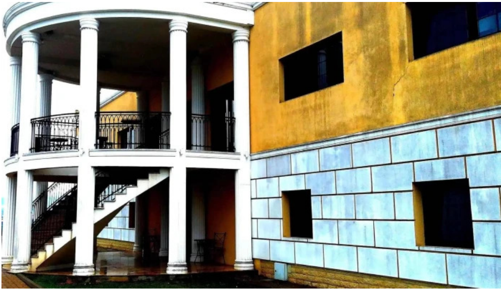
Domeniul ciumbrud pre?uri