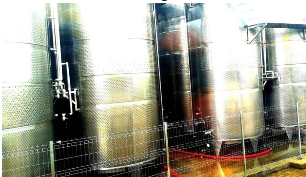
Domeniul ciumbrud zon?