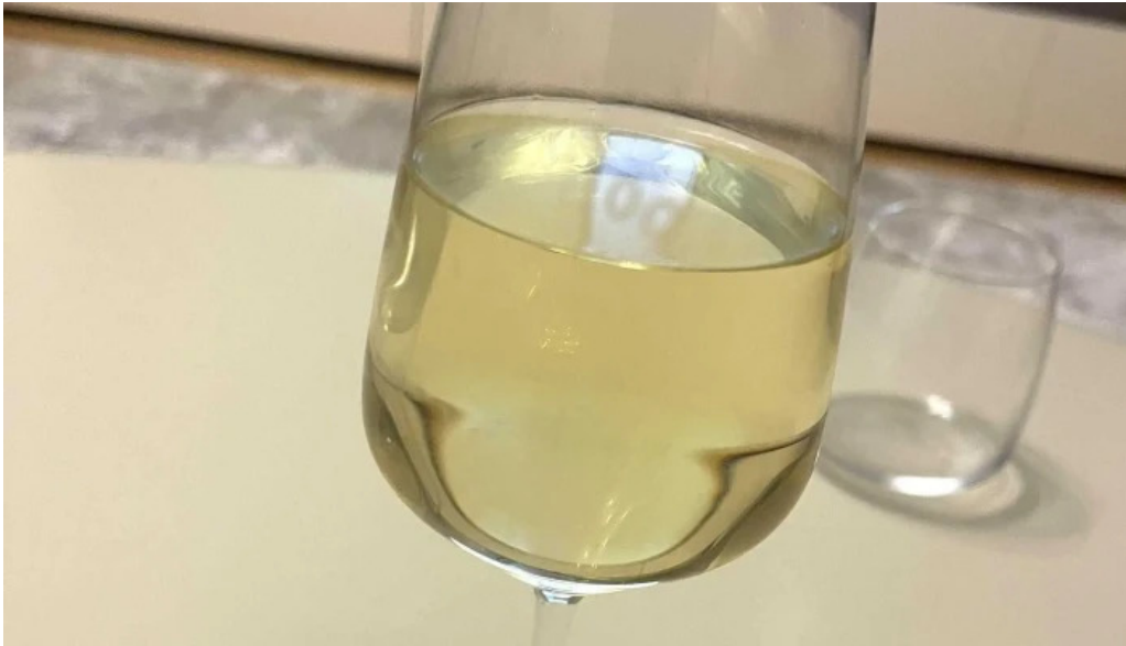
Domeniul ciumbrud ciumbrud