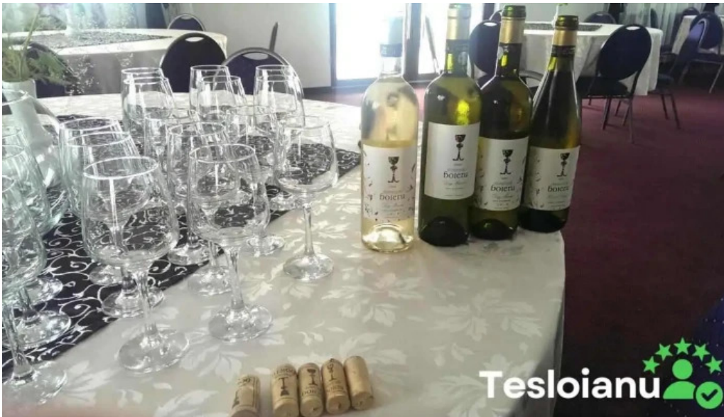
Domeniul ciumbrud masa