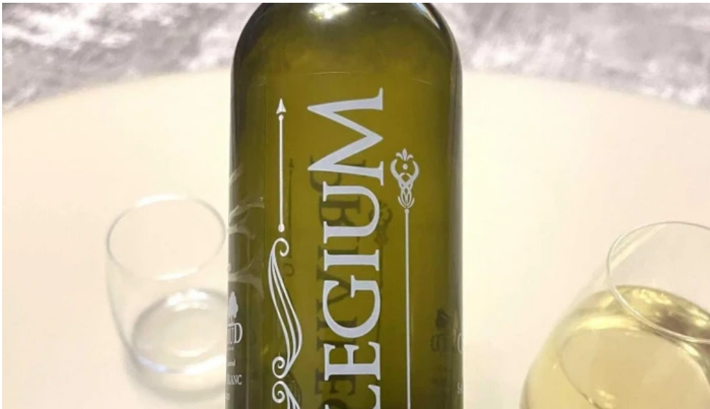
Domeniul ciumbrud recenzii