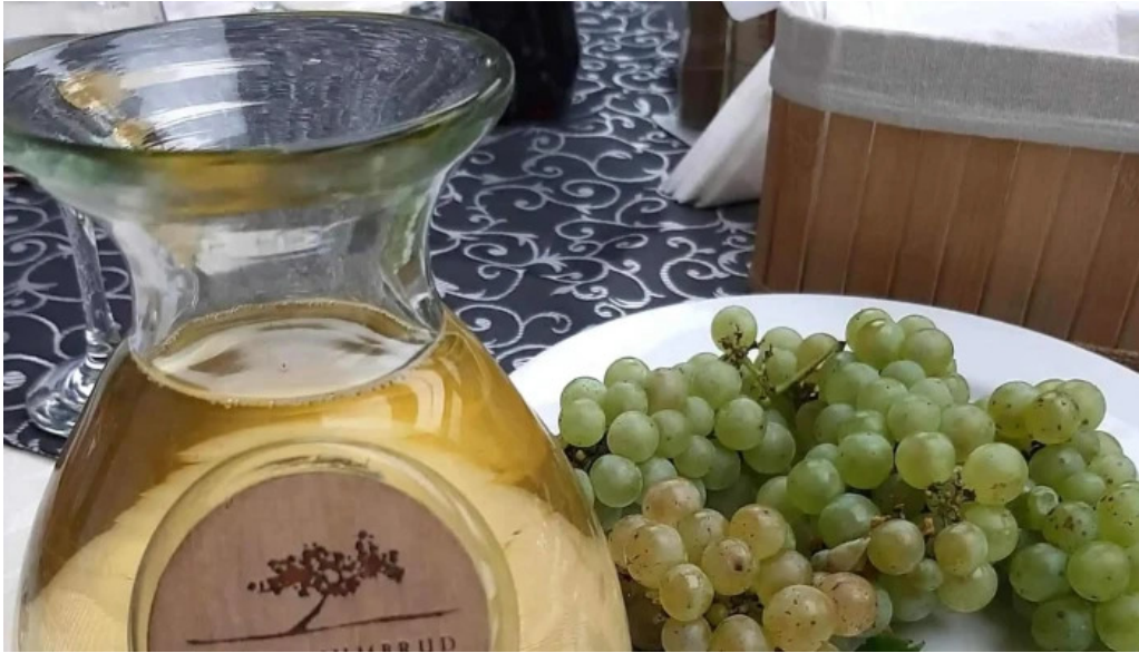
Domeniul ciumbrud reduceri