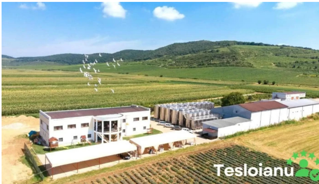
Domeniul ciumbrud de la proprietar