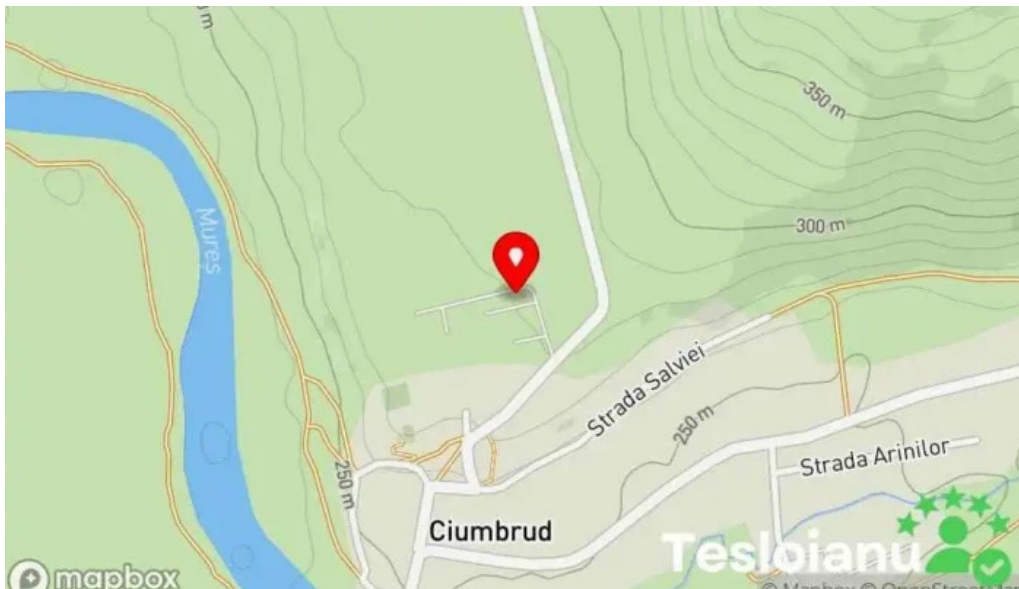
Domeniul ciumbrud hart?