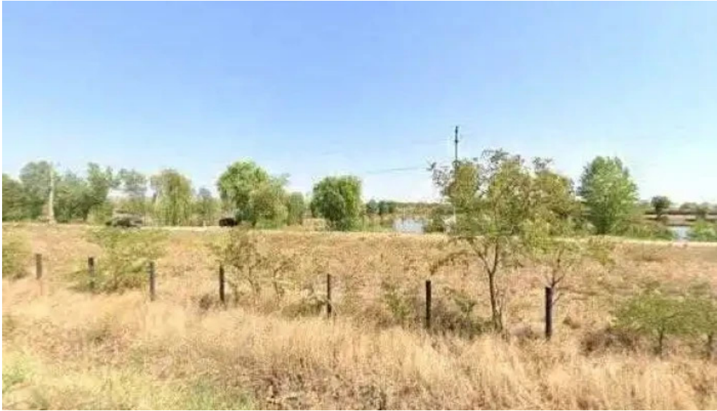
Balta brosteni street view si 360deg