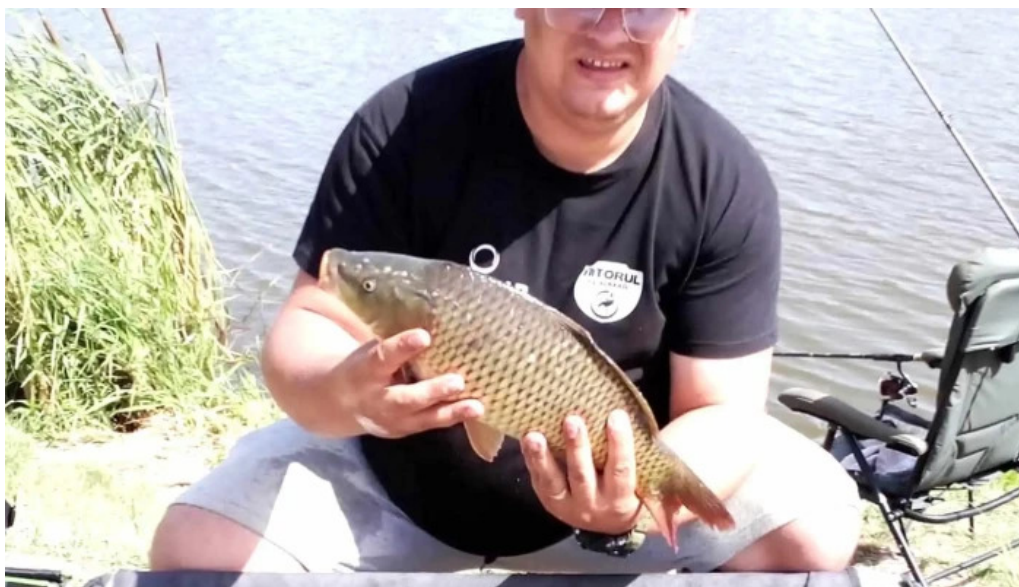
Balta brosteni bro?teni