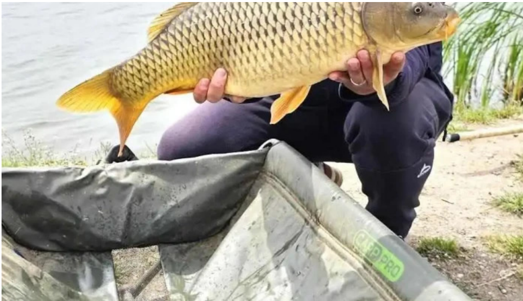
Balta brosteni pescuit