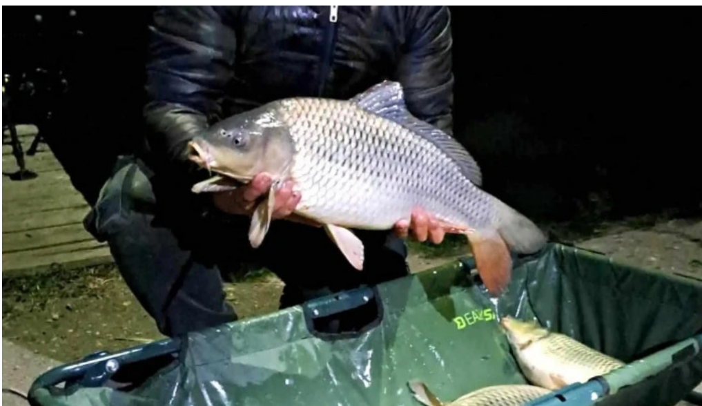
Balta brosteni deschis acum