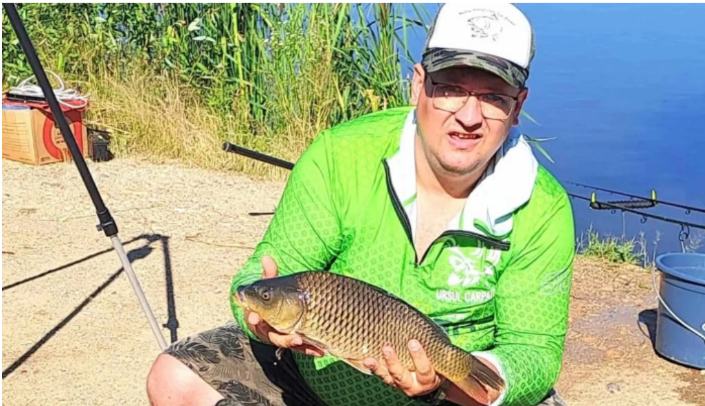
Balta brosteni loca?ie