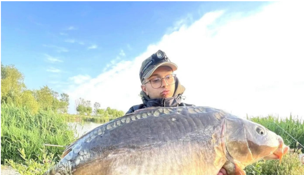
Balta brosteni cum s? ajungi acolo