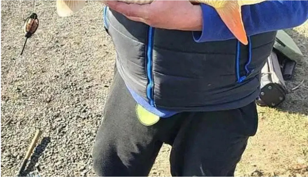
Balta brosteni peste