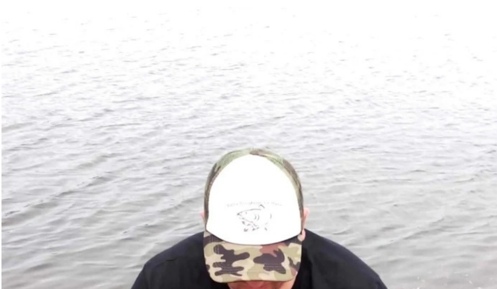
Balta brosteni fotografii