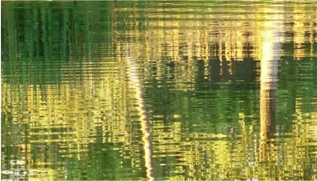
Balta brosteni de la proprietar