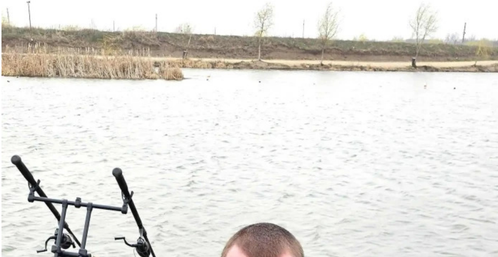
Balta brosteni num?r