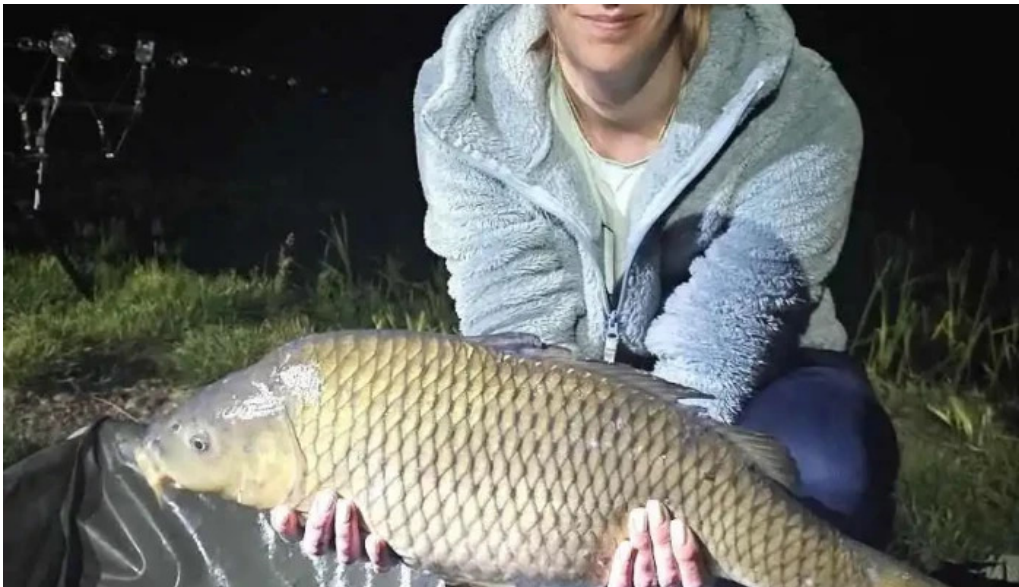
Balta brosteni natura