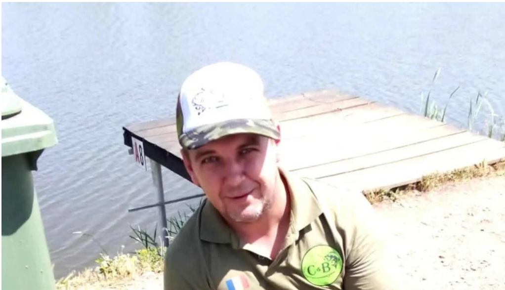
Balta brosteni pre?uri