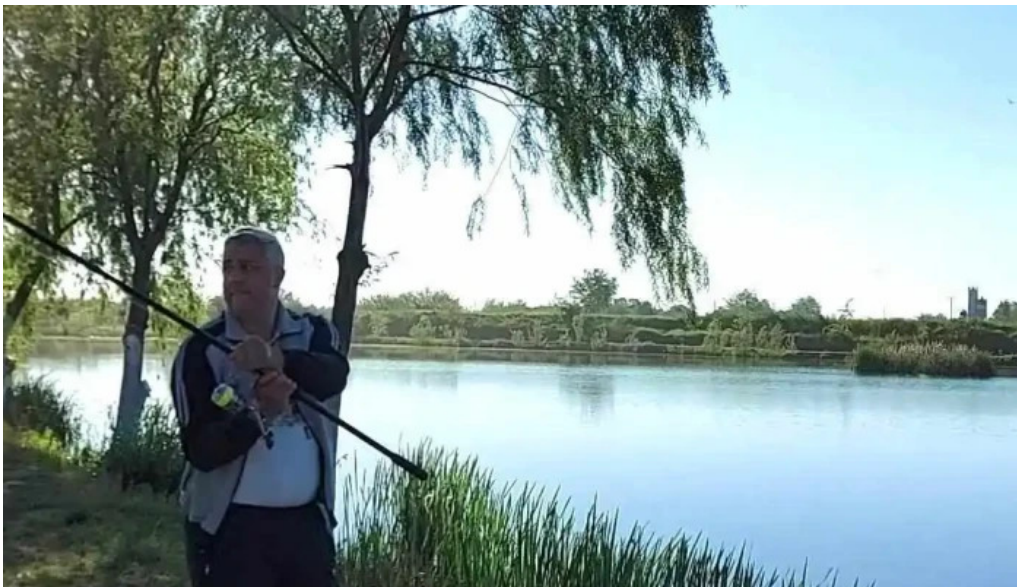
Balta brosteni videoclipuri