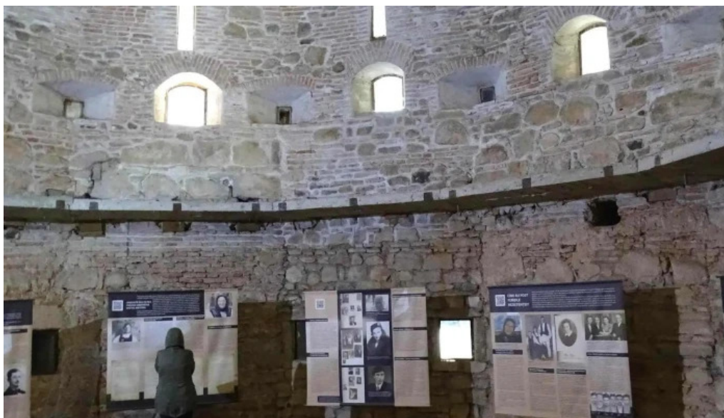
Cetatea fagarasului comentarii