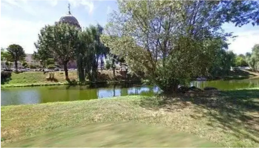
Cetatea fagarasului street view si 360deg