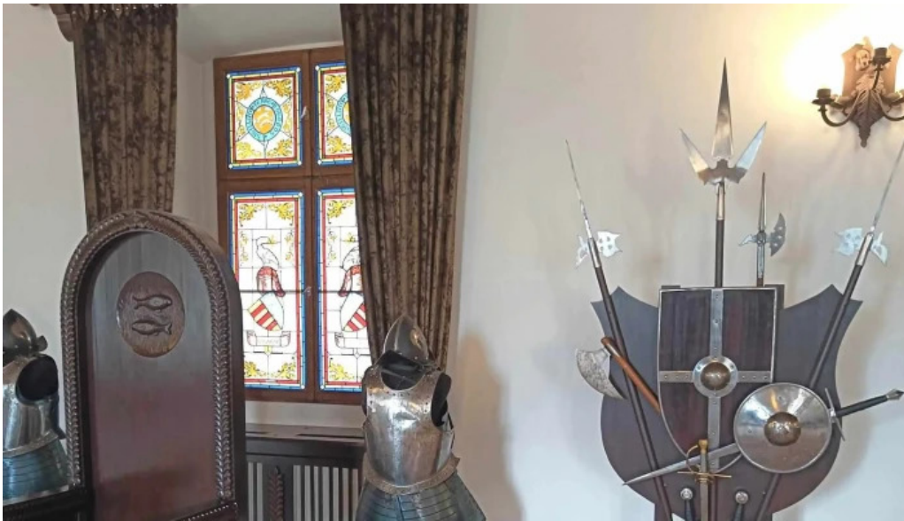
Cetatea fagarasului promo?ie