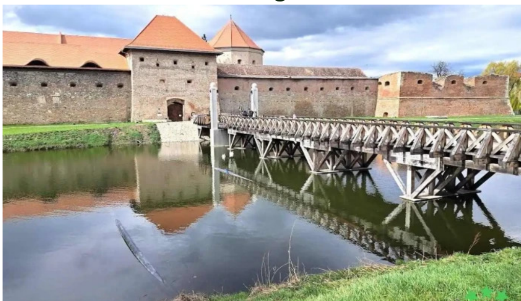
Cetatea făgărașului făgăraș