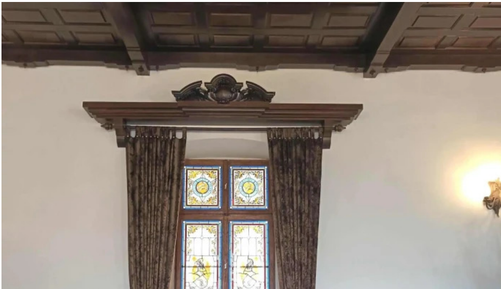
Cetatea fagarasului unde