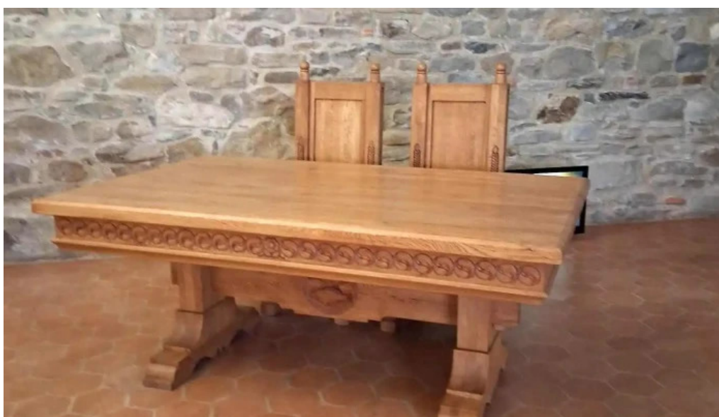
Cetatea fagarasului cele mai recente