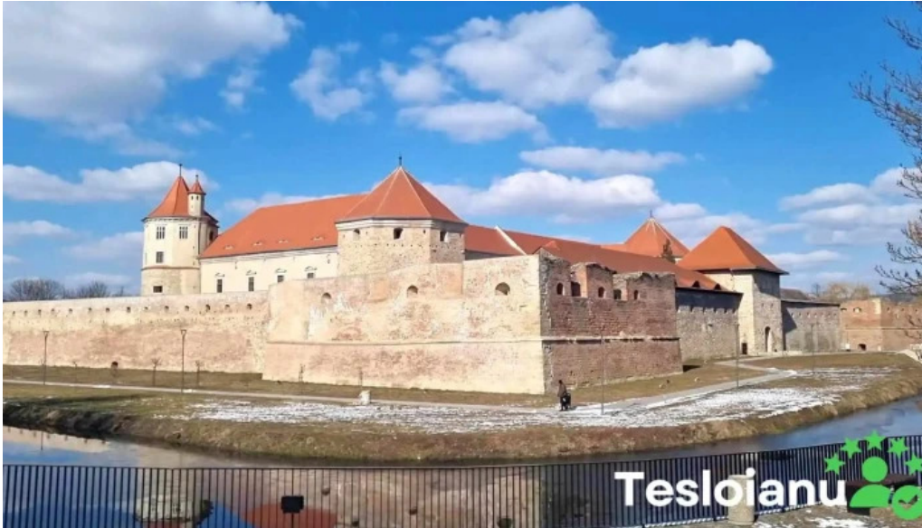
Cetatea fagarasului videoclipuri