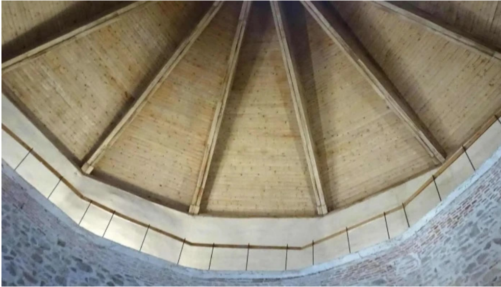
Cetatea fagarasului recenzii