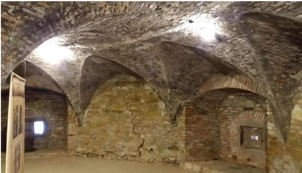
Cetatea fagarasului f?g?ra?