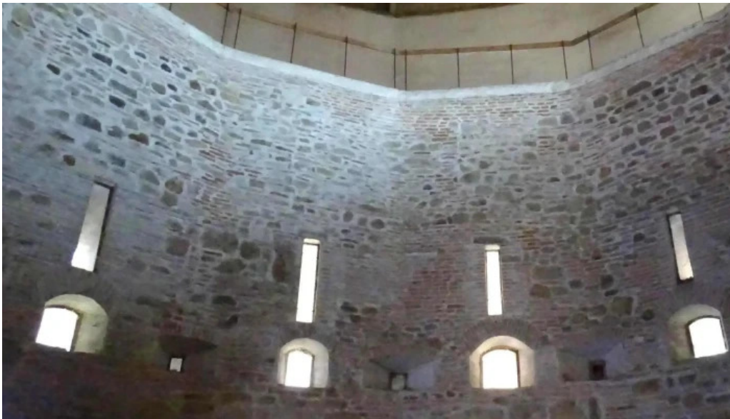
Cetatea fagarasului scor