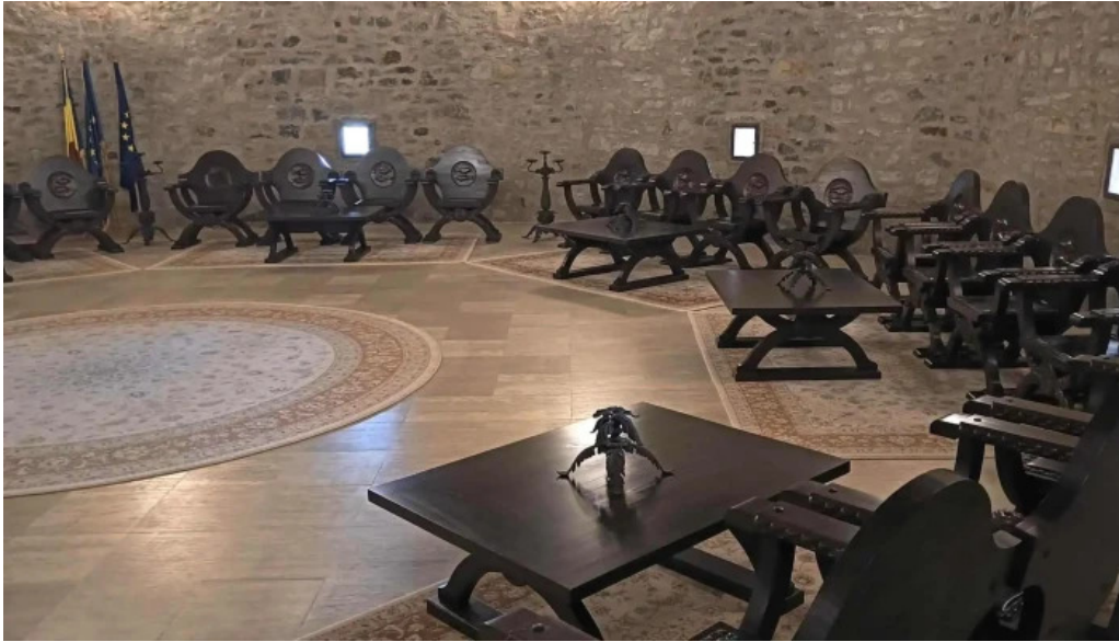
Cetatea fagarasului loca?ie