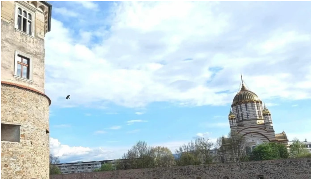
Cetatea fagarasului instagram