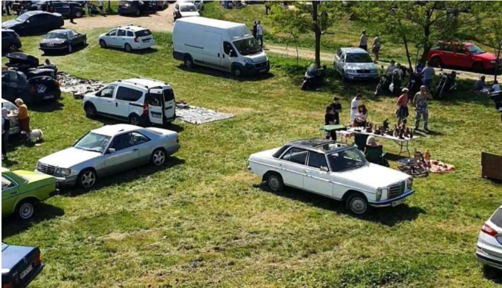
Cetatea biharia videoclipuri