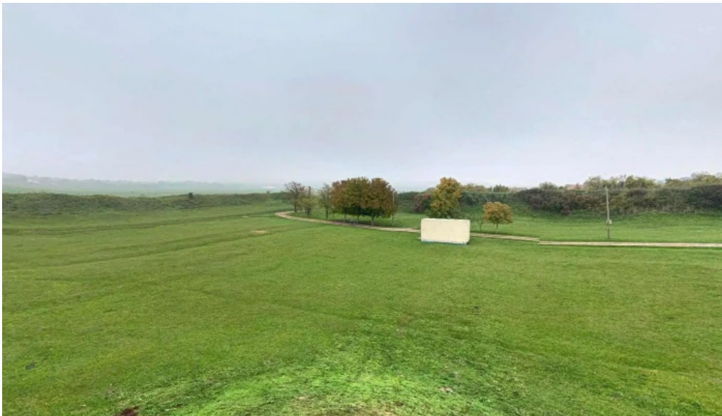
Cetatea biharia street view si 360