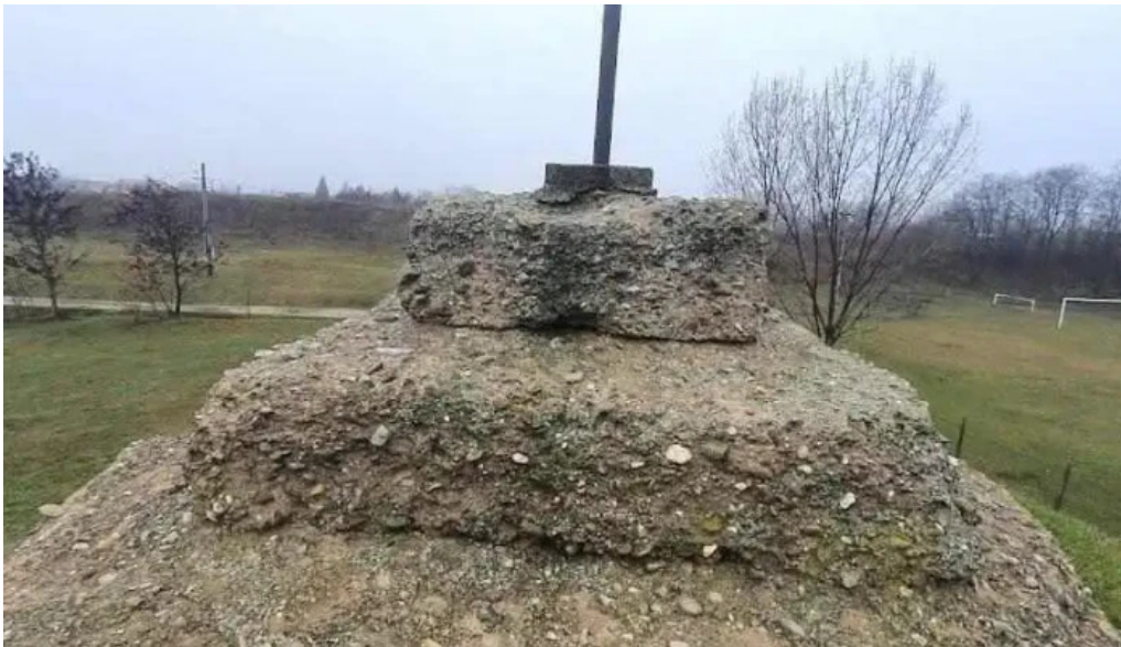
Cetatea biharia biharia