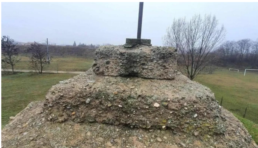
Cetatea biharia adres?