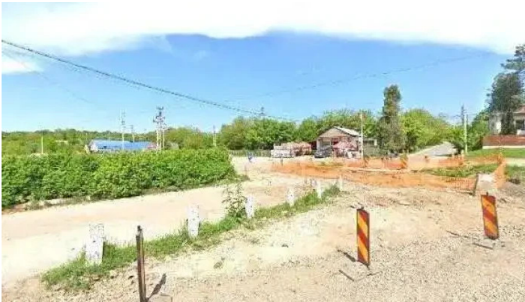
Comana street view si 360deg