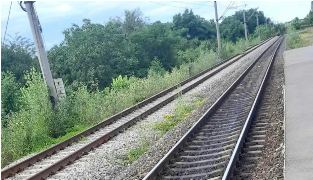
Parc mogosoia h fotografii