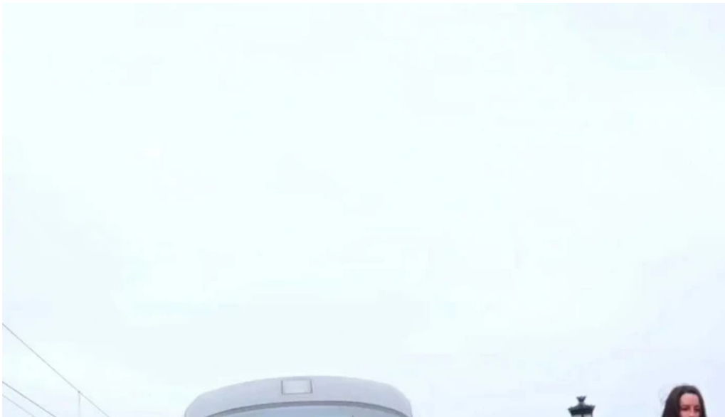
Parc mogosoia h mogo?oia