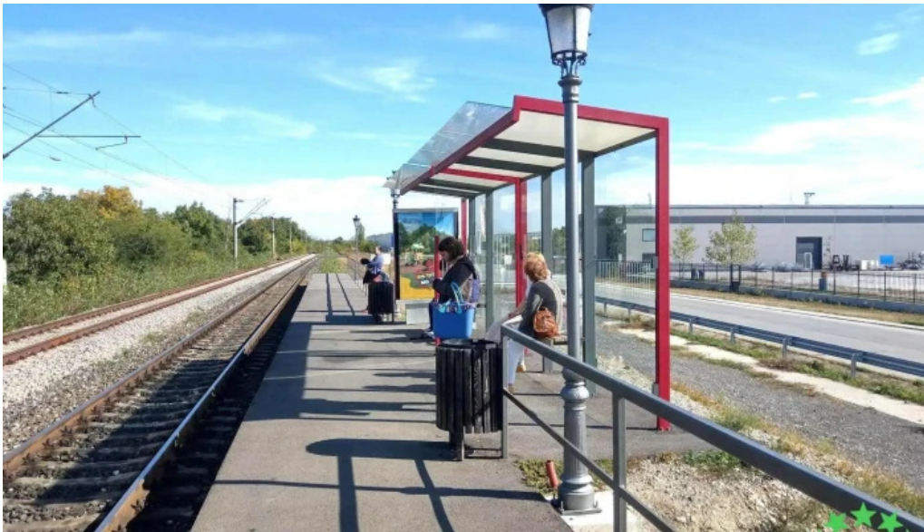
Parc mogosoia h gara