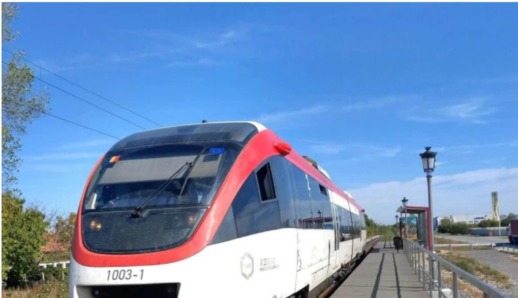
Parc mogosoia h scor