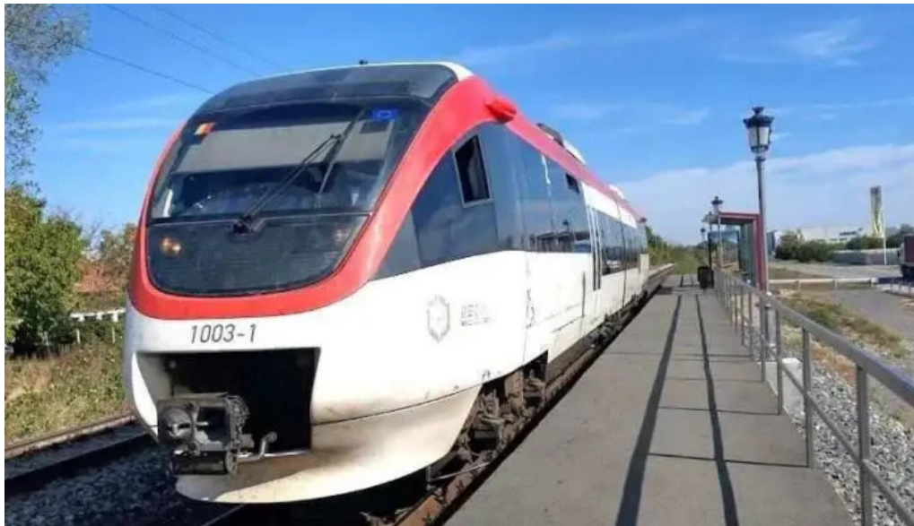
Parc mogo?oaia h mogo?oaia