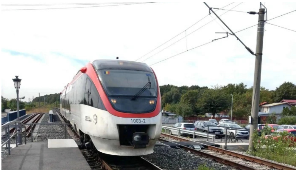
Parc mogosoaia h instagram