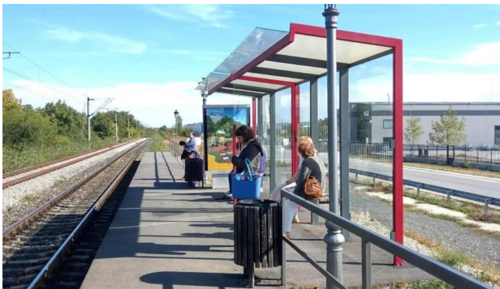
Parc mogosoia h deschis acum