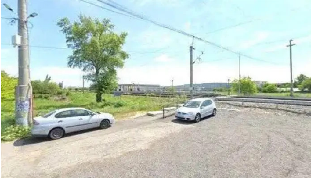
Parc mogosoia h street view si 360deg