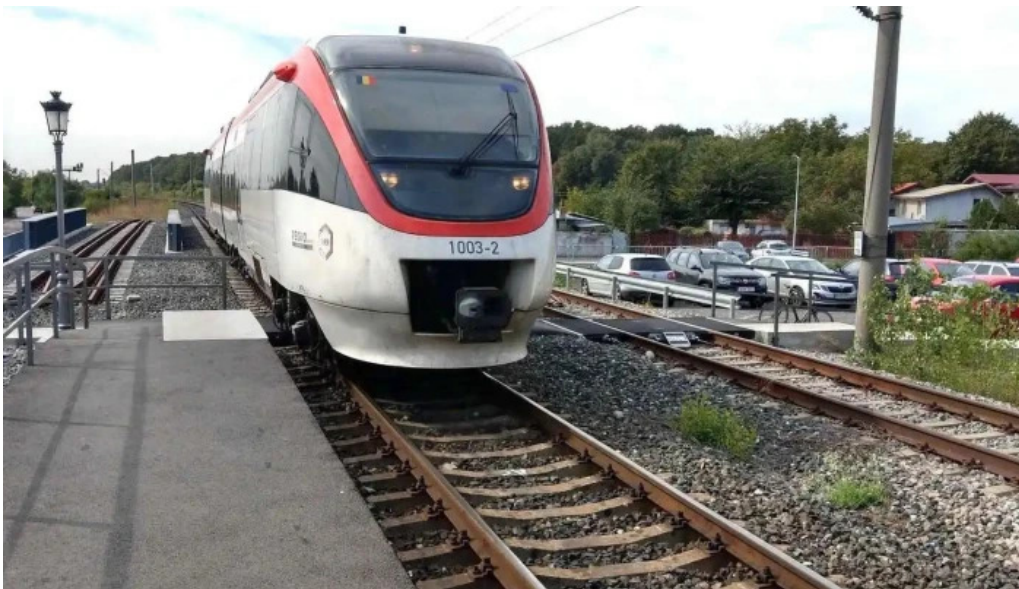
Parc mogosoia h sina