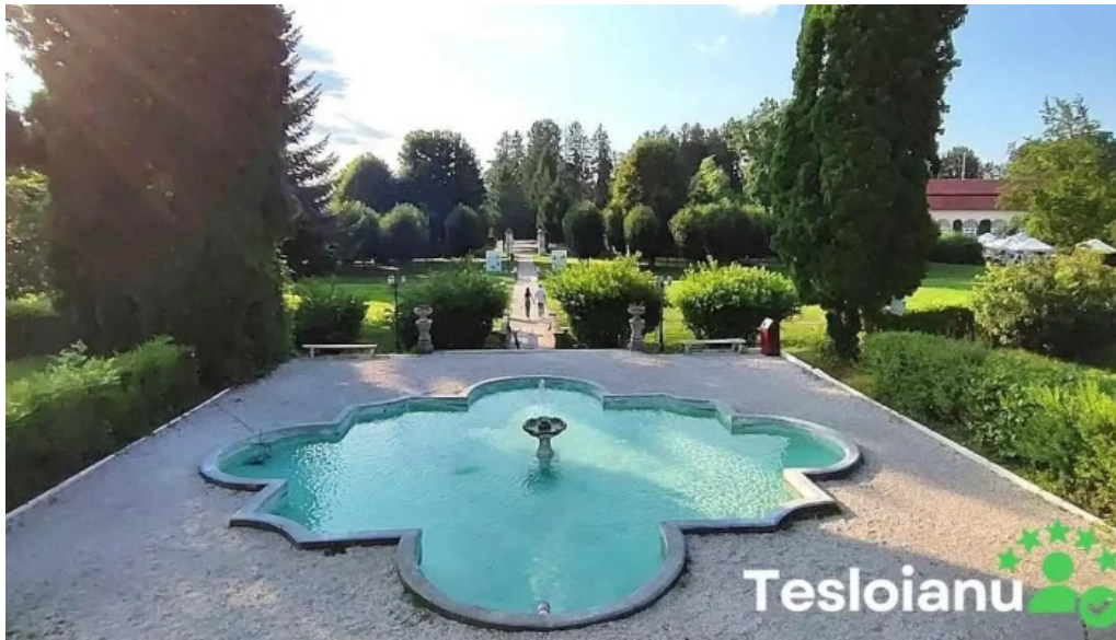
Palatul brukenthal avrig videoclipuri