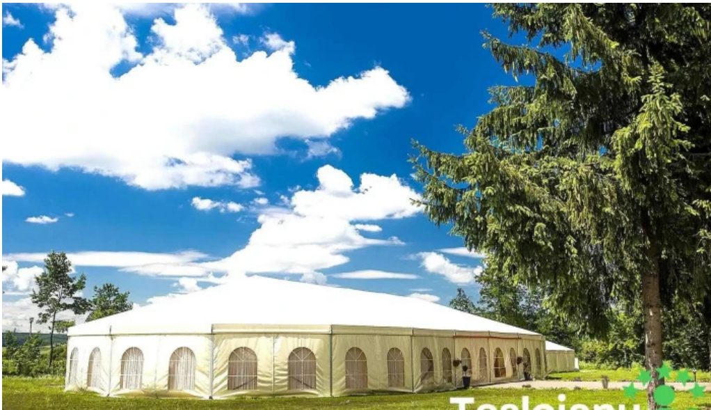
Palatul brukenthal avrig loca?ie