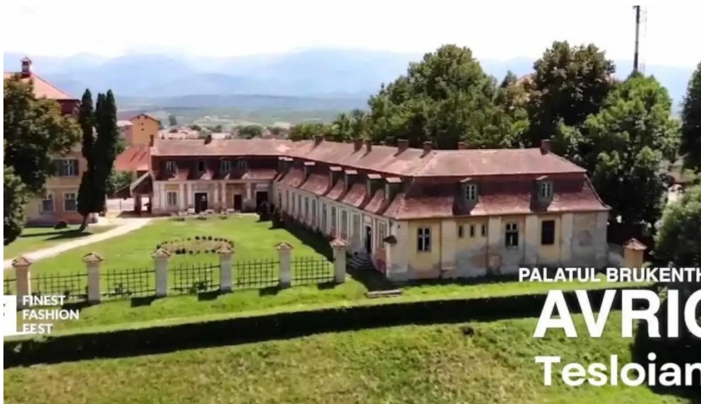
Palatul brukenthal avrig exterior