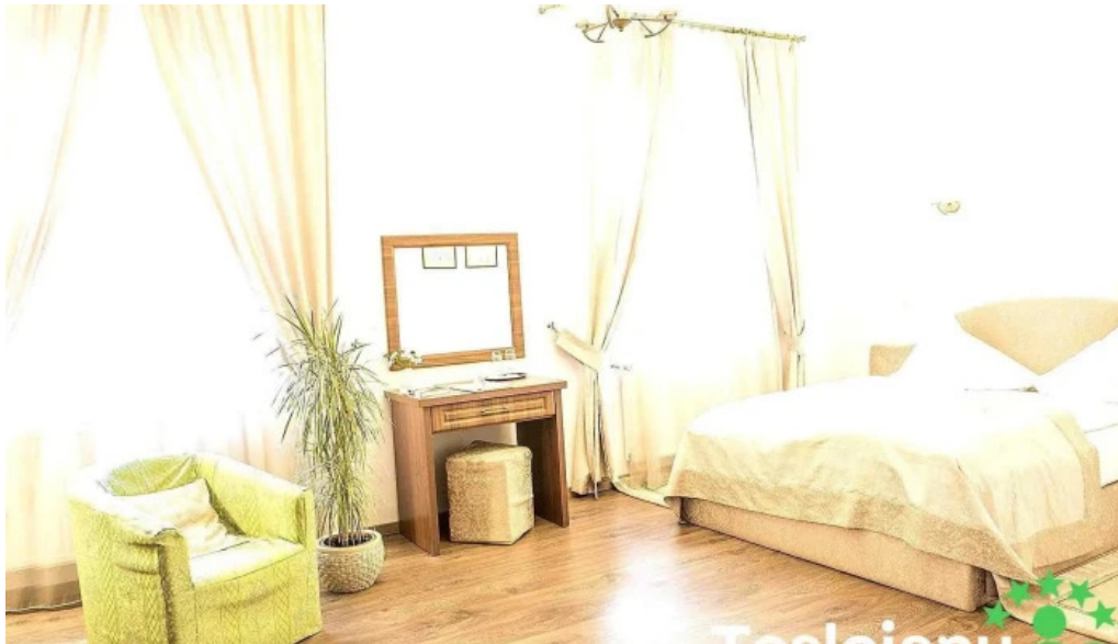
Palatul brukenthal avrig camere