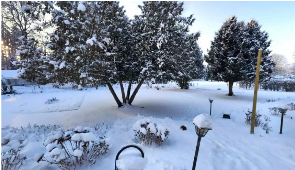
Palatul brukenthal avrig street view si 360