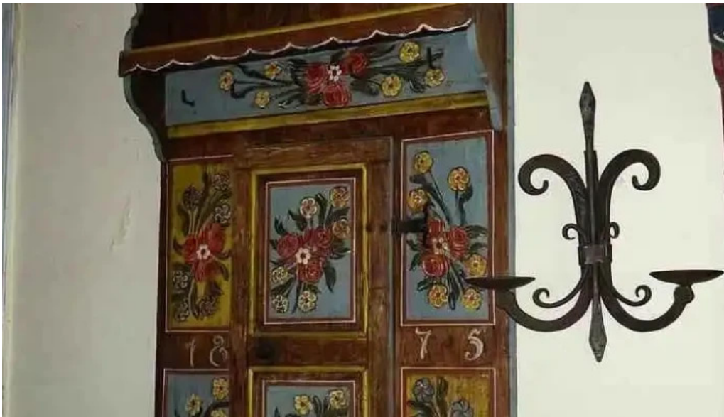
Palatul brukenthal avrig cele mai recente