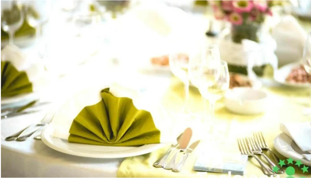
Palatul brukenthal avrig mancaruribauturi