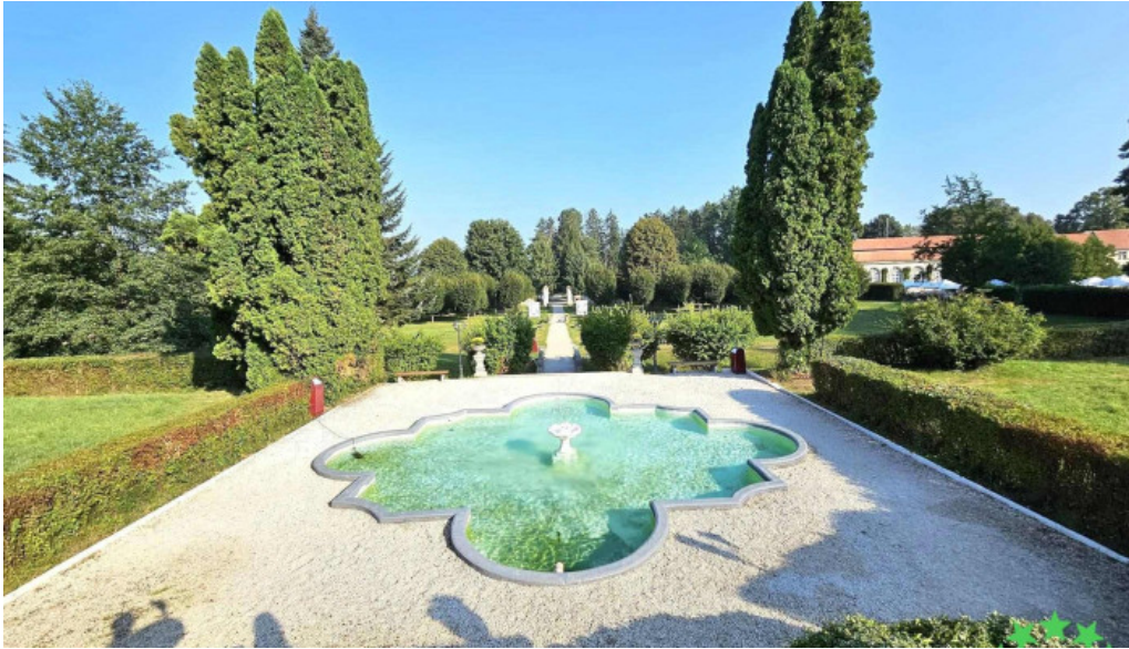
Palatul brukenthal avrig dotari