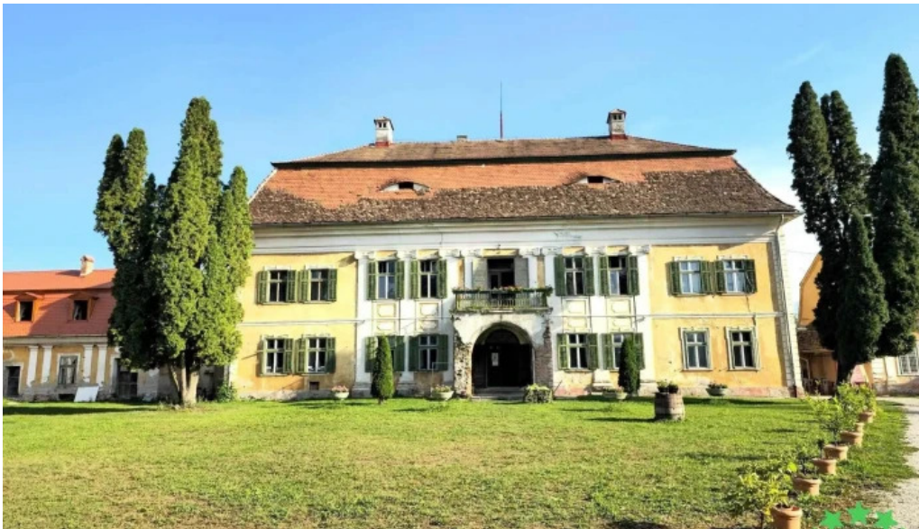
Palatul brukenthal avrig de la vizitatori