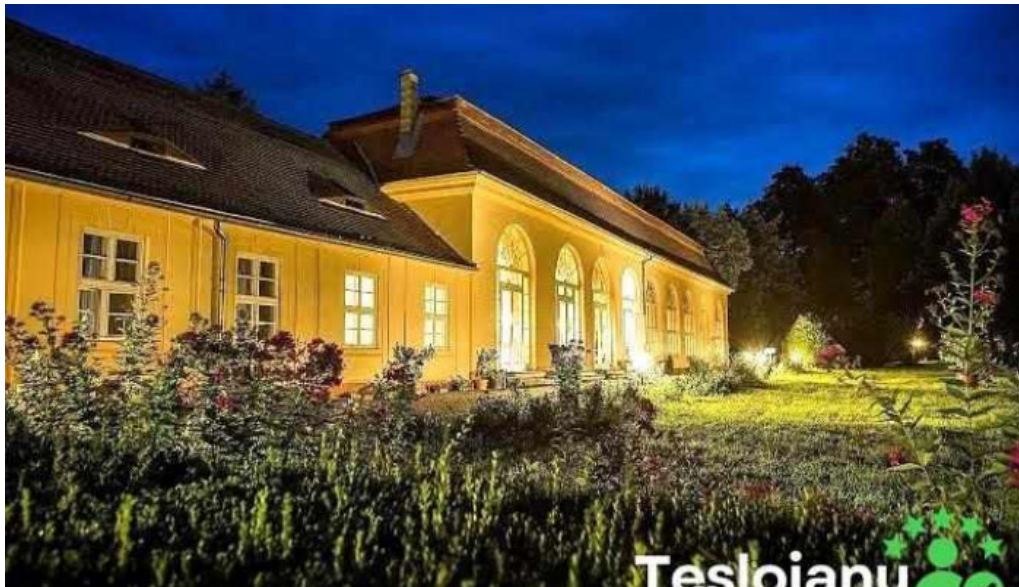
Palatul brukenthal avrig avrig