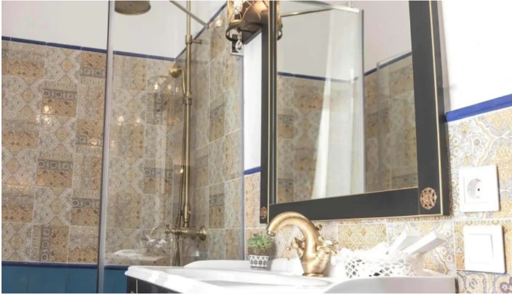
Palatul brukenthal avrig de la proprietar