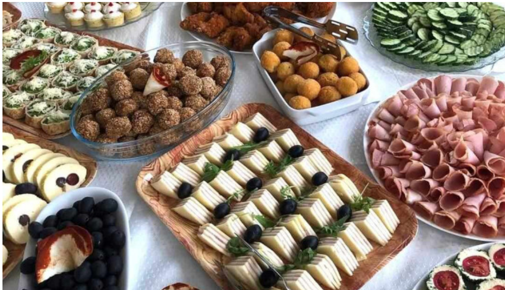
Casa runcu mancaruribauturi