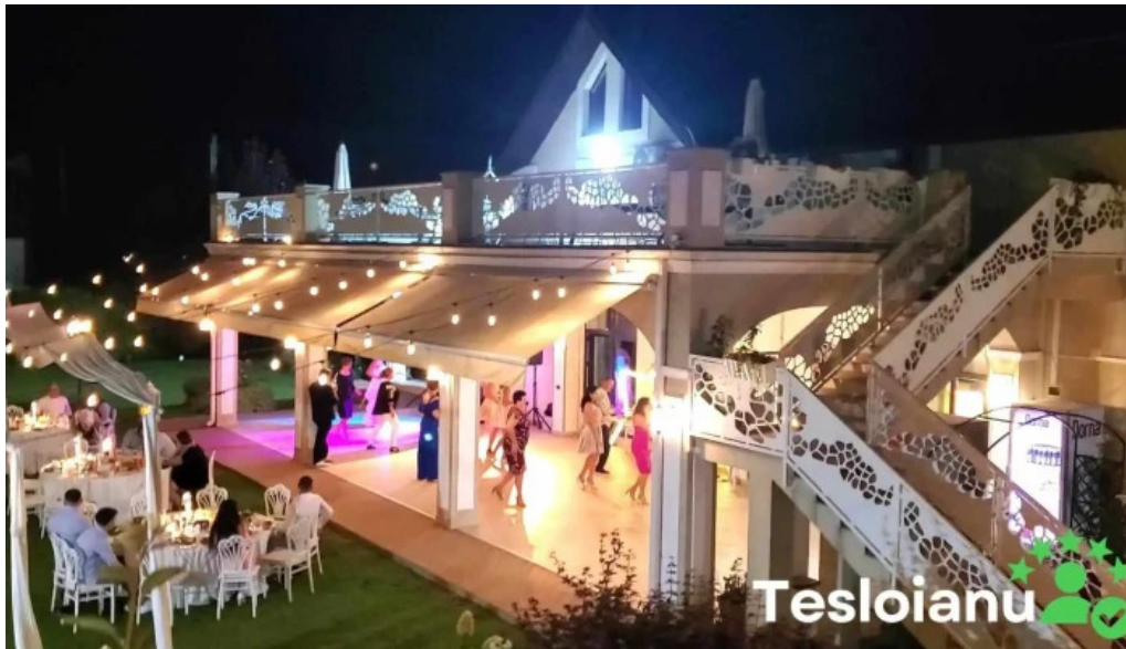
Casa runcu exterior