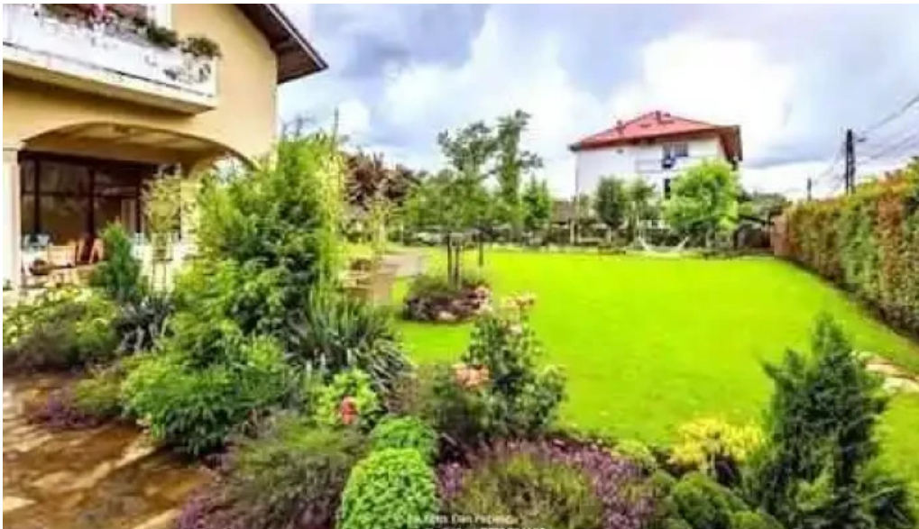
Casa runcu s?n?te?ti