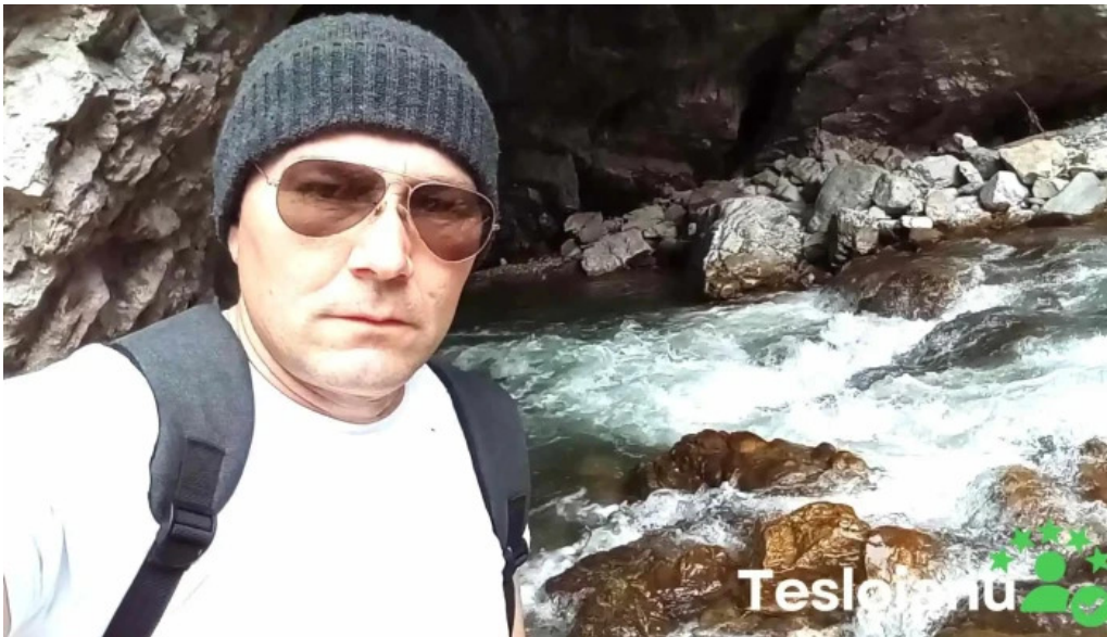
Casa runcu videoclipuri