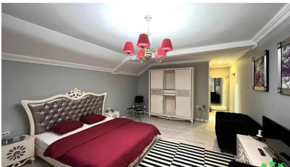
Casa runcu camere