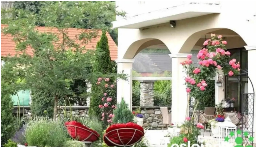
Casa runcu de la vizitatori