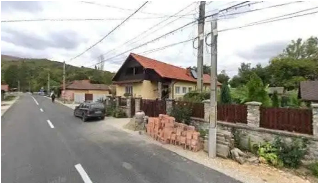
Casa runcu street view si 360deg