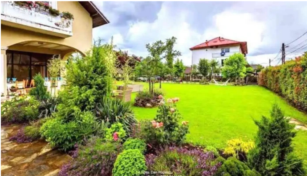
Casa runcu reduceri