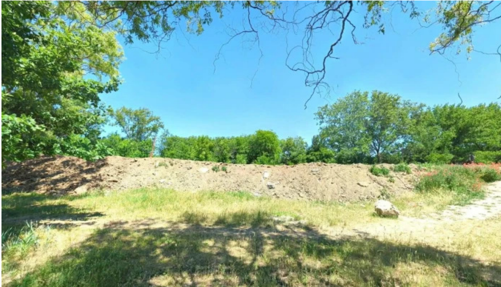
Balta chisoda street view si 360deg