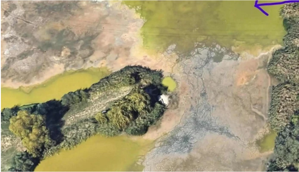
Balta chisoda chi?oda