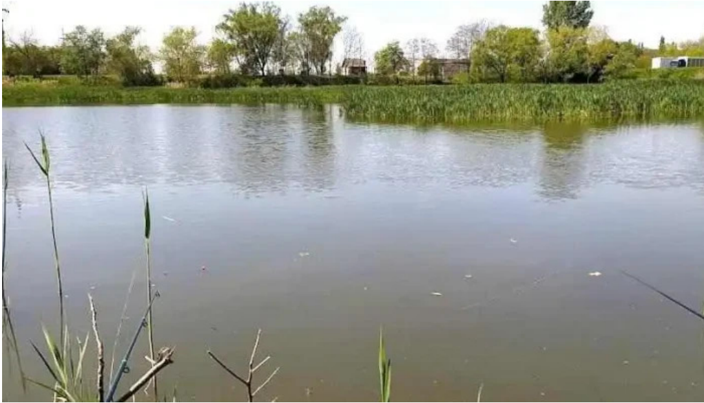
Balta chi?oda chi?oda