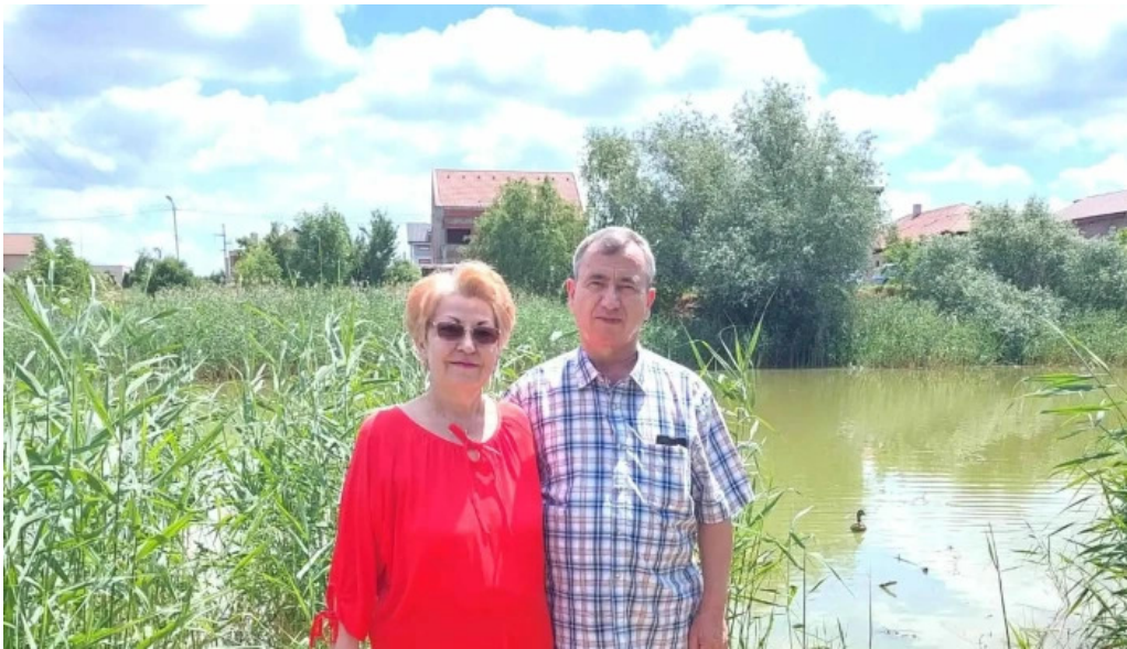
Balta chisoda telefon