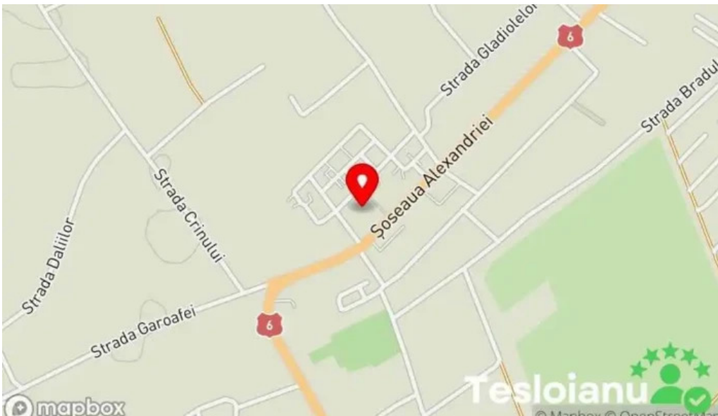
Judecatoria cornetu hart?