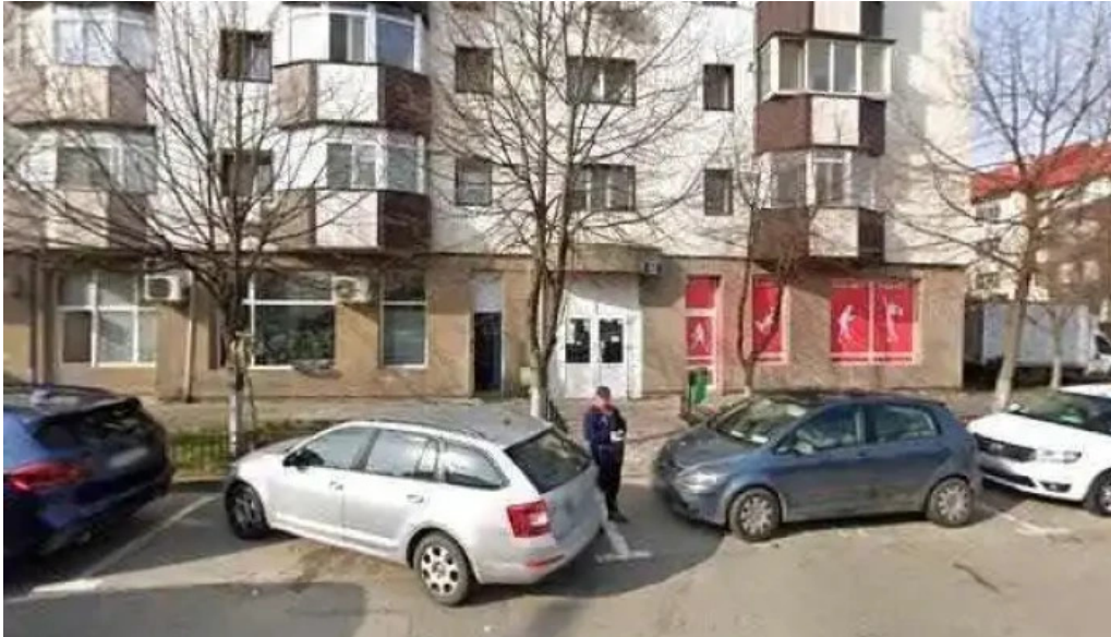
Judecatoria cornetu street view si 360deg