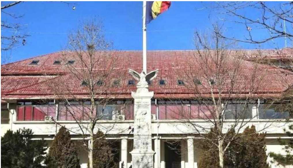
Judec?toria cornetu cornetu