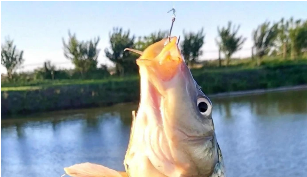
Balta gjarmata zon?