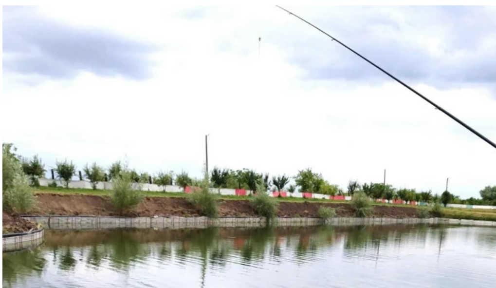
Balta giarmata aleea trandafirilor