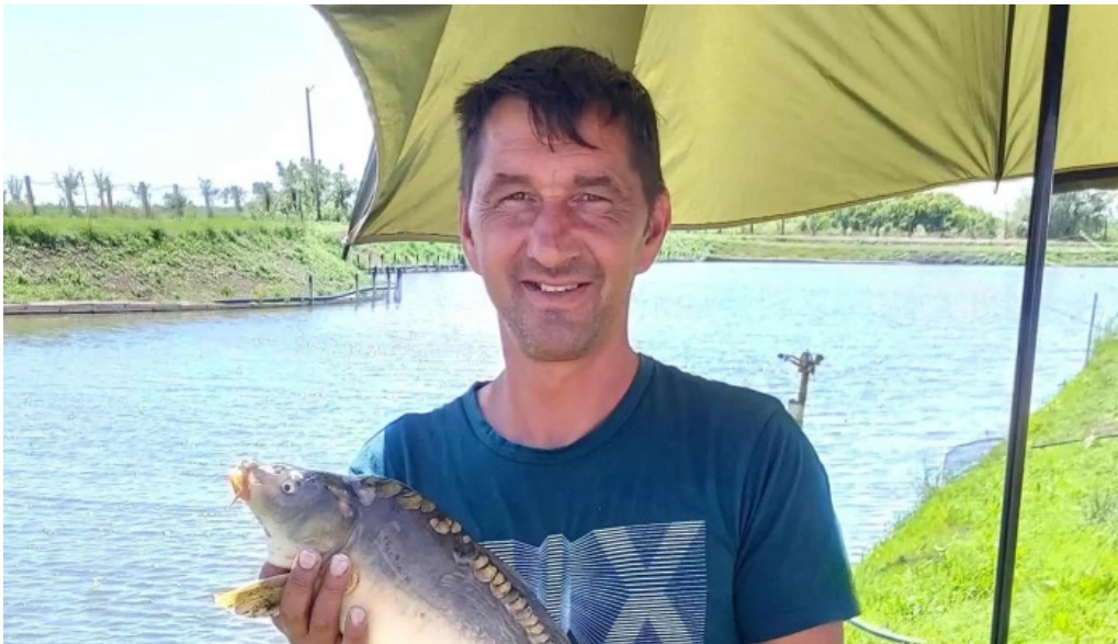
Balta giarmata telefon