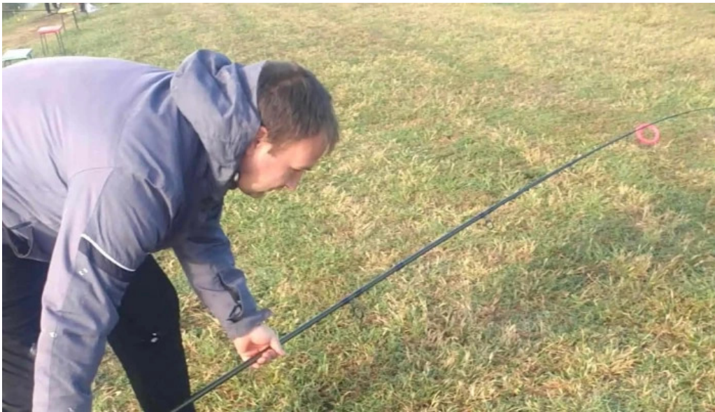
Balta giarmata loca?ie