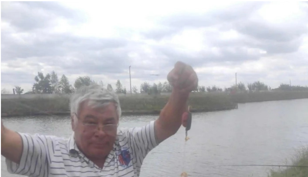
Balta giarmata recenzii