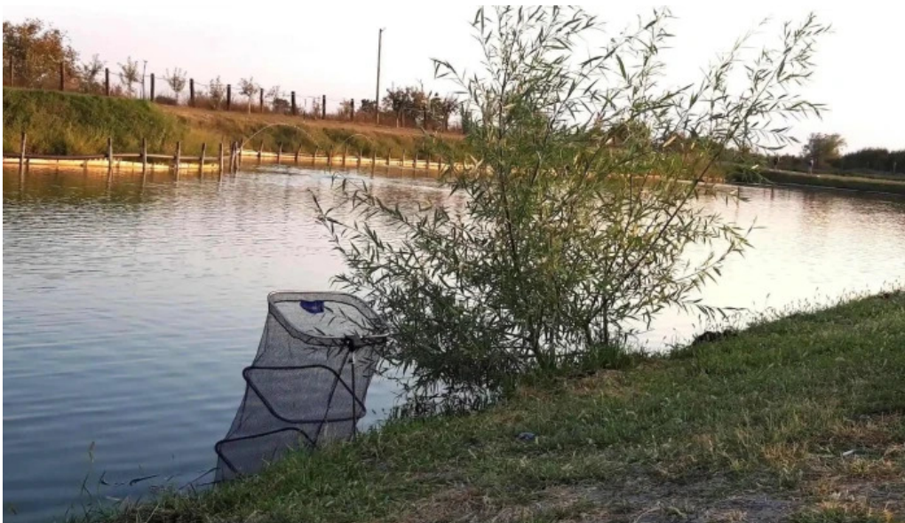
Balta gjarmata videoclipuri