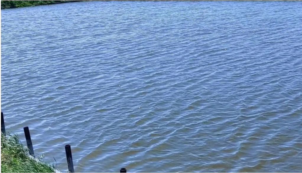
Balta giarmata num?r