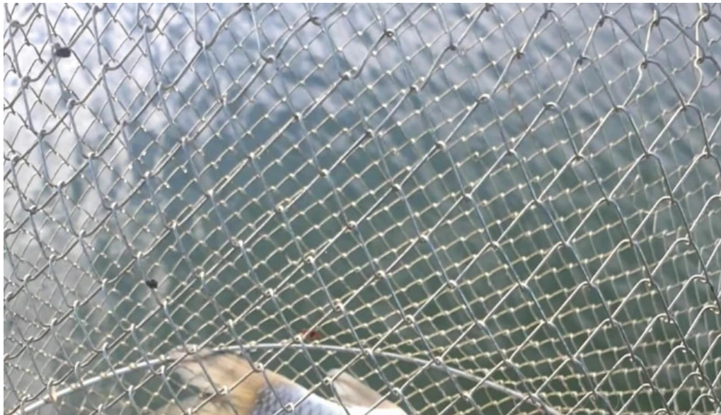
Balta giarmata fotografii