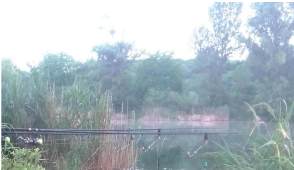
Lacul bors videoclipuri