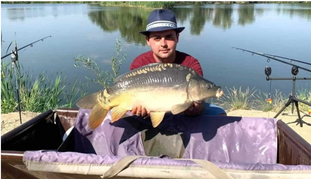
Lacul bors loca?ie