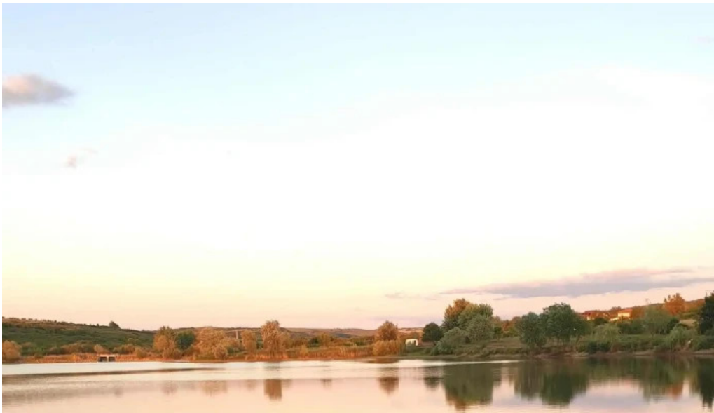
Lacul bors bor?