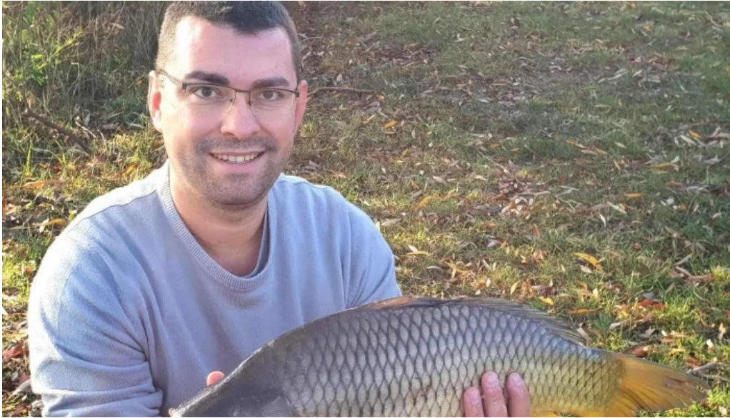
Lacul bors num?r