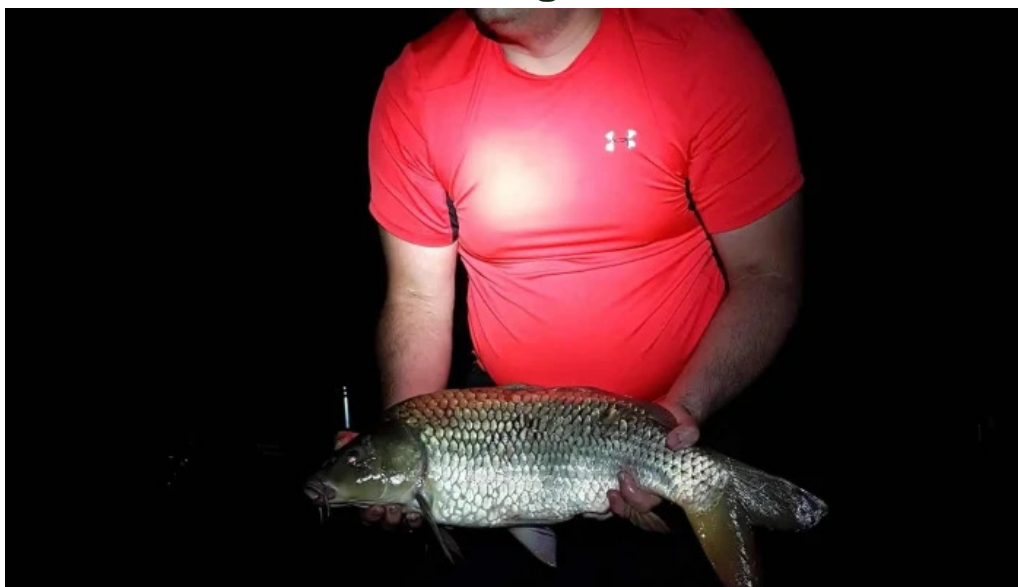
Lacul bors zon?