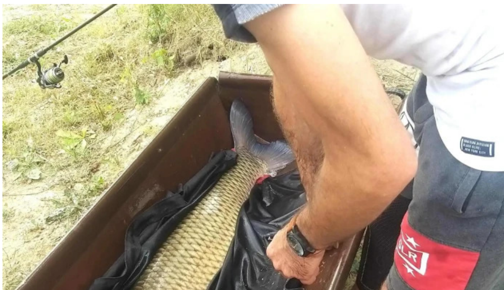
Lacul bors aproape de mine