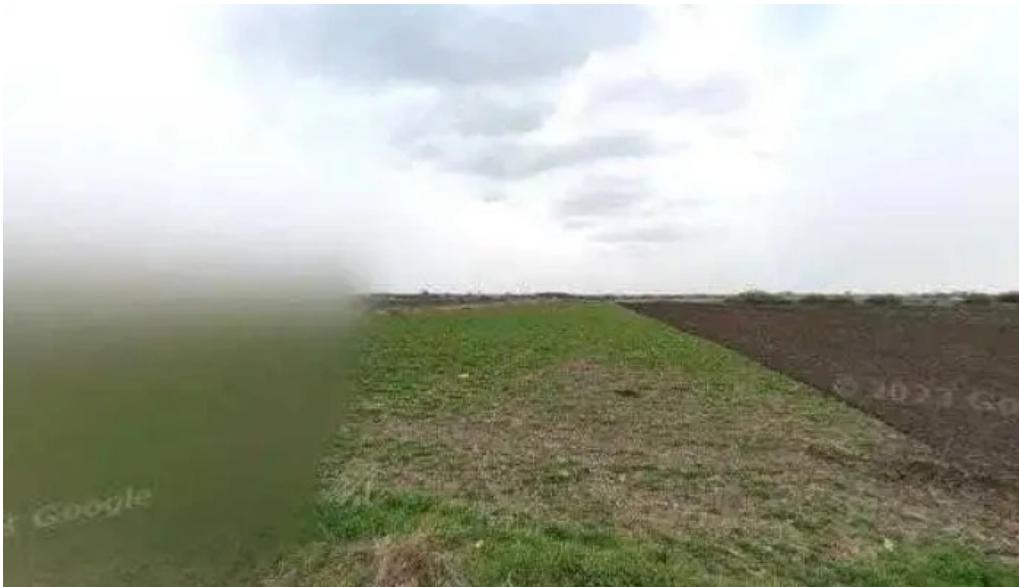
Lacul bors street view si 360deg