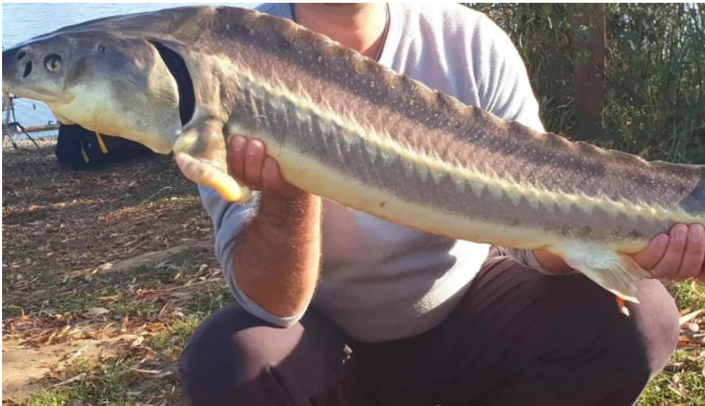
Lacul bors deschis acum