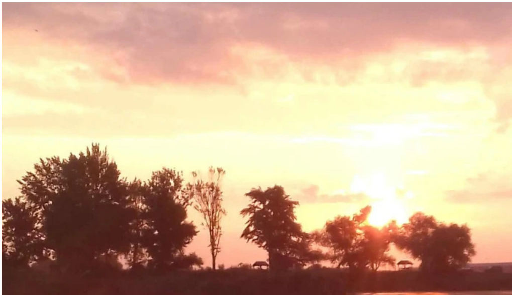
Lacul bors reduceri