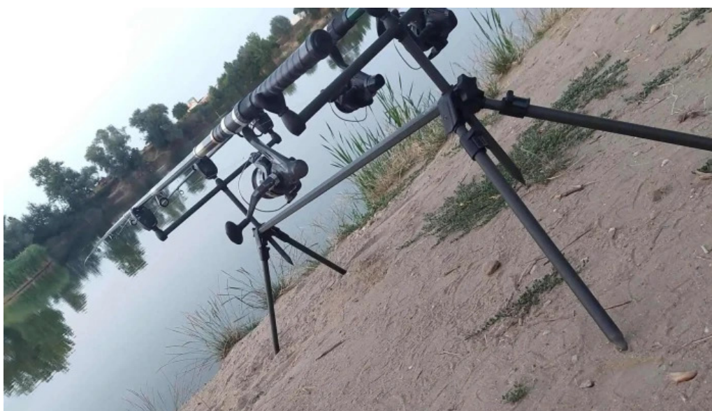
Lacul bors adres?