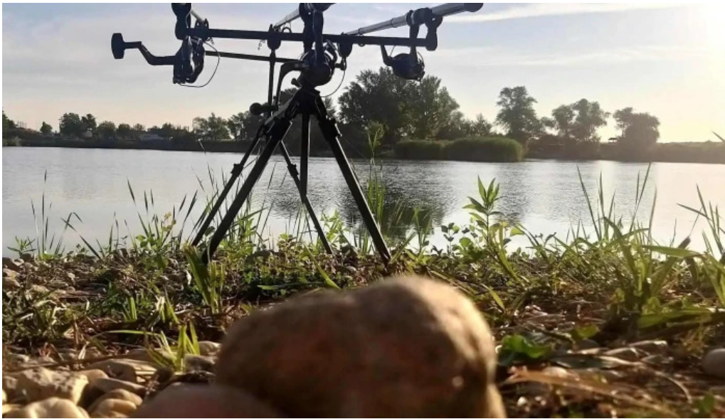
Lacul bors comentarii