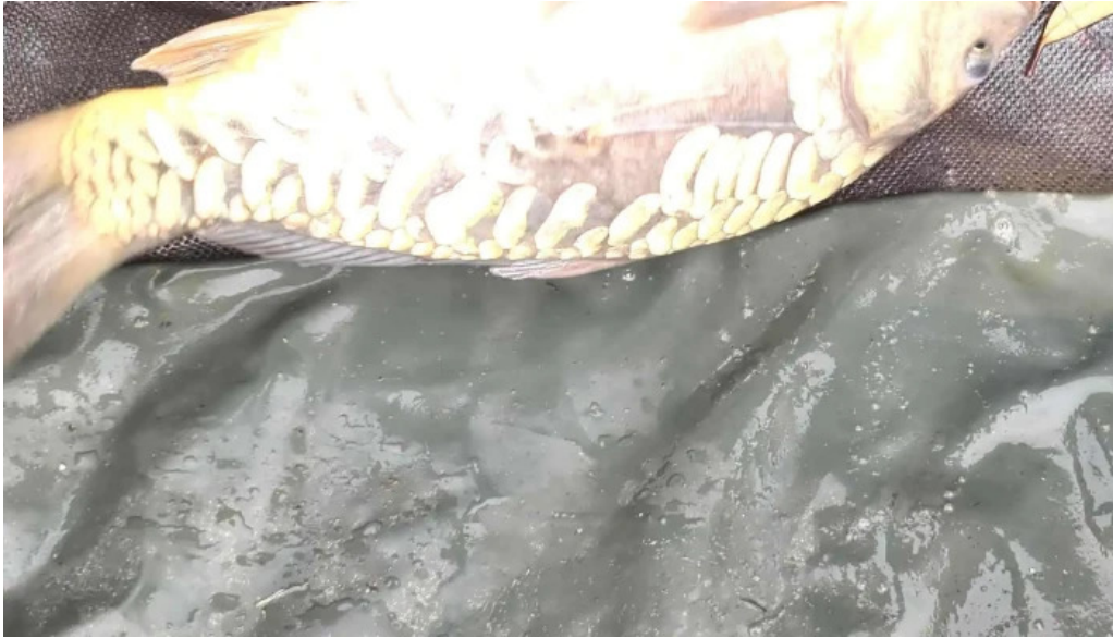
Balta de la branistari scor