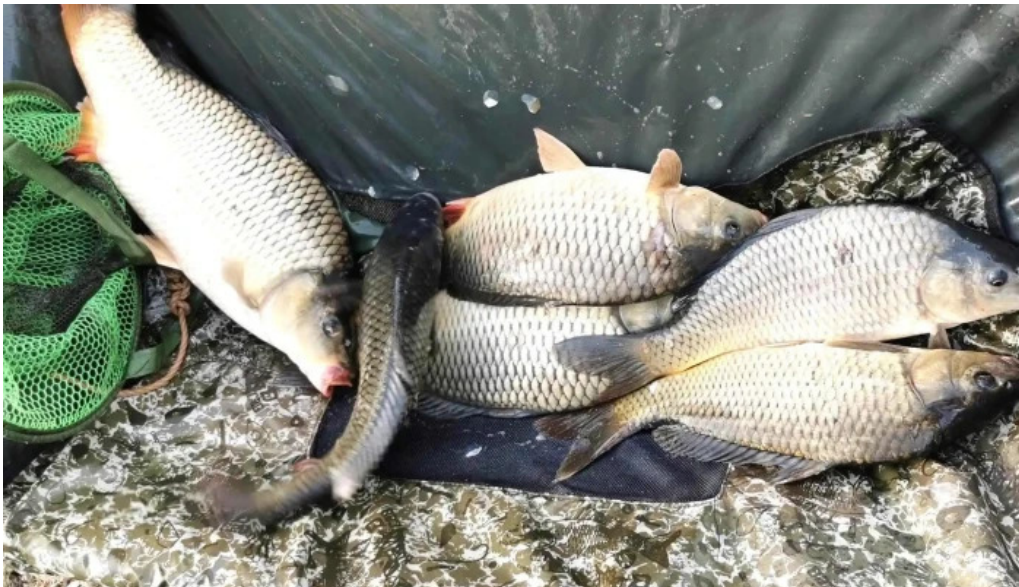
Balta de la branistari br?ni?tari