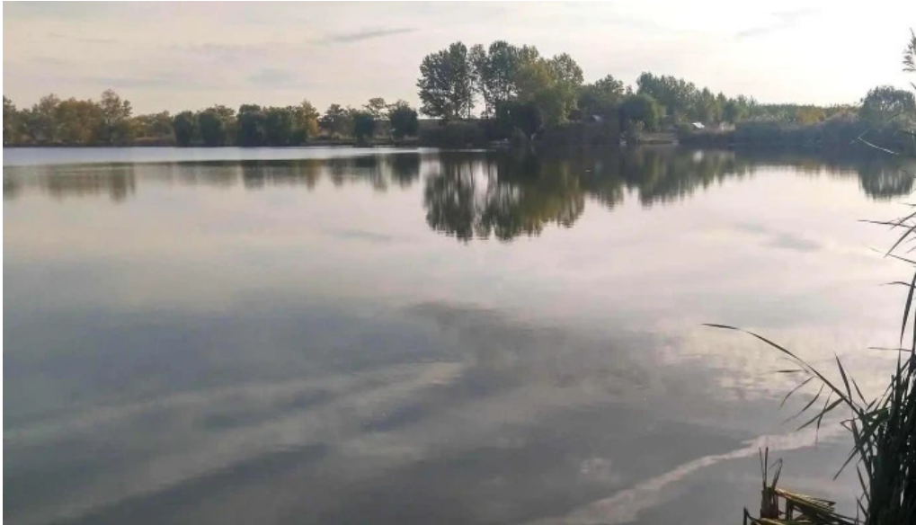
Balta de la branistari comentarii