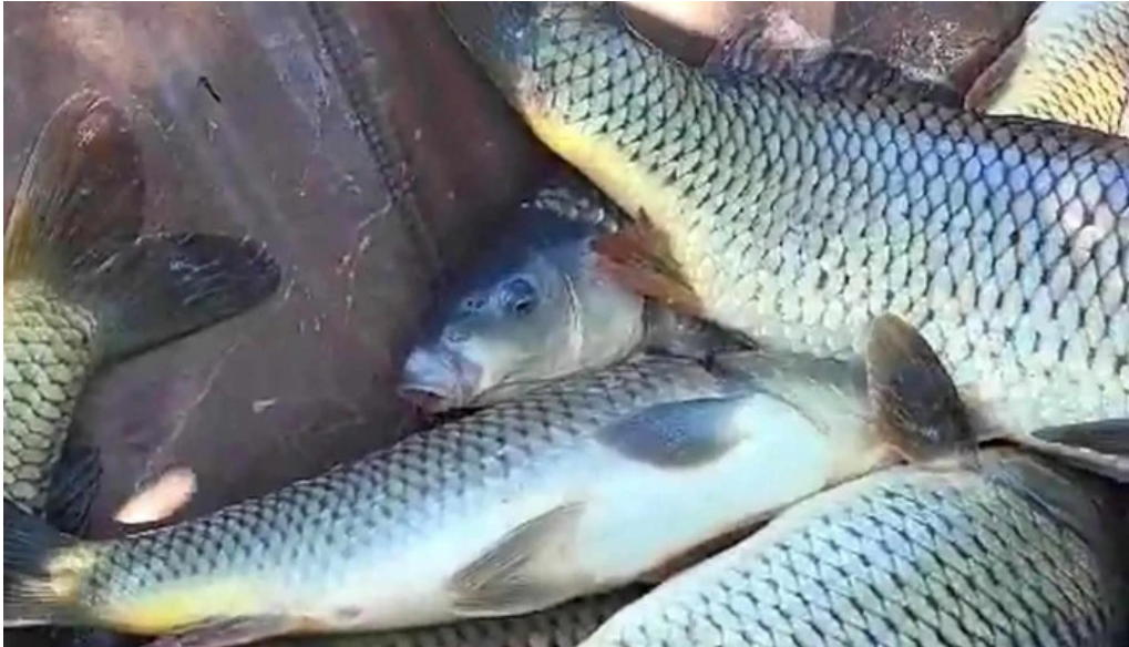
Balta de la branistari aproape de mine