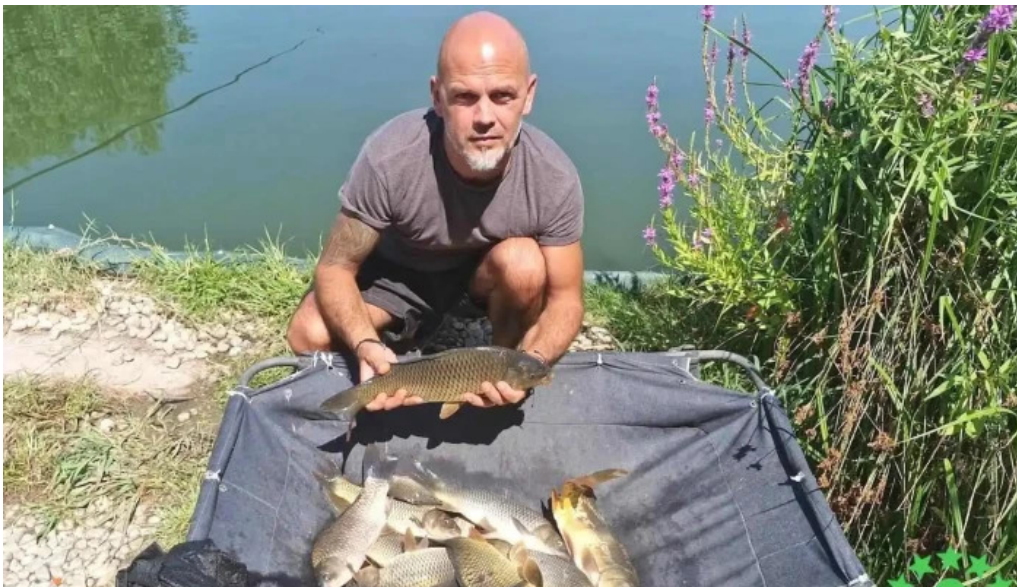
Balta de la br?ni?tari br?ni?tari