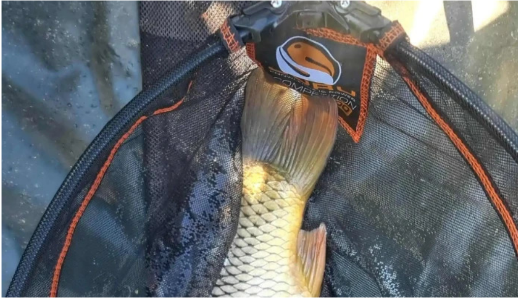
Balta de la branistari loca?ie