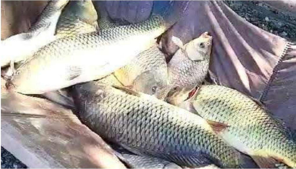
Balta de la branistari videoclipuri