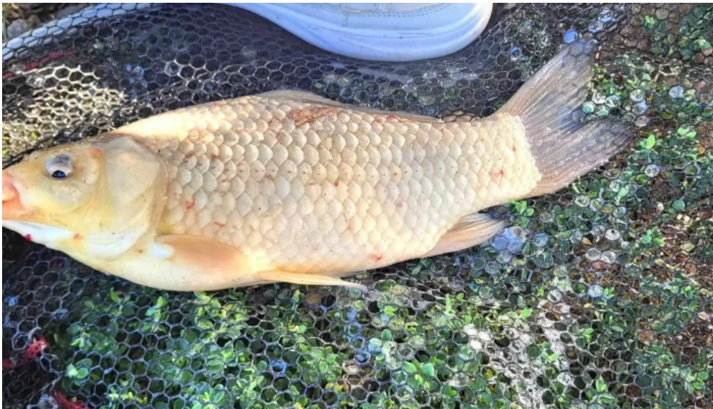
Balta de la branistari telefon