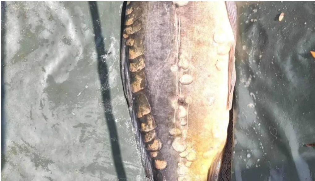
Balta de la branistari cum s? ajungi acolo