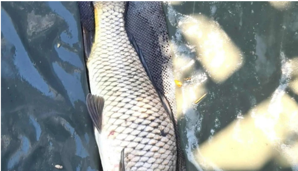
Balta de la branistari promo?ie