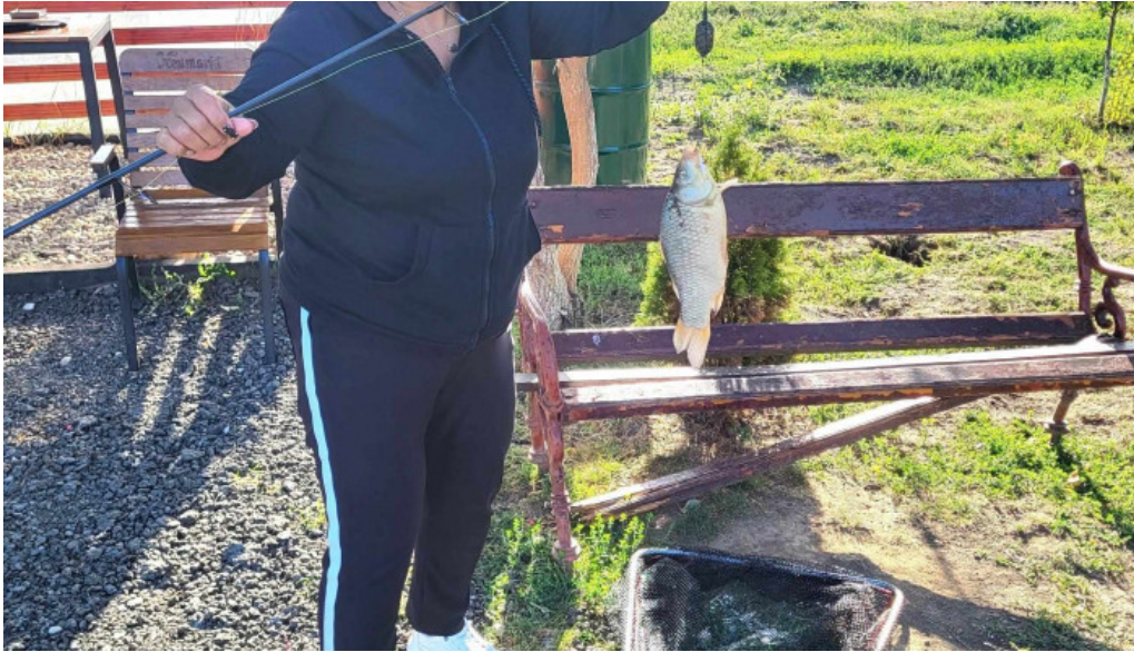
Balta de la branistari deschis acum