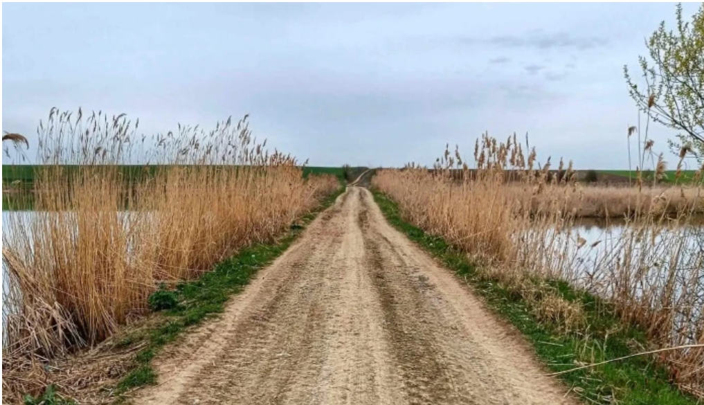
Balta 6 butimanu reduceri