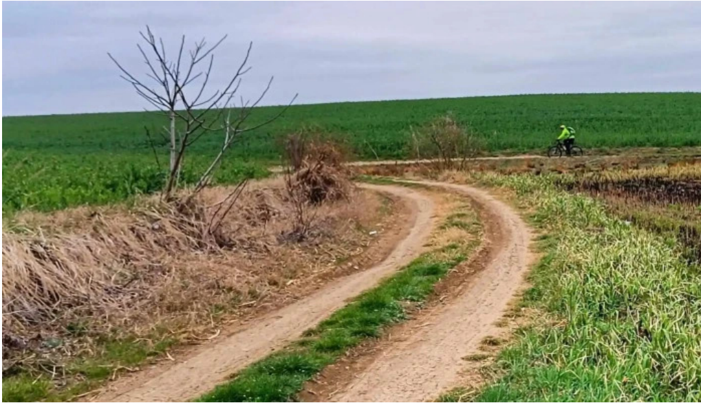
Balta 6 butimanu promo?ie