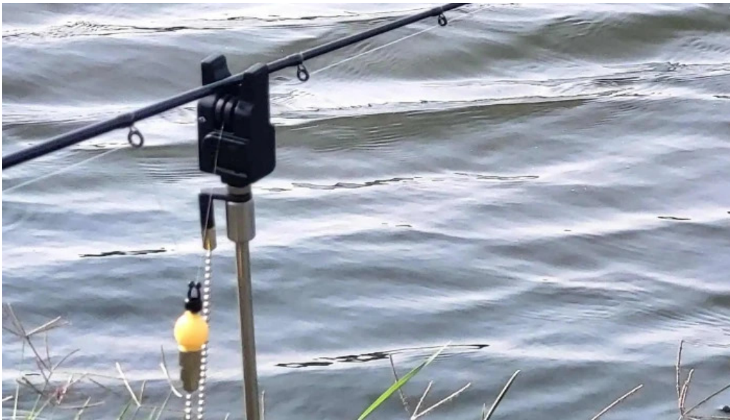
Balta 6 butimanu butimanu