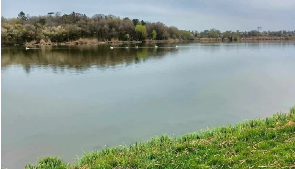
Balta 6 butimanu adres?