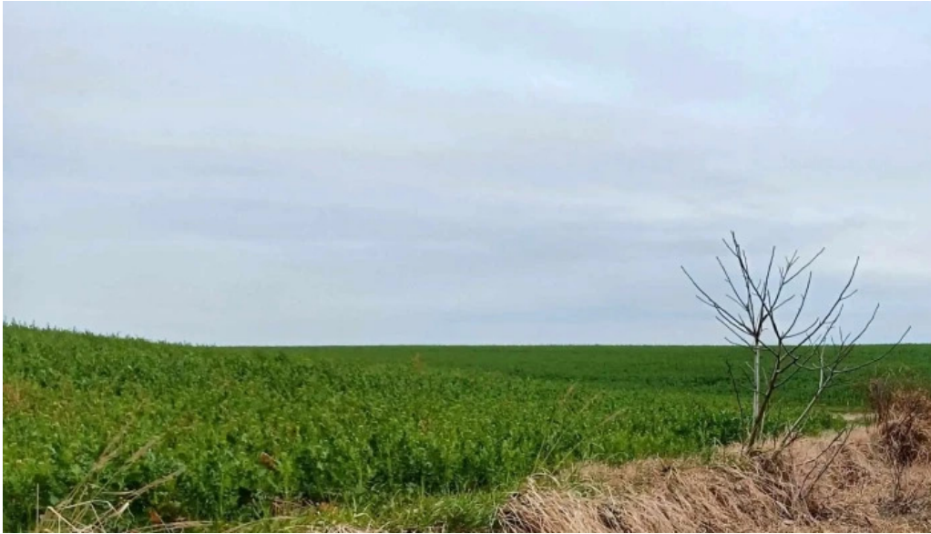
Balta 6 butimanu cum s? ajungi acolo