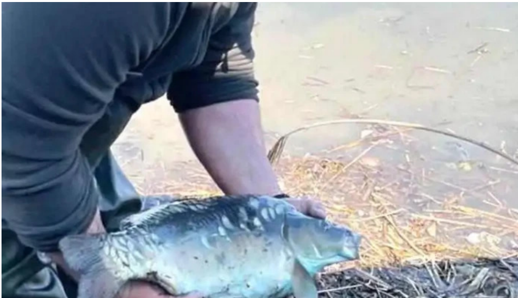
Balta 6 butimanu de la proprietar