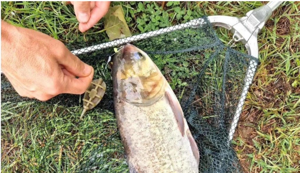
Balta 6 butimanu program