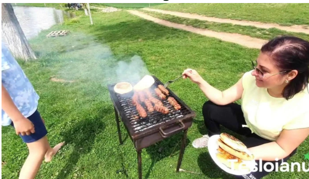
Belciugatele 5 pescar pe orice vreme videoclipuri