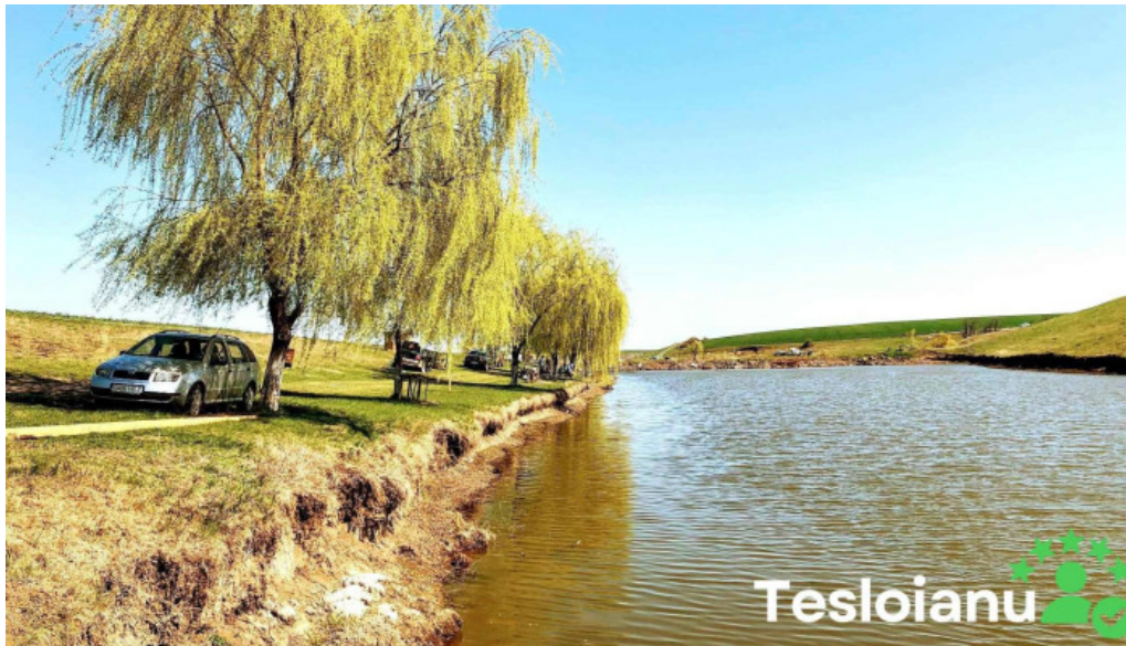
Belciugatele 5 pescar pe orice vreme deschis acum