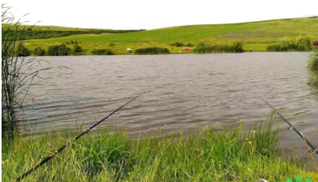
Lac pescuit langa cojocna catalog