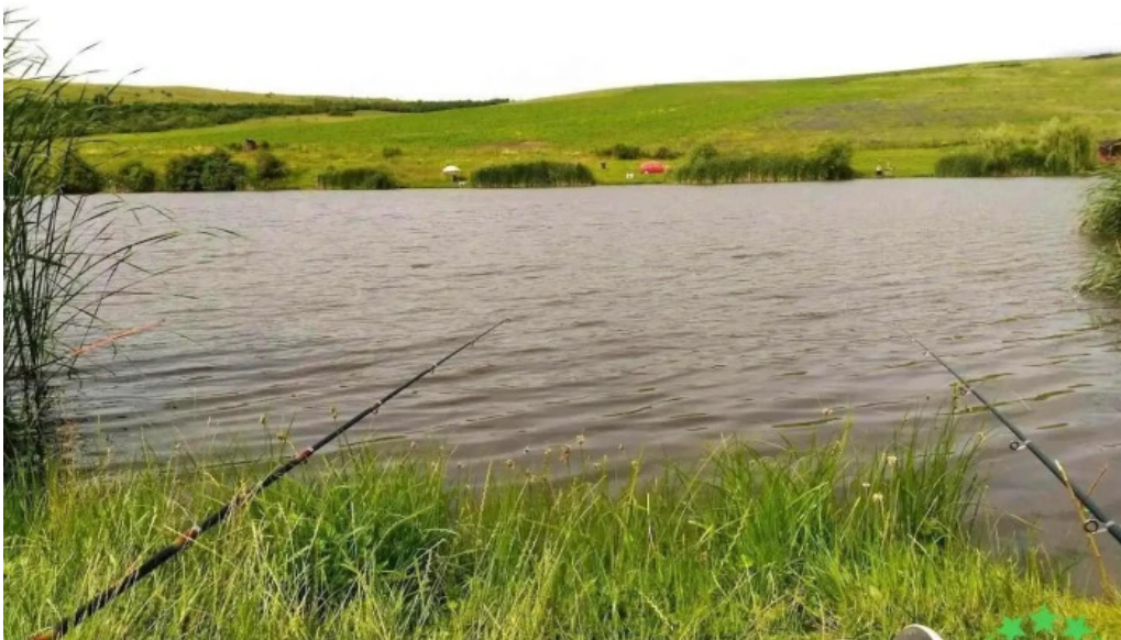
Lac pescuit langa cojocna romania