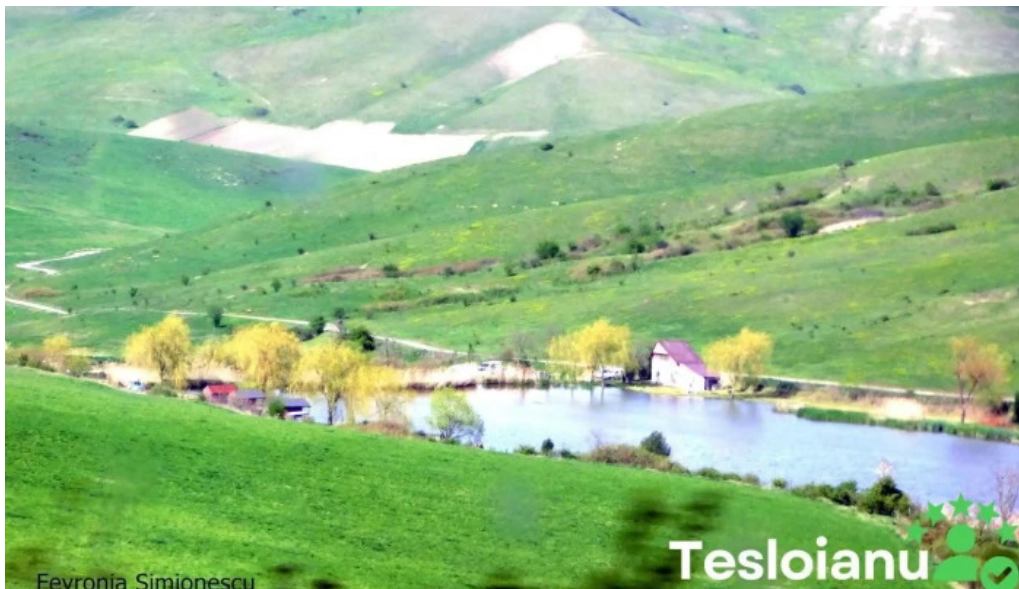
Lac pescuit langa cojocna munte