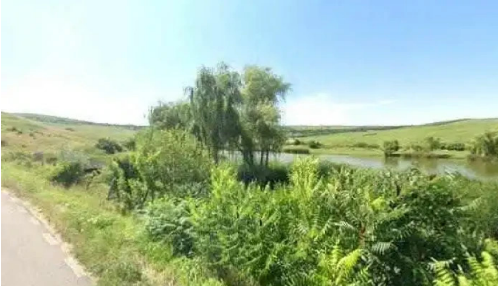
Lac pescuit langa cojocna street view si 360deg