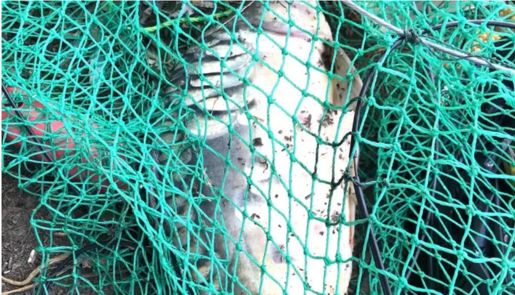
Lac siliste cum s? ajungi acolo