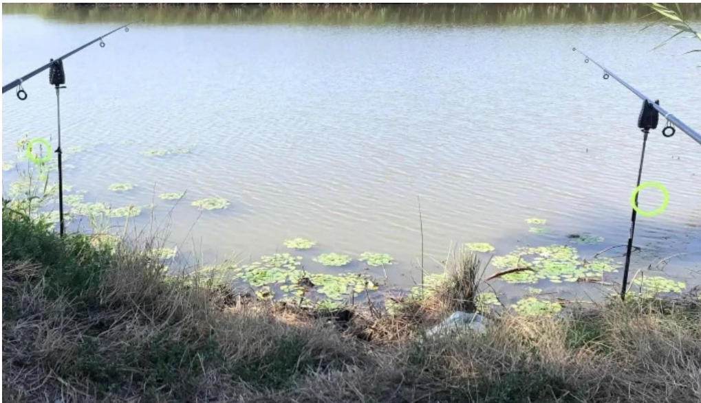
Lac siliste comentarii