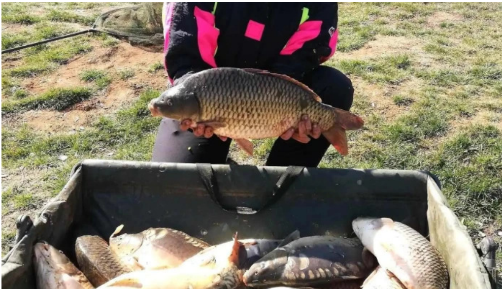
Lac siliste de la proprietar