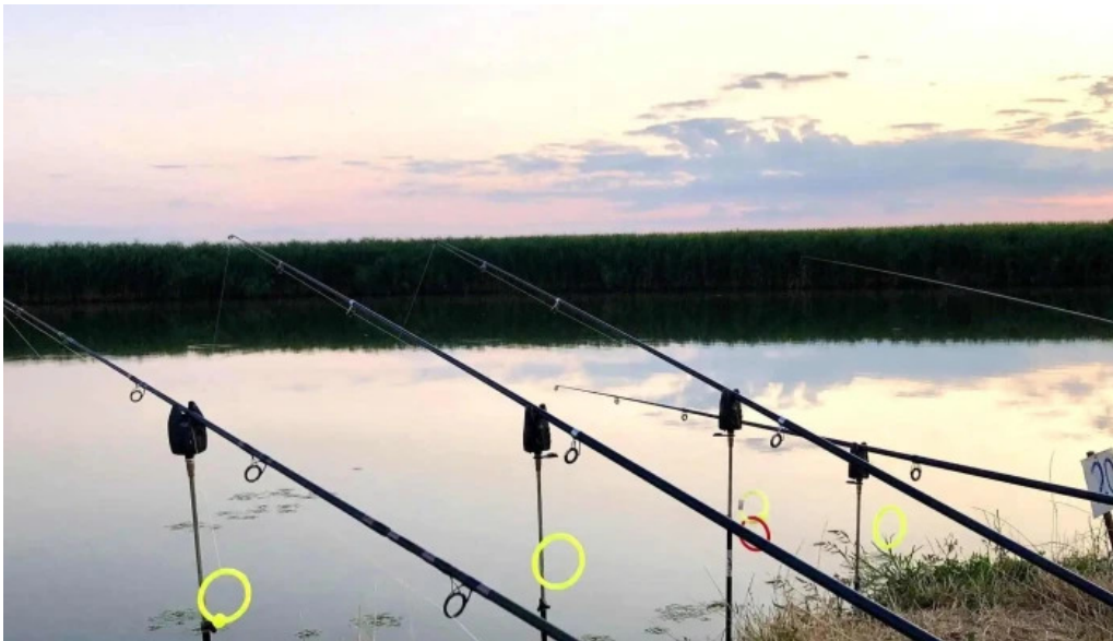
Lac siliste fotografii