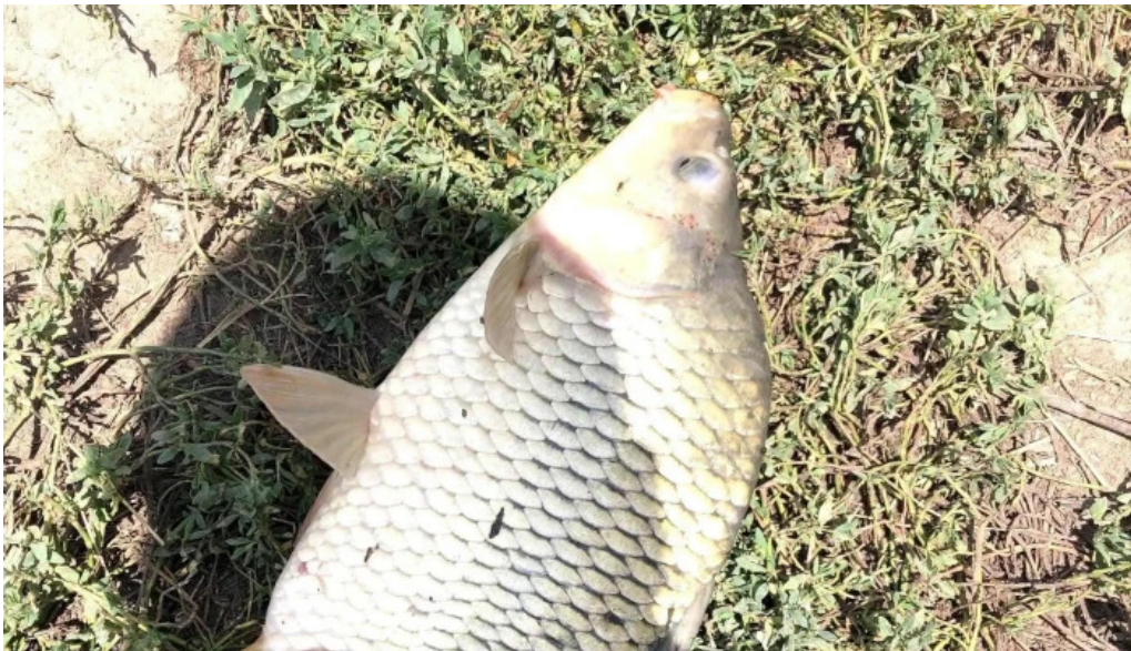
Lac siliste suseni