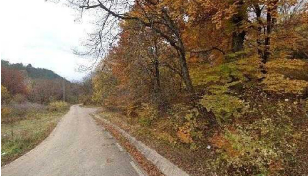
Taul de la gura baciului street view si 360deg