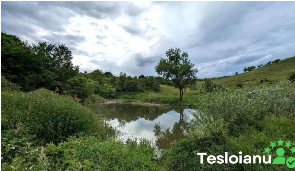
T?ul de la gura baciului unnamed road