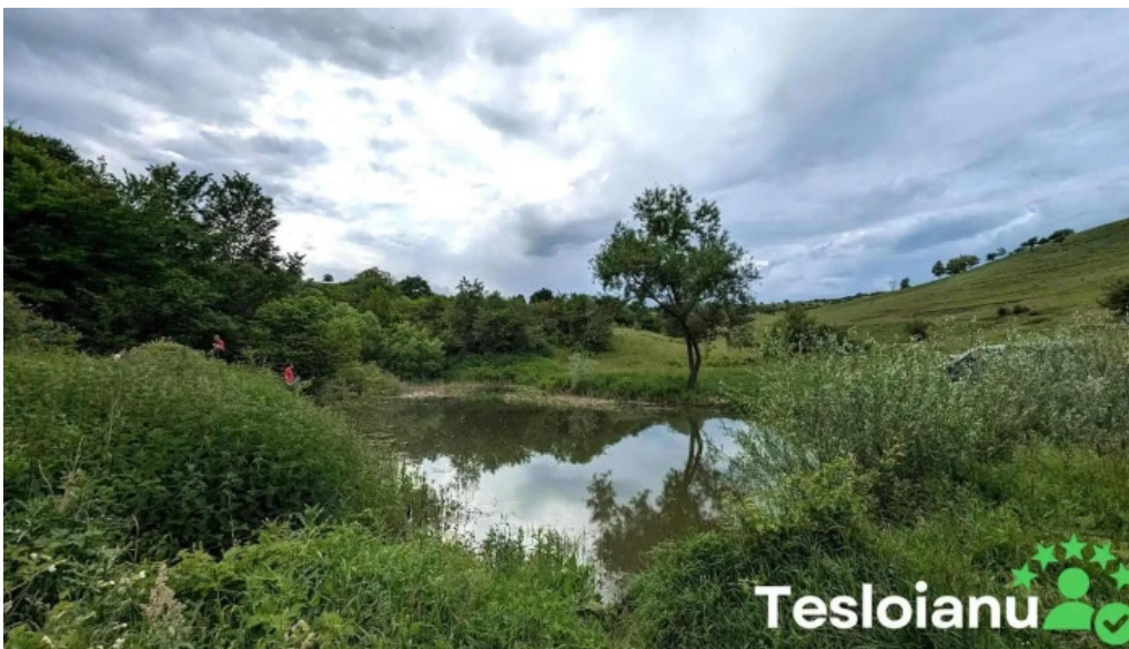
Taul de la gura baciului unde