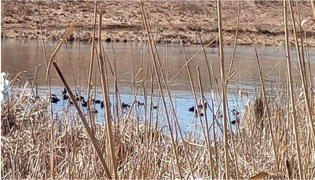
Lacul chinteni comentarii