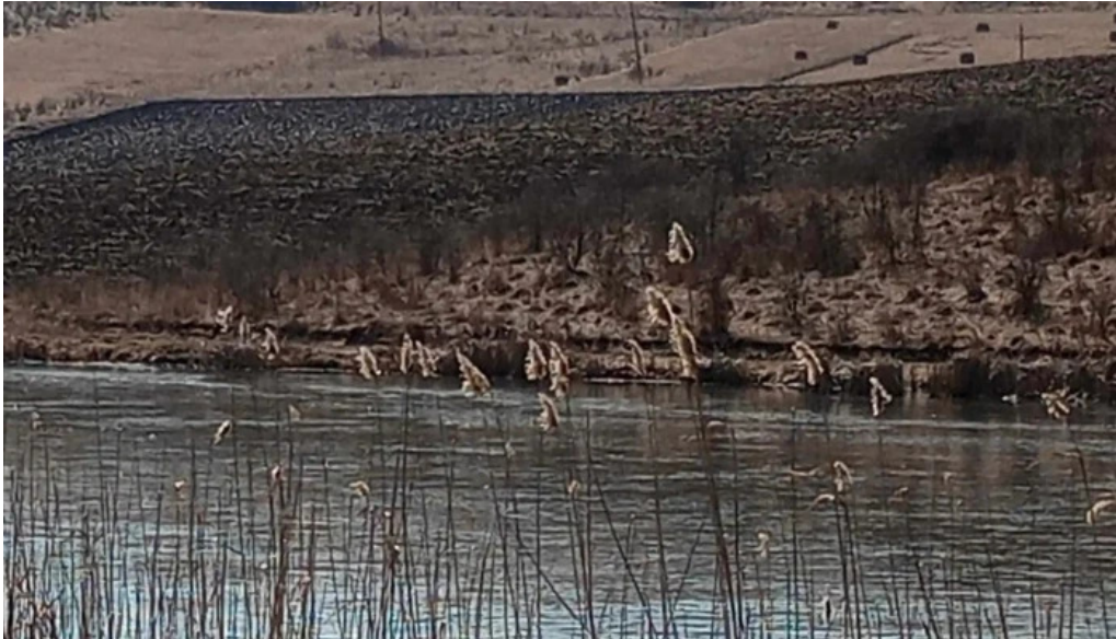
Lacul chinteni instagram