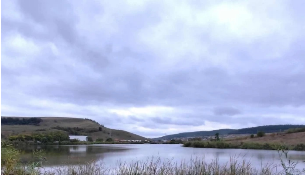
Lacul chinteni fotografii