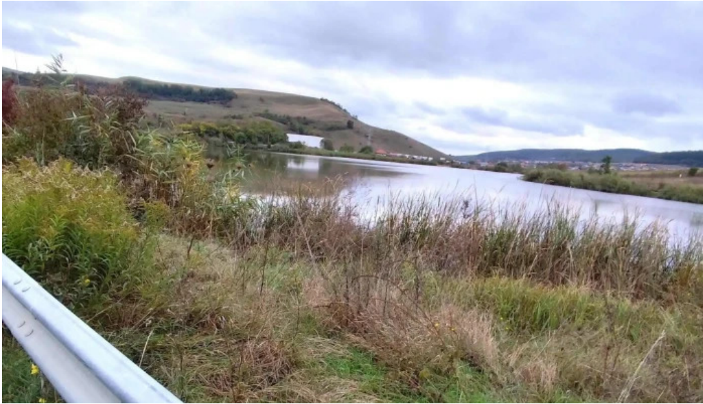
Lacul chinteni recenzii