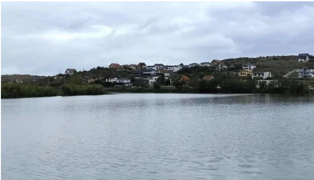
Lacul chinteni deschis acum