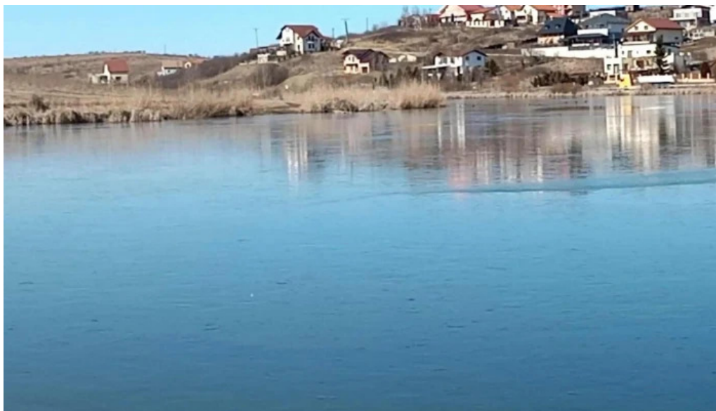
Lacul chinteni reduceri