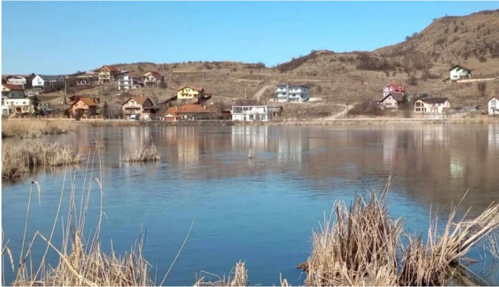
Lacul chinteni aproape de mine