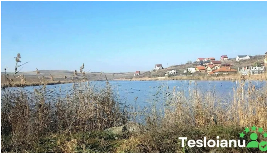
Lacul chinteni videoclipuri