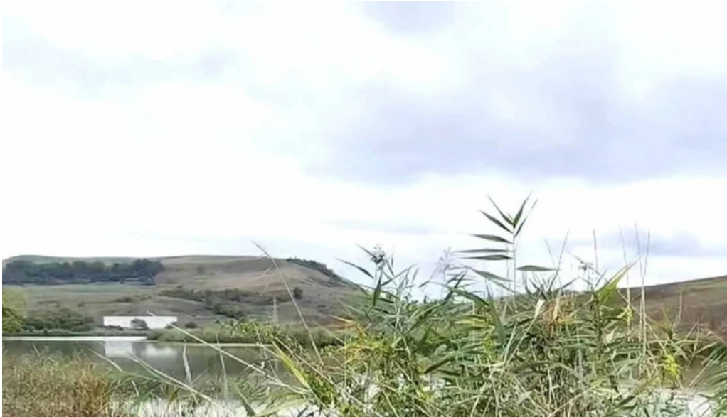
Lacul chinteni chinteni