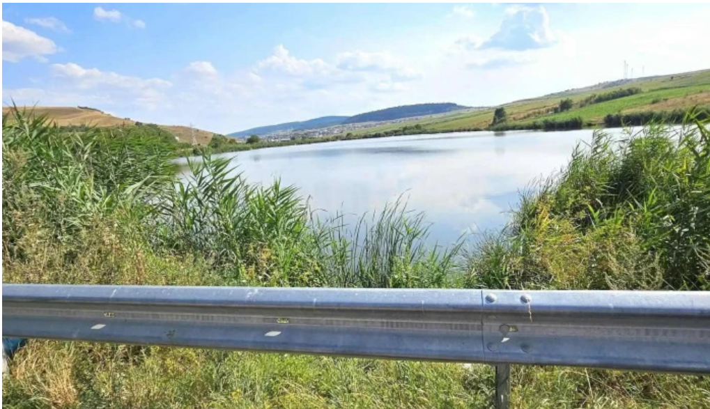
Lacul chinteni program