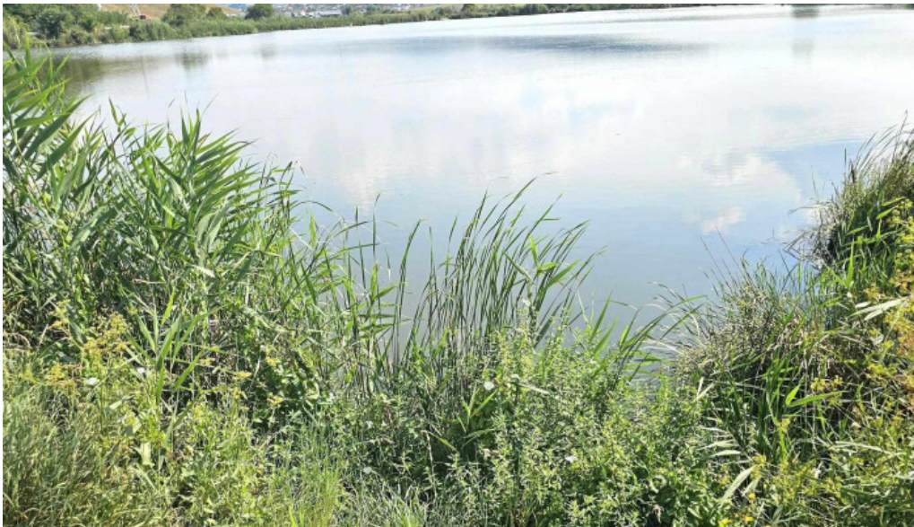
Lacul chinteni adres?