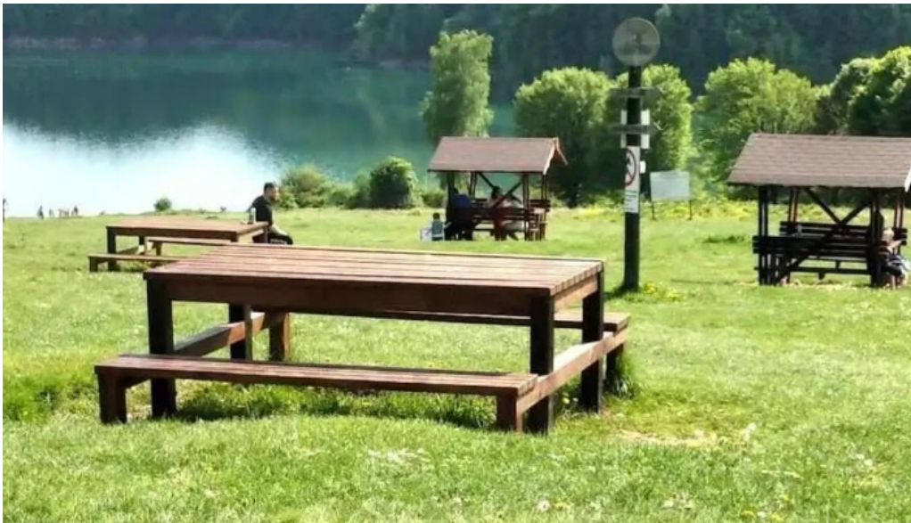
Lacul doftana munte