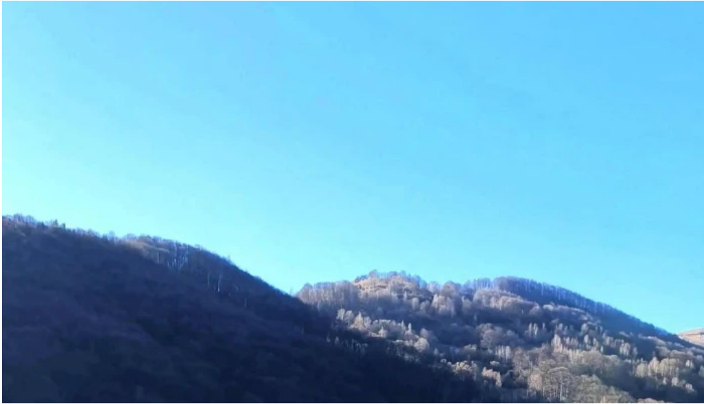
Lacul doftana instagram