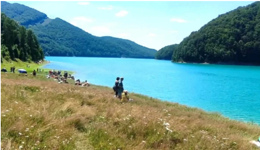
Lacul doftana site web