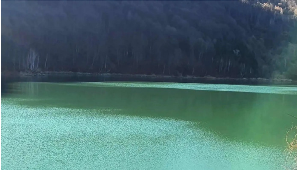
Lacul doftana doftana