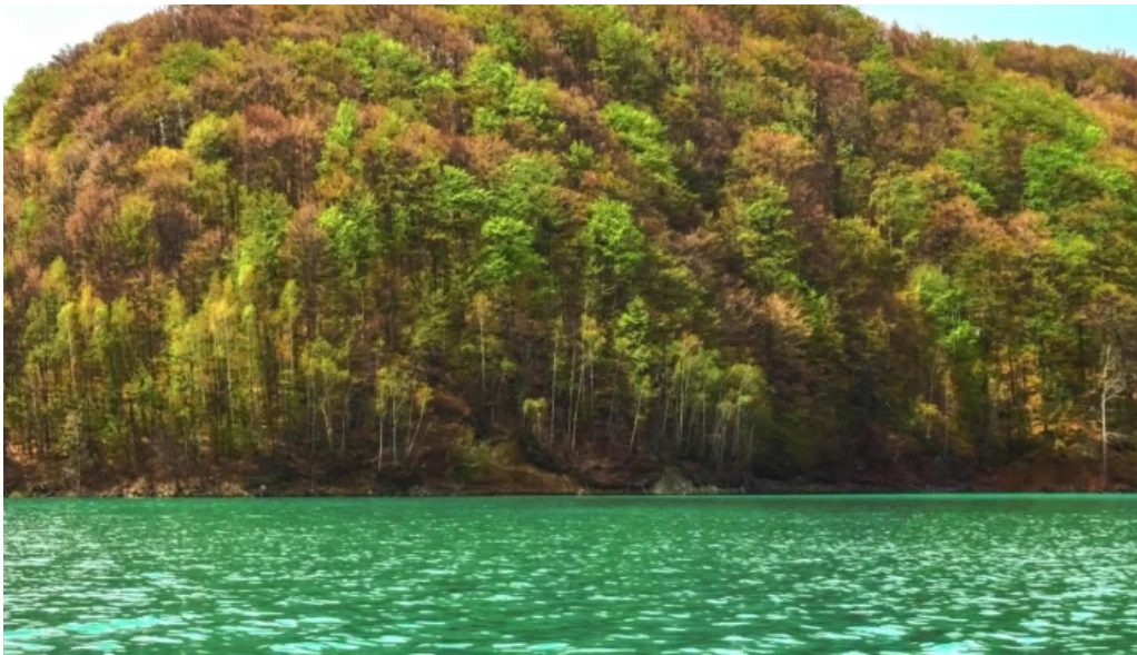
Lacul doftana promo?ie