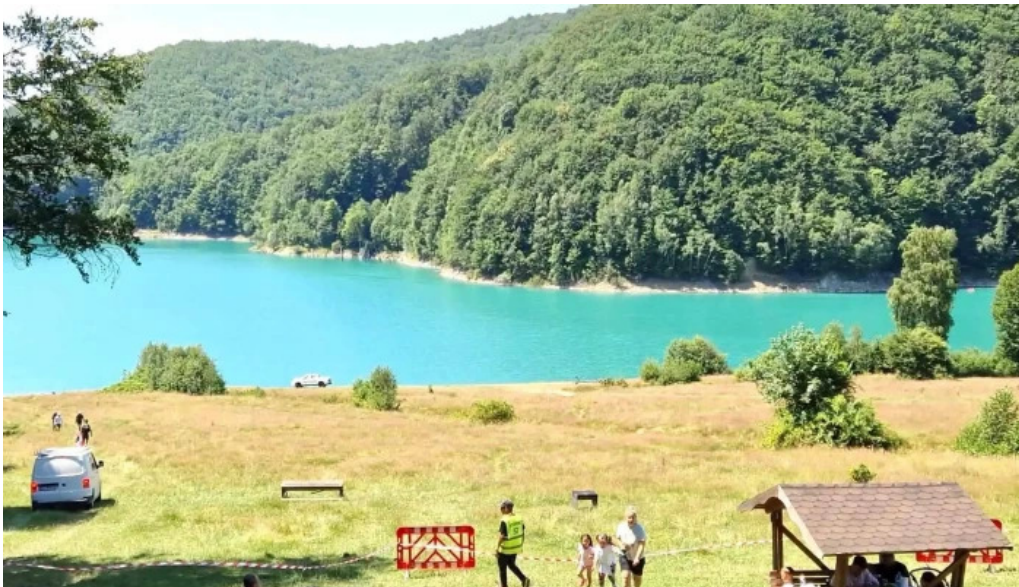
Lacul doftana pre?uri