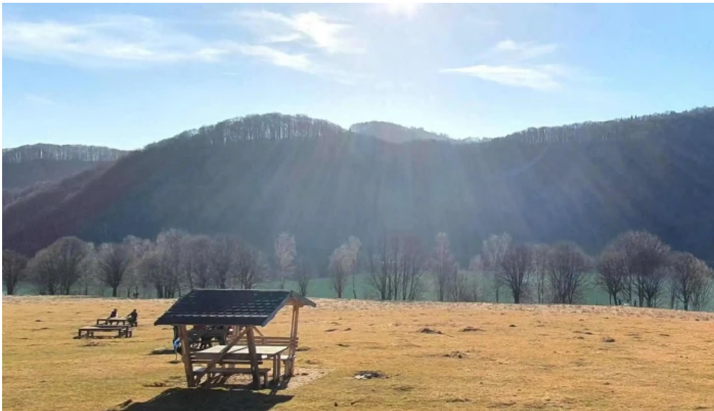
Lacul doftana program