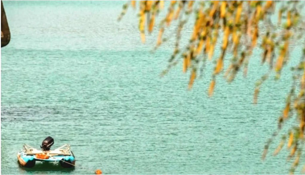
Lacul doftana scor