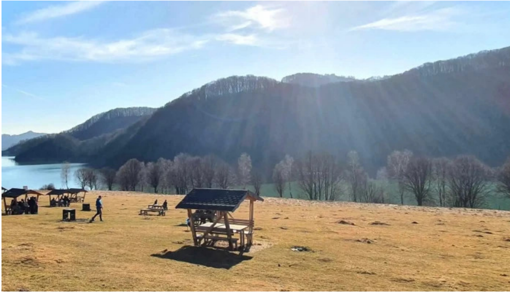
Lacul doftana zon?