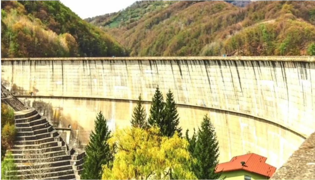
Lacul doftana num?r