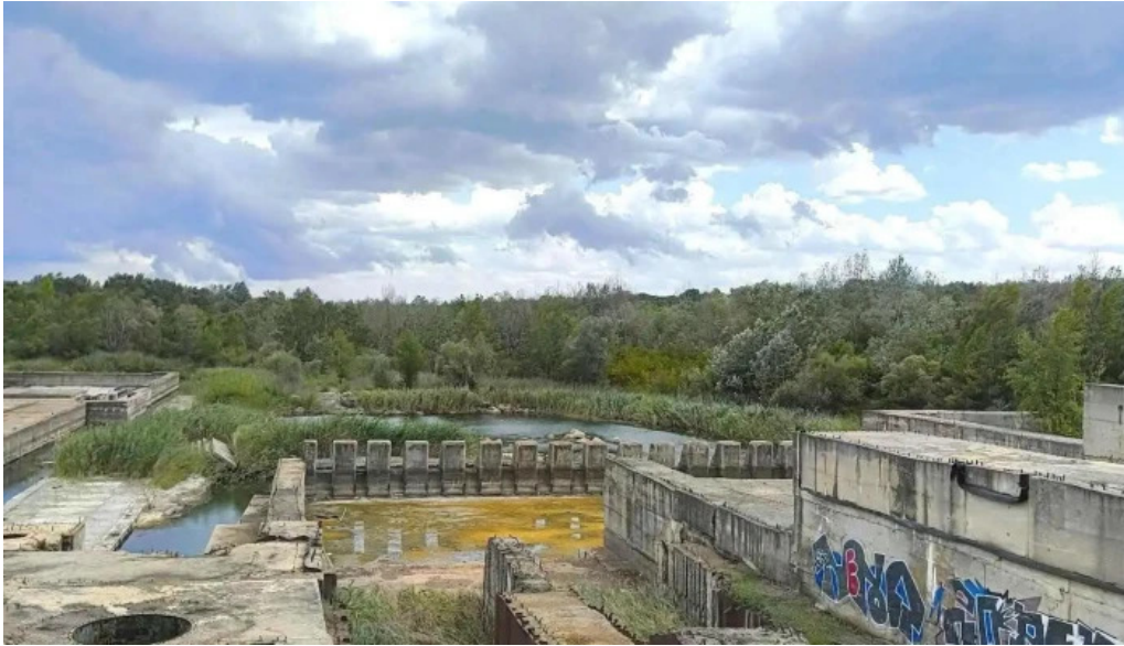
Ecluza de la copaceni comentarii